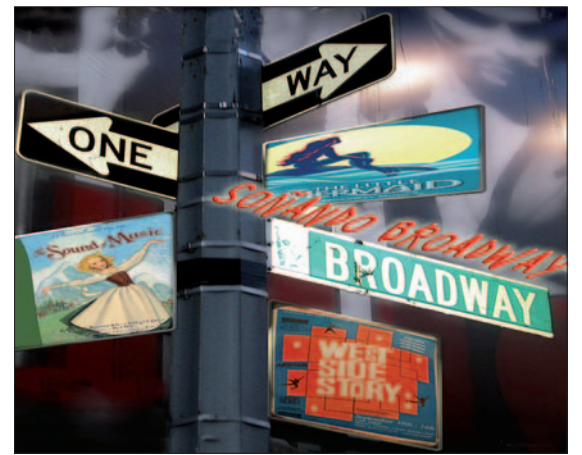
Una de las imágenes de Soñando Broadway . / Getafe en clave

escenografía basada en la proyección de imágenes. Un día después, el domingo 19 (18 y 20 horas) queda la representación por parte de Iérbola de Una noche mágica , un espectáculo lleno de humor en la que a través de los villancicos se cuentan historias como la de una pareja que está a punto de dar a luz, la de un empresario gruñón o la de un vigilante de obra gitano. El lunes 20, a las 19.00 horas, el Lorca concluirá su particular maratón con el concierto de Navidad de los alumnos y profesores de la Escuela municipal de música Maestro Gombáu. El aperitivo a estos grandes conciertos es el ciclo Encuentro de Música en Navidad, que se cerrará el jueves 16 y el viernes 17, a partir de las 19.00 horas, tras comenzar el martes 14.