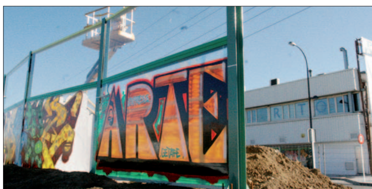
Imágenes de las pantallas que se están colocando en la A-42.

aunque han transmitido que todavía no saben si estas vallas entrarían dentro del concurso, puesto que todavía se está negociando con la junta de compensación. Los empresarios, además, manifiestan que las pantallas se colocan para preservar la salud de los vecinos, y por lo tanto, al no haber todavía vecinos en la zona, no son necesarias. Se han puesto en contacto con la junta de compensación, hablaron ya en su día con el concejal de Urbanismo y han solicitado reuniones con responsables del Ayuntamiento para evitar la colocación de las pantallas o por lo menos que sean, como se prometieron, transparentes. Han manifestado que van a hacer todo lo necesario para que se cumpla el proyecto y en el caso de que finalmente las vallas se pinten y tapen sus negocios "acudiremos a los tribunales si es necesario por daños y perjuicios".