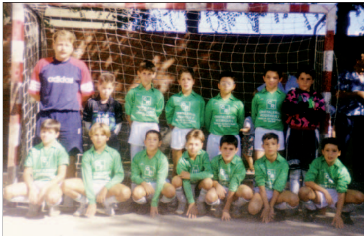
Equipo benjamín de la temporada 1994/95.