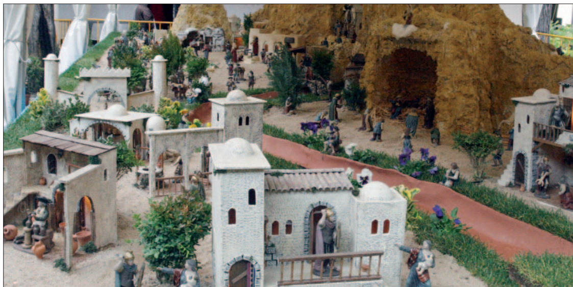
Belén murciano que se exhibe en el Hospitalillo.