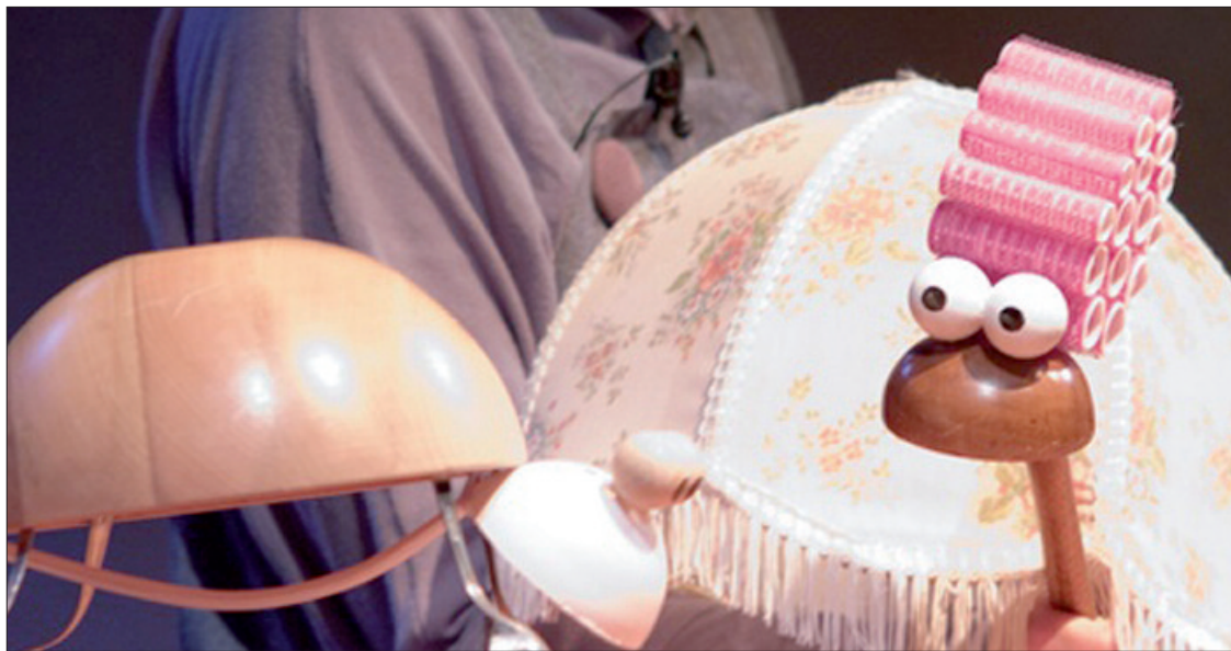
La tortuga Joan, protagonista de la obra Me duele el caparazón , en el Lorca el 22 de diciembre.

Un pedazo de selva llegará al escenario del García Lorca en fechas navideñas. Entre medio de la vegetación, y de los animales, Mowgli, este niño que creció en el mundo salvaje, inventado por Kipling para El libro de la selva . Con esta obra de teatro arranca el octavo festival infantil Cuentos de Navidad, el 21 de diciembre (19.00 h.), y hasta el 7 de enero (día ampliado por demanda) se sucederán sobre las tablas historias y más historias para niños y no tan niños, con títeres, marionetas o personajes. Entre las funciones, aparte de Mowgli , se representarán Me duele el caparazón , Josefina , Cuentos del mundo o Lola . Con "estética muy titiritera", como explica el director de Mowgli , Paco Pérez Guirado, pero sin ser "los típicos títeres" (sino que hay de guante, de guiñol, de manipulación en mesa y otras técnicas), aparecerán en la escena dos actores que manipulan los muñecos y que narran los acontecimientos transmitiendo "solidaridad, amistad, fraternidad y el equilibrio entre los mundos salvaje y humano". Estos son los mensajes que se envían dentro de "un espectáculo ágil, diver-