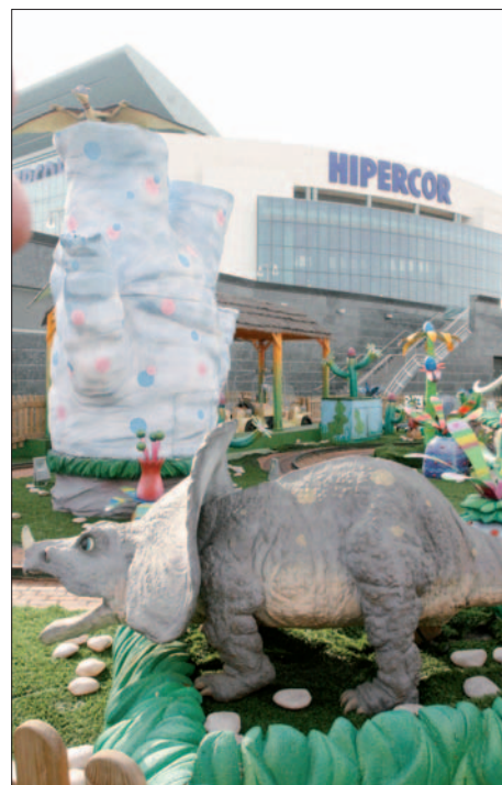
Cortylandia también está en El Bercial.

El Corte Inglés, aparte de centro comercial, es un centro para el ocio, para estar, para pasear, para aprender... Es la filosofía de "dar un servicio integral" y con ese fin, la firma prepara, en todas sus superficies, una serie de actividades infantiles "que queremos que sirvan de polo de atención". Este año El Bercial cuenta con el mayor programa de propuestas hasta la fecha. "Vamos creciendo cada vez más", cuenta su director, y así, durante diciembre y enero, y dentro de una guía para niños llamada Pitiñú se proyectan películas, hay teatro, cuentos, música... "que gusta a pequeños y a padres. De hecho, hemos tenido que cambiar de ubicación por la afluencia de público a este tipo de actividades". Una de las atracciones, un clásico además de El Corte Inglés, es Cortylandia, que en El Bercial