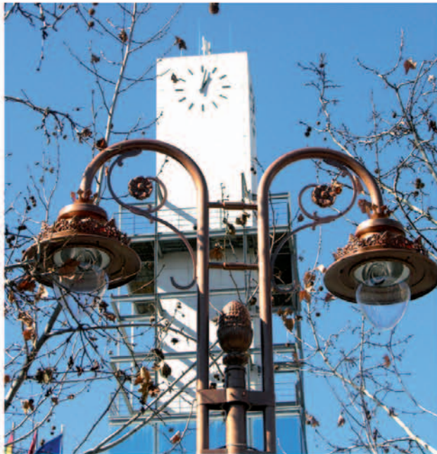
Torre del Ayuntamiento