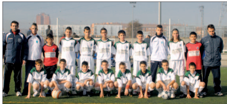
Actual equipo cadete, que el año pasado ascendió como infantil.