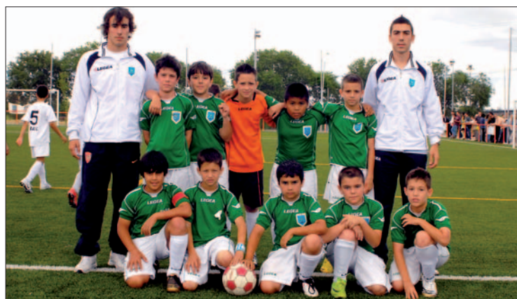
Equipo Alevín B de la presente temporada.