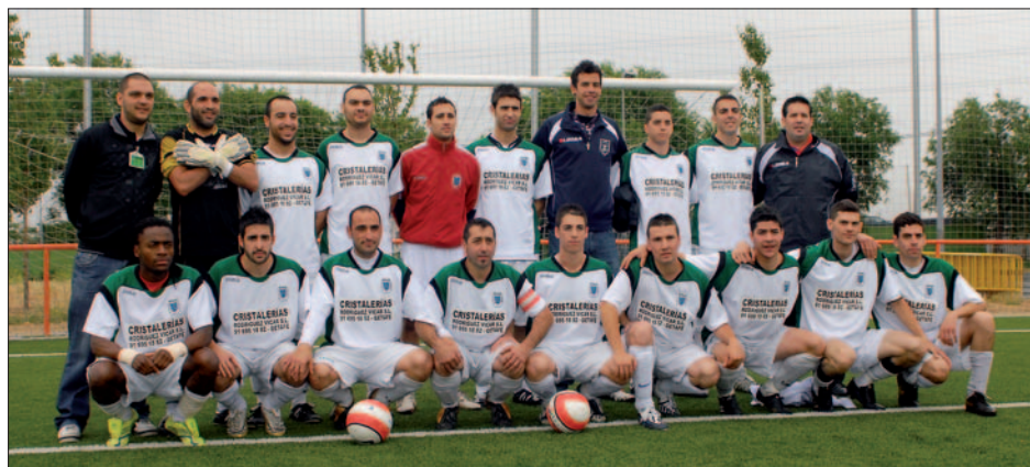
Equipo sénior que juega en 2ª Regional, tras conseguir el ascenso la pasada temporada.