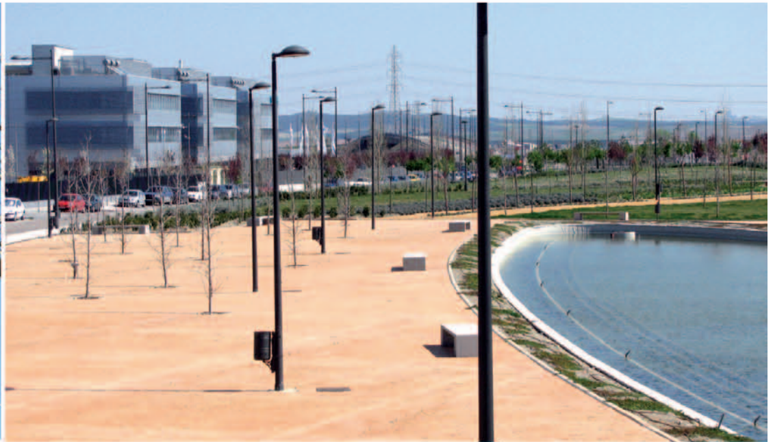
Polígono de La Carpetania

En lo que se refiere industrial, la transformación de Getafe también ha sido espectacular. De ser un municipio con unos polígonos deteriorados, hoy cuenta con unas áreas industriales punteras. La creación de la OPI supuso un antes y un después para el municipio en este sentido. Tanto aquella como la Agencia de Desarrollo Local Getafe Iniciativas, han contribuido a esa nueva realidad desde una actuación que ha tenido en cuenta los numerosos factores que influyen para fomentar la actividad económica y, en definitiva, el empleo.