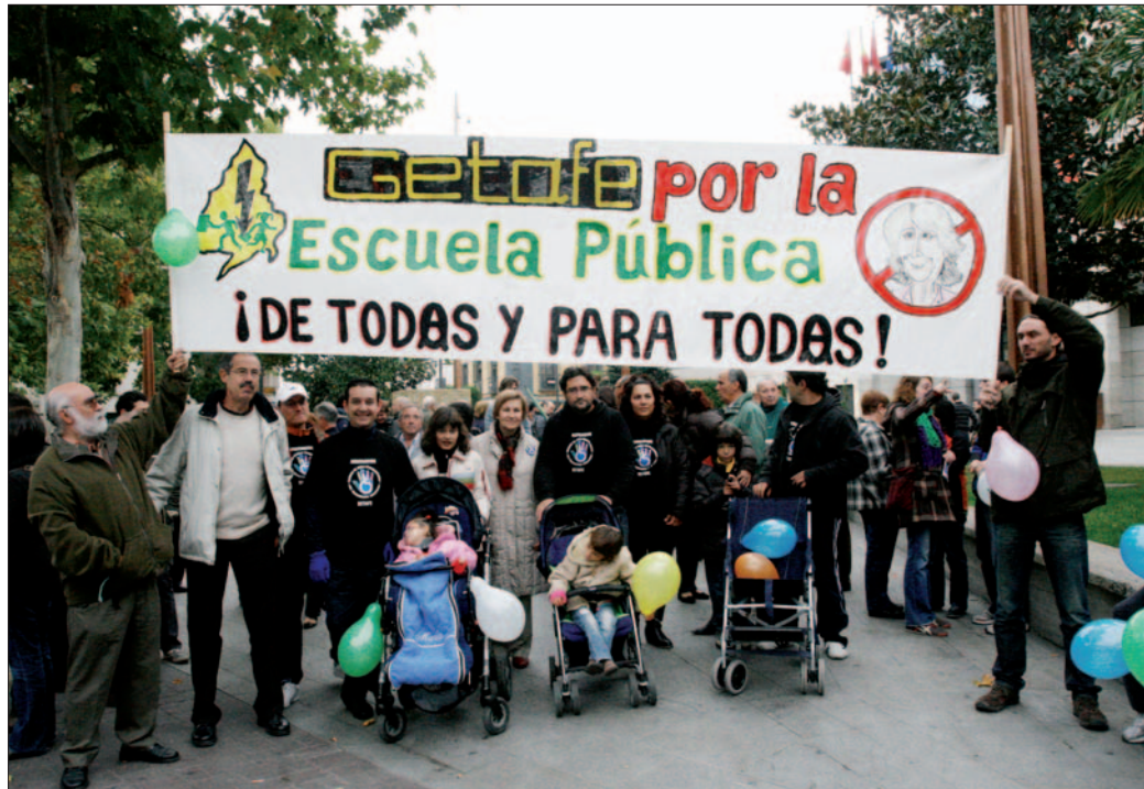
Manifestación del pasado mes de noviembre que apoyaba la educación pública.

Plataforma de escuela pública de Getafe, explica que para entender esta situación es necesario exponer ciertos antecedentes: "En los últimos 30 años ha habido un dominio creciente de las políticas neoliberales en el mundo, aunque en España lle-