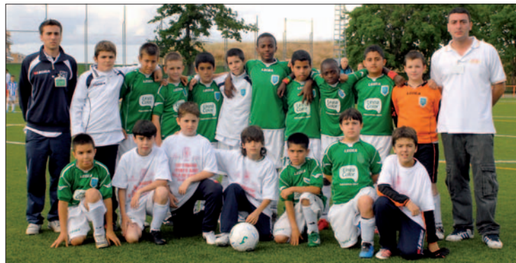
Equipo Alevín A de la presente temporada.