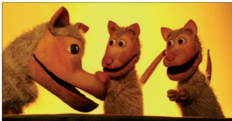
Mowgli, El libro de la selva, obra que convertirá el teatro en una jungla.