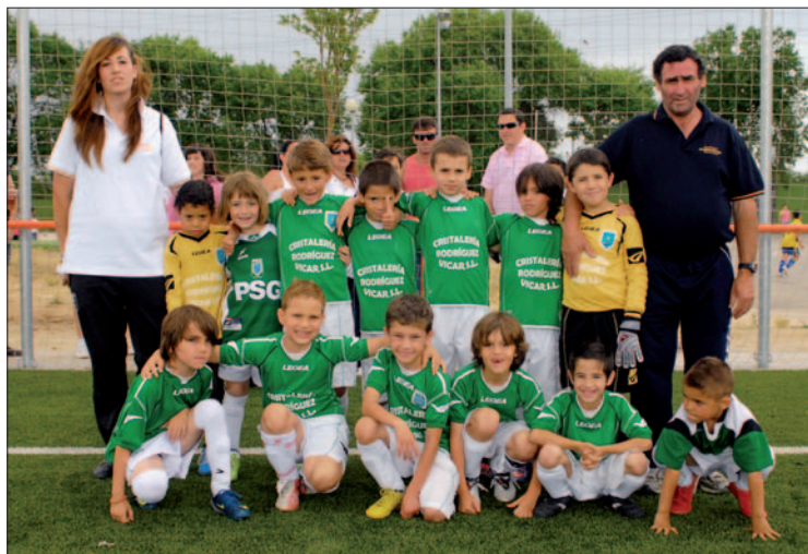
Equipo de categoría benjamín de la presente temporada. / AD Juventud Canario