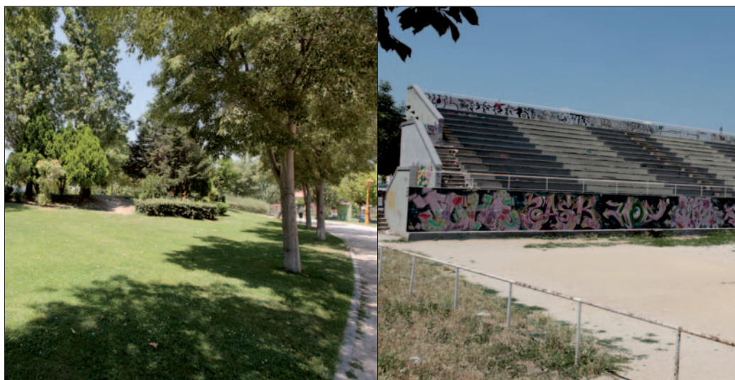
Dos vistas contrastadas del Parque de Castilla-La Mancha.

Por su parte, Perales del Río planea remodelar alguno de los parques de que dispone con más árboles, mientras en El Bercial están satisfechos con los que disponen, aunque piden que se haga algo con el caballón. Es en este espacio para el que Cristina González desvela el proyecto “de un macrojuego infantil en