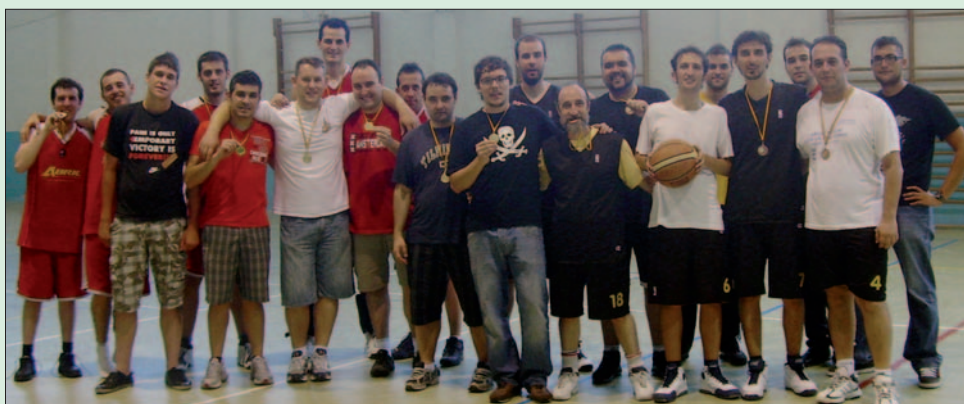
Finalistas del triangular de baloncesto.