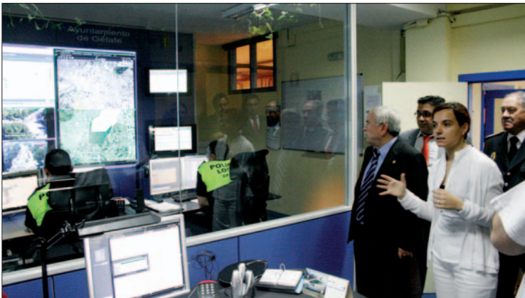
El nuevo Centro de Gestión de Tráfico localizado en la sede de la Policía Local, en el Sector III.