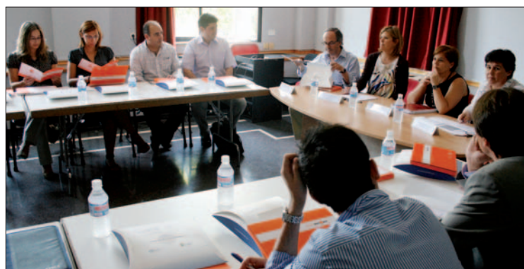
Empresarios de Getafe durante la ponencia.