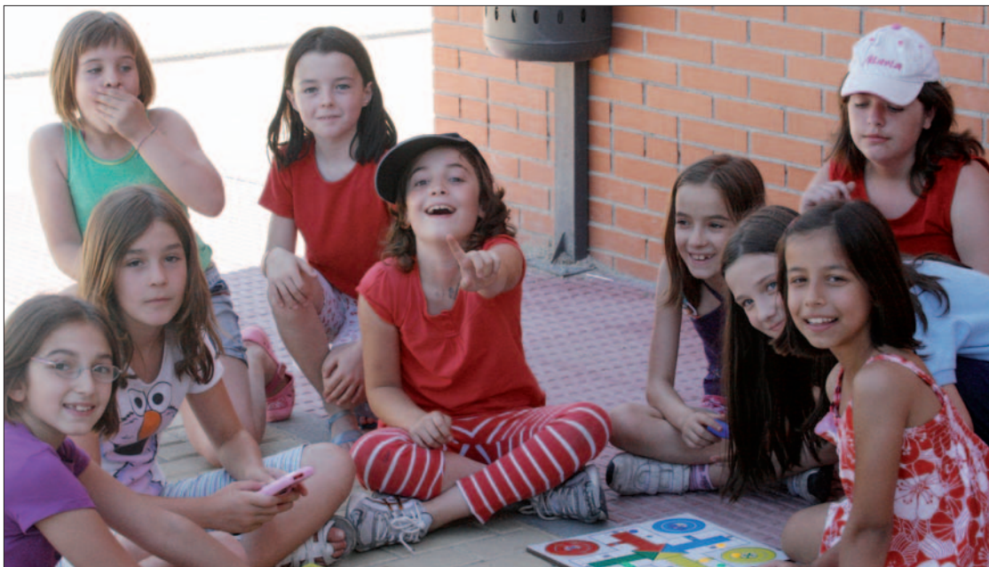
Varias niñas en el patio de verano del colegio Ana María Matute.

Un año más el verano trae consigo las vacaciones escolares, el tiempo libre y el ocio de los más pequeños. Ya no hay que ir a clase, ni hacer deberes, ni madrugar, es hora de jugar y divertirse. Pero muchos padres se preguntan ¿dónde?