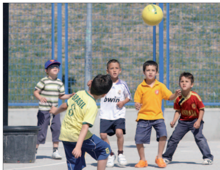
Un grupo de niños en el colegio Ana María Matute.

Villaempanadilla, Candelero, Moco-coco o Azulcity son algunos de los nombres de los pueblos y ciudades