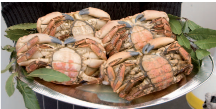
Producto gallego de una de las ferias celebradas.

Padrón, chorizo estoupado al Ribeiro, oreja de cerdo cocida y aliñada con aceite de oliva y pimentón de la Vera, navajas a la plancha, mejillones, lacón o queso y tarta de Santiago, "todo ello regado con Albariño y Ribeiro", serán algunos de los productos que acercará a los paladares presentes esta feria. El jueves, 15 de julio, a las 20.00 horas se abrirá la entrada a la carpa con la degustación gratuita; el 16, a las 22.00 horas, se proyectará la película Caminos de Santiago y al día siguiente, a las 20.00 horas, tendrá lugar el encuentro de peregrinos con mesas redondas, proyecciones e información sobre los caminos que llegan a Compostela, además de la actuación del grupo Gaitas Enxebre. El año pasado se celebró la primera edición y reunió a unas veinte personas, aunque ahora Capdevila espera muchas más. El día 24, a medianoche, Gran Queimada que se repartirá de forma gratuita a los asistentes. S.Z.