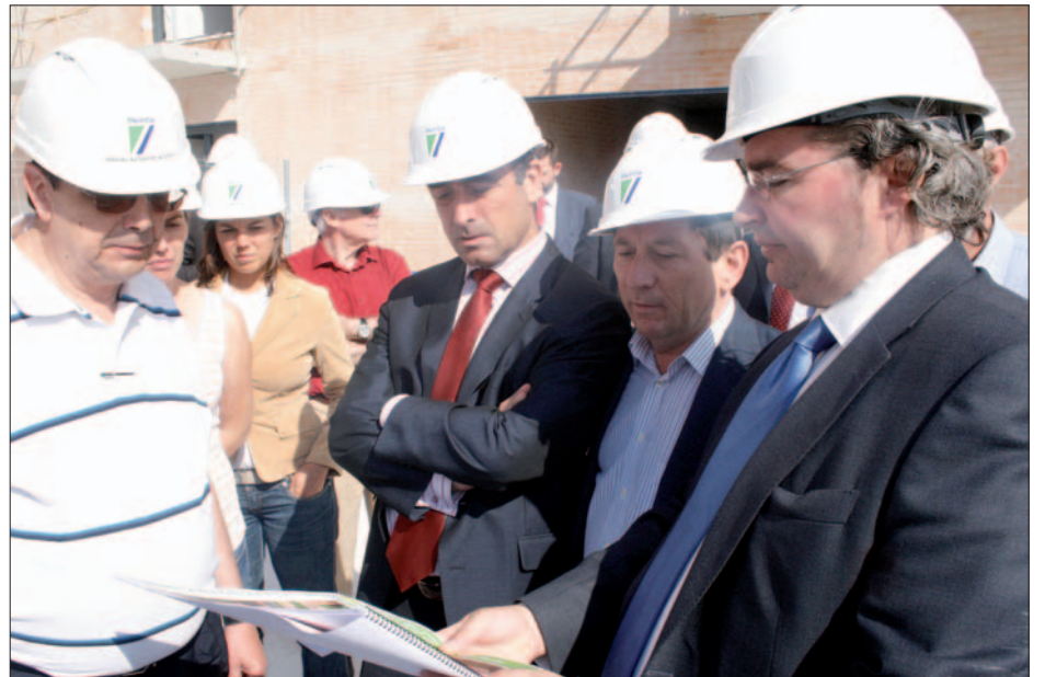
Visita de obras al edificio de Organización 2000 en Buenavista. / David Calle

Ya se ve el edificio completo, aunque aún restan muchos remates. No ha pasado un año desde que comenzaron las obras de edificación (empezaron en el mes de julio de 2009) pero Organización 2000 ya contempla en pie una de sus promociones, que acogerá 91 viviendas de protección oficial. La finalización de las obras está prevista para el mes de febrero, y en marzo se plantean poder entregar las primeras viviendas. Es la obra más avanzada del desarrollo de Buenavista y tanto José Manuel Vázquez, concejal de Urbanismo, como Ignacio Sánchez Coy, de Vivienda, se acercaron a la promoción para interesarse por el desarrollo de estas viviendas que tendrán alrededor de 70 metros cuadrados. Visitaron el piso técnico, donde se pueden contemplar las calidades que se están instalando en cada uno de los pisos, y sirve a su vez como piso piloto para ver el resul-