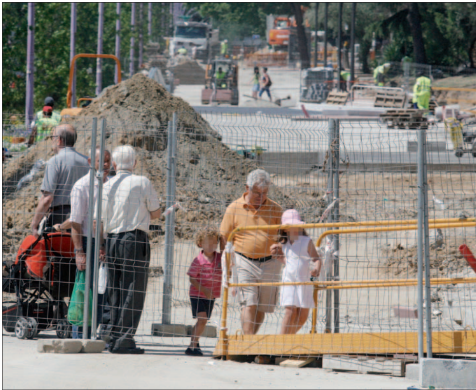
Los vecinos intentan sortear las obras para cruzar la avenida.