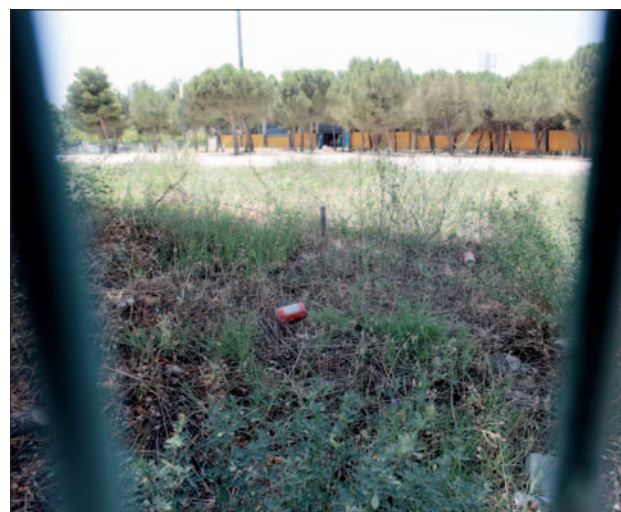
Malas hierbas y basura en el entorno del Polideportivo Juan de la Cierva.