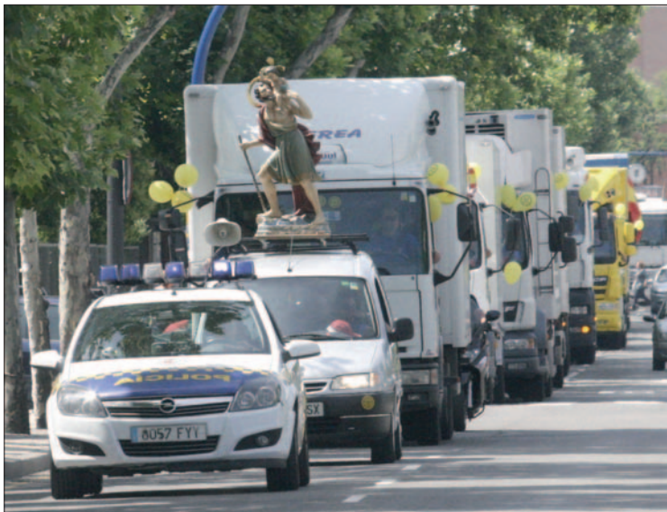
Procesión de camiones organizada por la ATG.

Un año más la Asociación de Transportistas de Getafe (ATG) celebró las fiestas en honor a su patrón, San Cristóbal. Durante dos días consecutivos el recinto ferial acogió las actividades del festejo. Uno de los principales eventos fue nuevamente el desfile de camiones por las calles de Getafe, que cumple tres años. Alrededor de setenta camiones participaron en esta procesión en homenaje a San Cristóbal. El recorrido por las calles de la ciudad, previsto para el sábado, 3 de julio, tuvo que ser aplazado al domingo, 4 de julio, debido al partido del Mundial de Sudáfrica entre España y Paraguay. La imagen de San Cristóbal encabezó la marcha que discurrió por la avenida de Aragón, Los Ángeles, Juan de la Cierva, calle Madrid y avenida de las Ciudades.