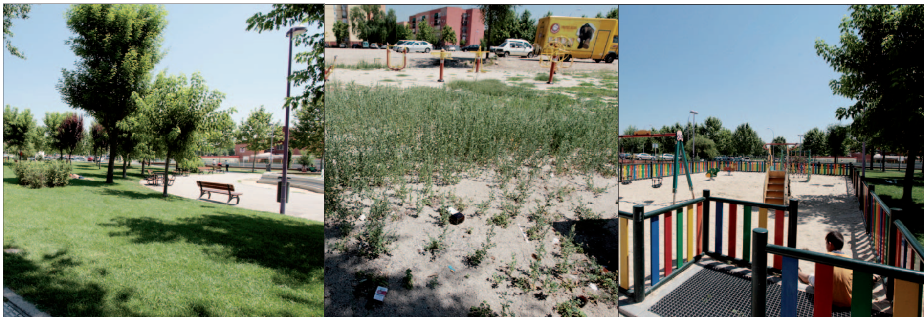
El verde del Parque de El Greco se combina con los desperdicios en el área biosaludable y el buen estado del área para niños.

Un recorrido por algunas de las zonas verdes de la ciudad