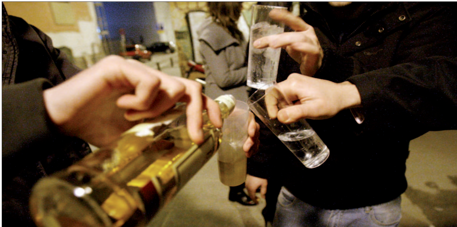
El botellón se ha convertido en el acto social de los jóvenes, que cada vez lo hacen a una edad cada vez más temprana.