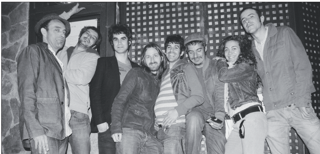
Watch Out actuará el 10 de julio en el Hospitalillo, en Cultura Inquieta.

Continúa el festival Cultura Inquieta de miércoles a domingo en el Conde Duque getafense