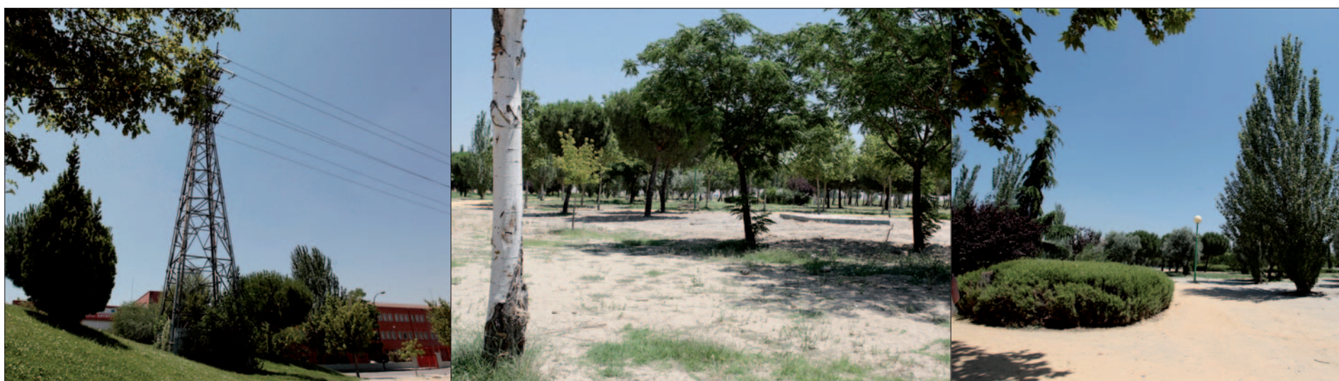
El Parque de Andalucía: una torre de alta tensión que cruza la zona y espacios donde no se puede transitar, junto con otros más cuidados.