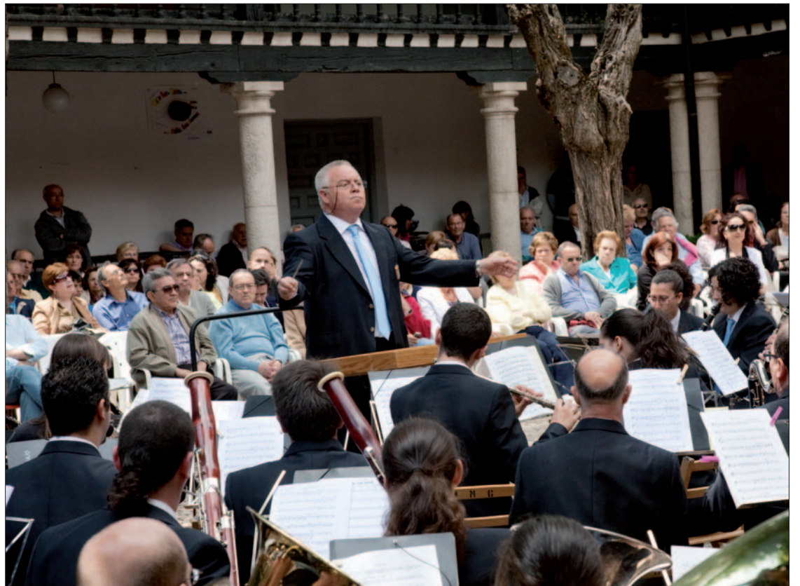
La Banda Municipal de Getafe en uno de sus actos