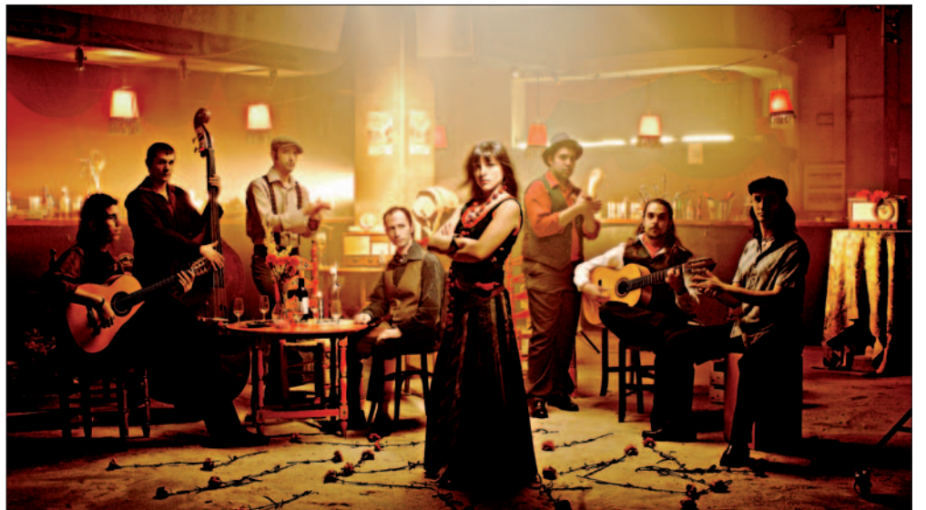
Los integrantes del grupo flamenco D'Callaos