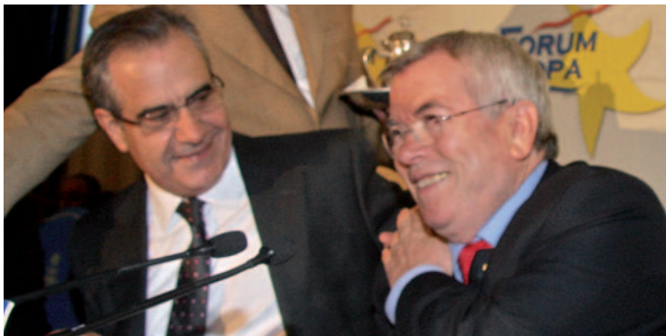
Corbacho y Castro en el Foro Nueva Economía.

El alcalde de Getafe y presidente de la FEMP, Pedro Castro, demandó una mayor participación y capacidad de gestión de los ayuntamientos españoles en el desayuno informativo organizado por Nueva Economía Fórum. Castro reivindicó la importancia de los gobiernos municipales a la hora del desarrollo de las políticas y actuaciones de todas las administraciones públicas, tanto nacionales como regionales, así como la necesidad de una mayor implicación de las entidades financieras para salir de la crisis.