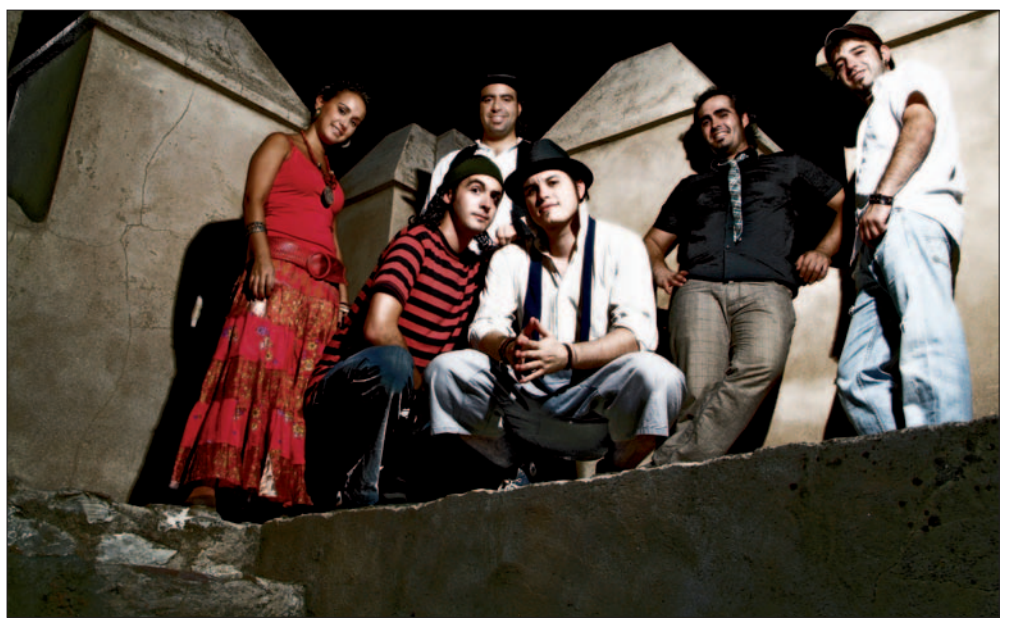
Los rumberos extremeños de El Desván del Duende.