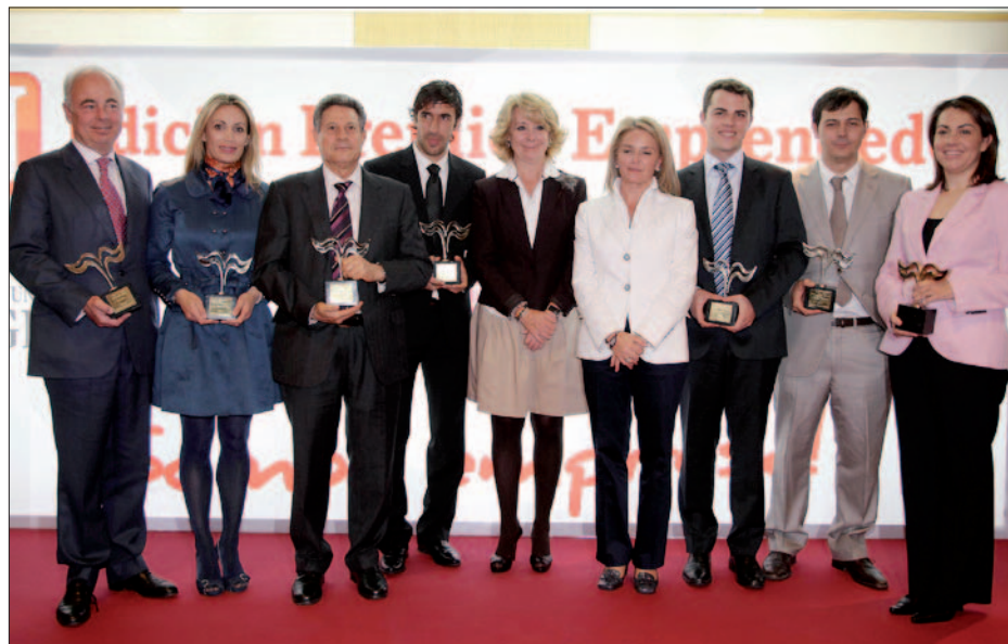
Foto de familia de los premiados.