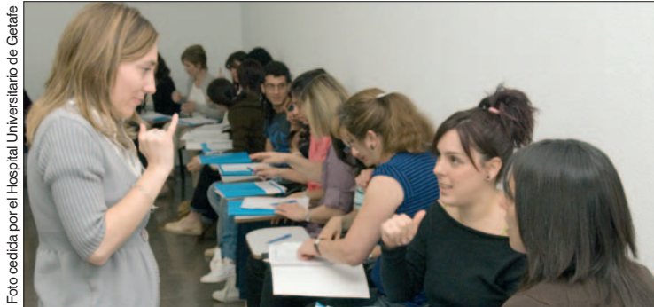
Una de las enfermeras impartiendo el curso.

El Hospital Universitario de Getafe ha llevado a cabo una iniciativa novedosa en la Comunidad de Madrid y es que un total de 36 profesionales sanitarios (especialmente enfermeras) han recibido un curso sobre lenguaje de signos para poder comunicarse de forma autónoma con pacientes que presenten deficiencias auditivas.