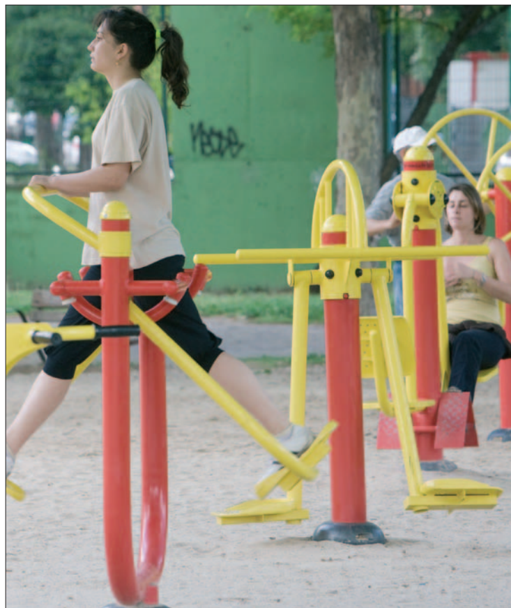
Gimnasio al aire libre en el parque de Castilla La Mancha.

dependencia”, los vecinos se tienen que mantener “activos” y al caminar o “utilizar estos gimnasios” consiguen esa meta. “Están dando muy buenos resultados”. Medina también informa de que se han creado grupos de senderismo y paseo dentro de los mayores y en su camino tienen programadas detenciones en estos parques.