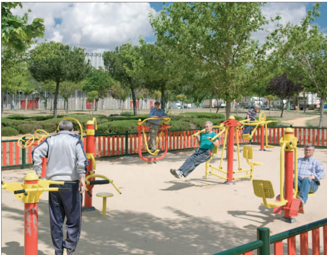
En el Parque de Andalucía, junto al recinto ferial, varias personas utilizan el área biosaludable.