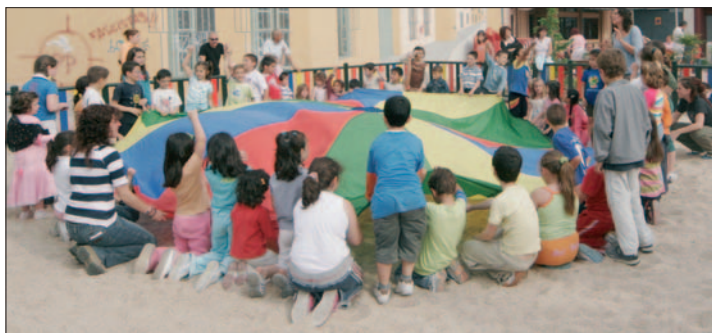
Una de las actividades infantiles de las fiestas del año 2008.

Llegan las primeras fiestas de barrio del año en Getafe: las de San Isidro. Del 14 al 17 de mayo: juegos tradicionales, conciertos. Para 2009 se ha cambiado la ubicación del recinto ferial, que se establece en la estación Getafe Centro. Solo por esta vez. Ahí será donde se celebren los conciertos, porque el resto de actividades continúan en sus lugares habituales. Y debido a esta mudanza provisional, en ese recinto ferial la compañía Destellos organizará un mercado medieval a partir del 15 de mayo. Teatro al aire libre, música, pirotecnia... todo un espectáculo callejero. La particularidad de estos festejos es que "son los propios vecinos los que organizan sus fiestas" y se las hacen a medida y también para que se acerque el resto de la ciudad. Son "días de convivencia, de acercamiento", cuenta Iván Rubio, presidente de la asociación Ankara que coordina la comisión. Todo comenzará el 14 de mayo por la mañana con una exhibición de talleres en el centro cívico del barrio y el Hospitalillo. Por la tarde, seguirá la muestra y en la plaza del Obispado se revivirán tiempos pasados con juegos de antaño como el chito, el aro o el cuela ruedas. Es una forma de conocer "cómo se divertían antes", y puede participar "cualquier persona". Los niños tendrán un castillo hinchable a partir de las 16.00 horas en la estación. Por la noche, concierto joven con grupos locales que proponen "diferentes estilos de música". El mismo día de San Isidro, el