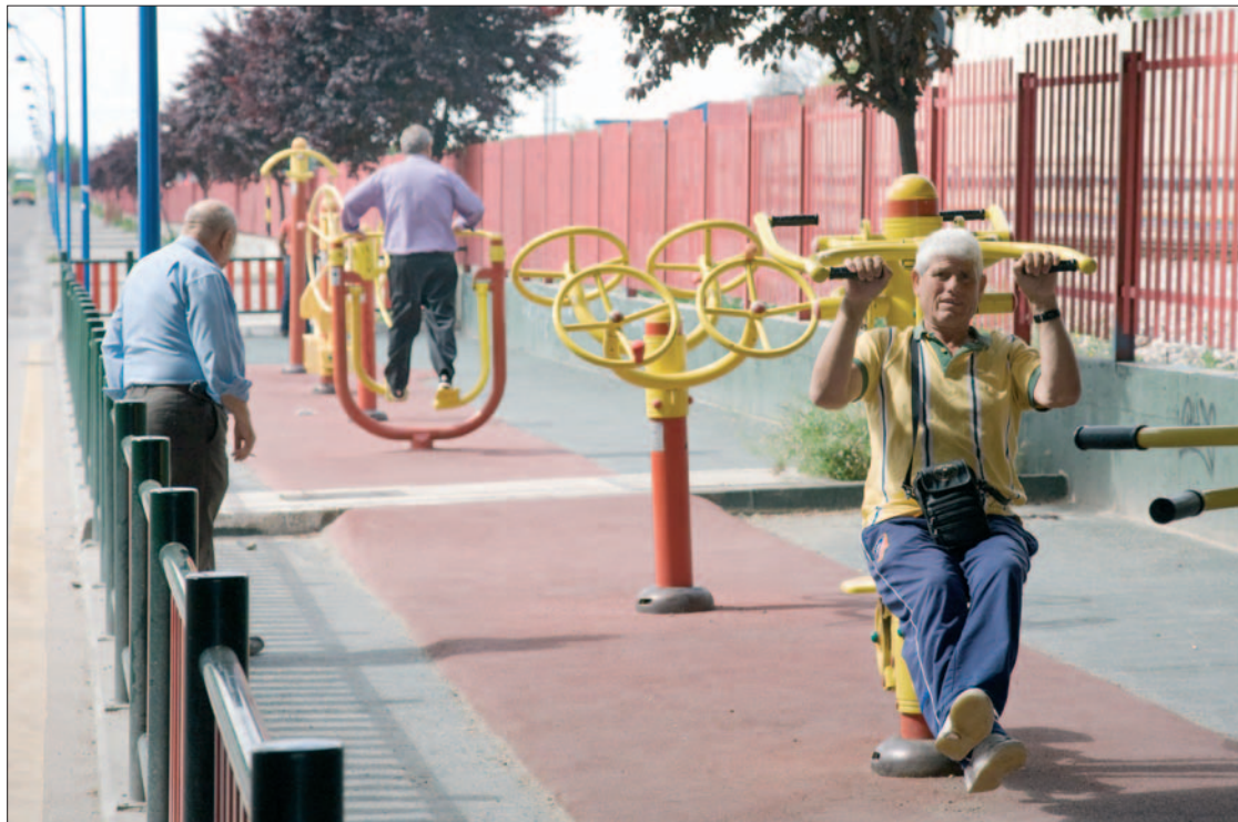
La carretera del Cementario es conocida como la ruta del colesterol, y hay una zona para adultos.