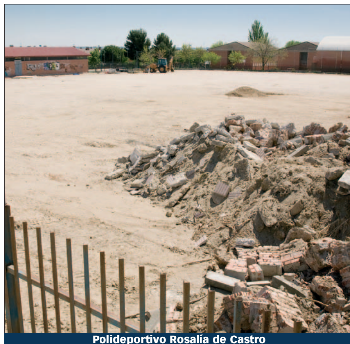
Polideportivo Rosalía de Castro

Un pellizco del fondo estatal le toca al Sector III para rehabilitar el polideportivo Rosalía de Castro. 30