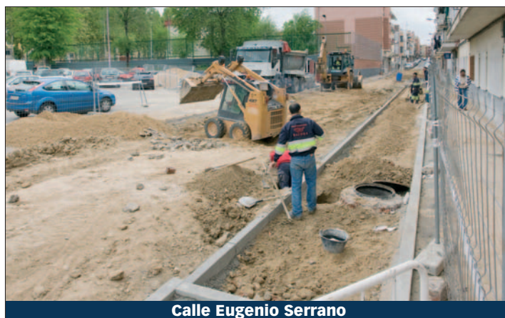
Calle Eugenio Serrano