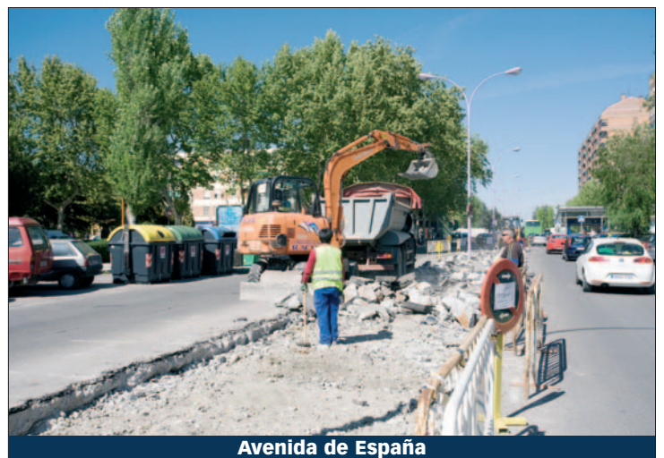
Avenida de España