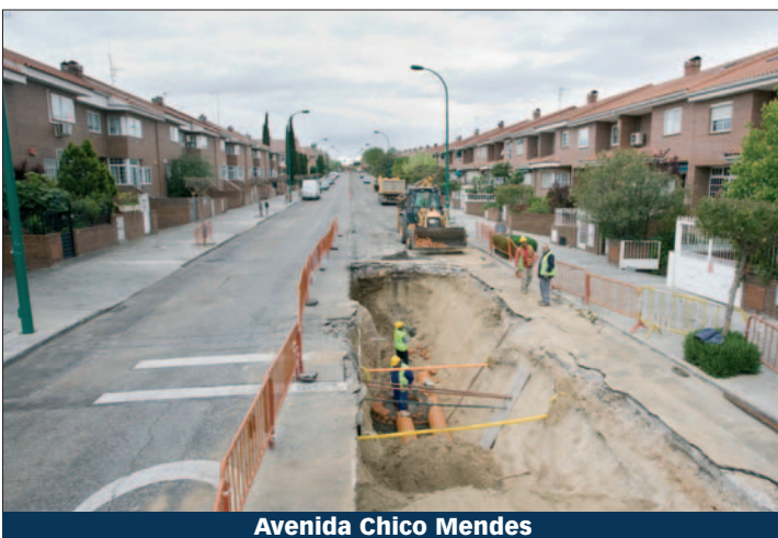
Avenida Chico Mendes

Dos de las vías principales de Perales del Río están en obras: la calle Groenlandia (donde está situado el Centro Comercial El Carmen) y la avenida Chico Mendes (dirección del centro cívico del barrio). En la primera, los trabajos consisten en la renovación de calzada y aceras, para lo que se está demoliendo el pavimento existente, y en la sustitución de la red de saneamiento y el alumbrado. Además, los vecinos verán solucionado uno de los problemas que colean desde hace tiempo, que es la inundación de