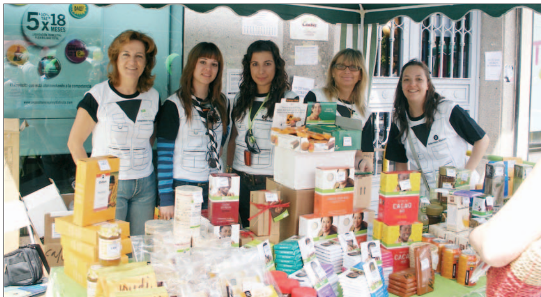
Mercadillo de comercio justo en la Fiesta de la Solidaridad 2008.

Dar a conocer su actividad y tratar de recaudar fondos, que este año van destinados a las mujeres que están en los campos de refugiados de todo el mundo. Ese es el objetivo de la Fiesta de la Solidaridad que Intermón Oxfam organiza para el 26 de abril bajo el epígrafe de Un día para la esperanza .