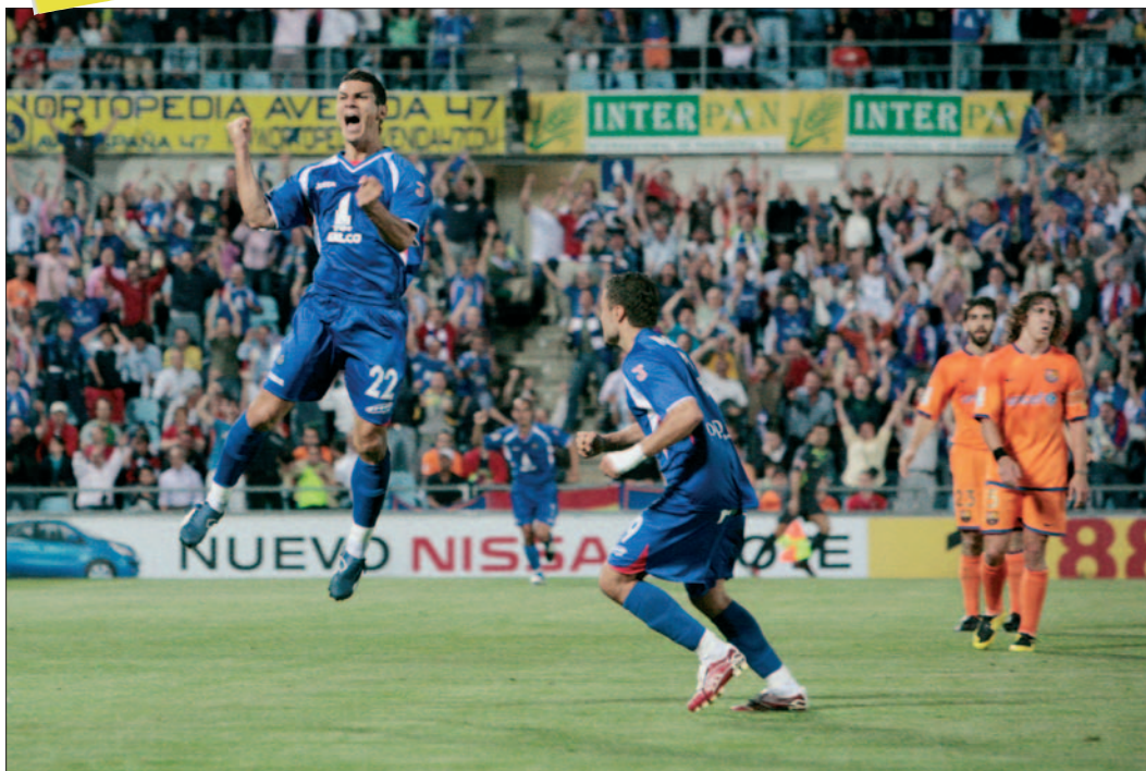
Imagen de la semifinal copera 2006/07 en el Coliseum, que enfrentó al Barça y al Getafe.

Las estadísticas blaugranas contra su bestia negra