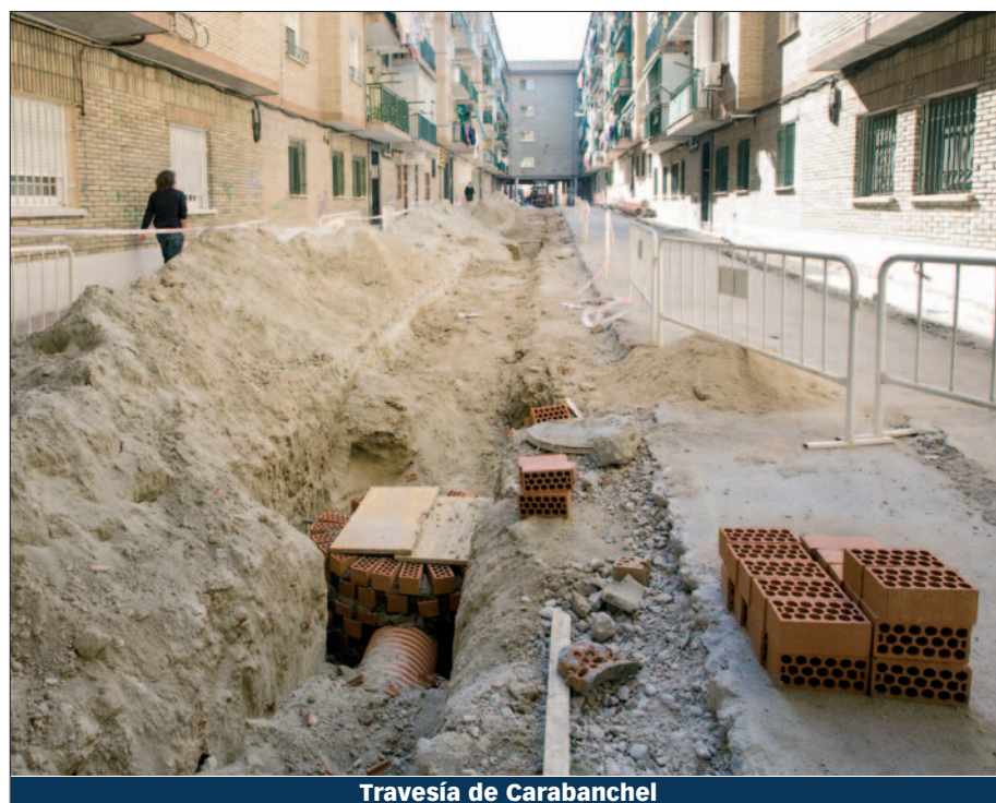
Travesía de Carabanchel