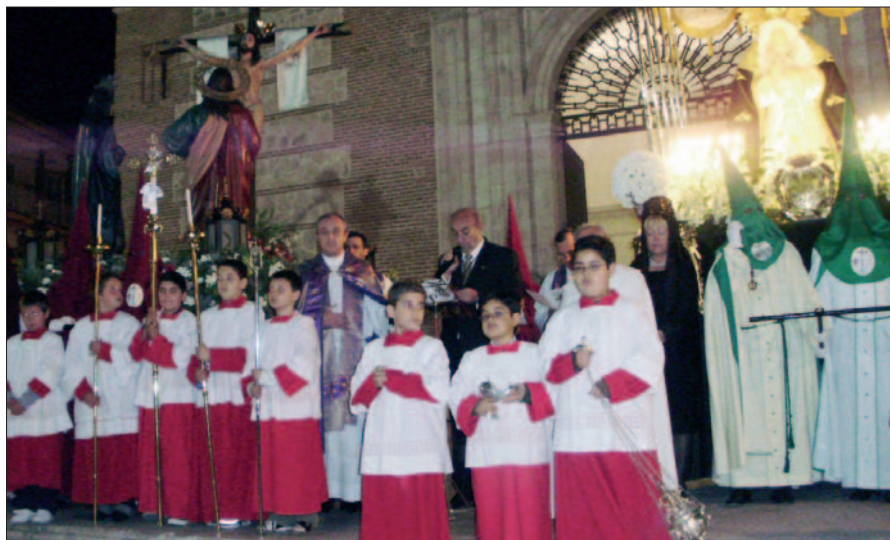
Pasó la Semana Santa. Los que se quedaron en la ciudad, quizá vieron imágenes como la que acompaña estas líneas. Recoge un momento previo a la procesión del Miércoles Santo, día en el que también la Hermandad del Patriarca de San José recorrió las calles. Antes, como recoge el objetivo, se leyó un manifiesto "en defensa de la vida". Además, la Cruz que encabezaba las procesiones llevaba un lazo blanco contra el aborto.