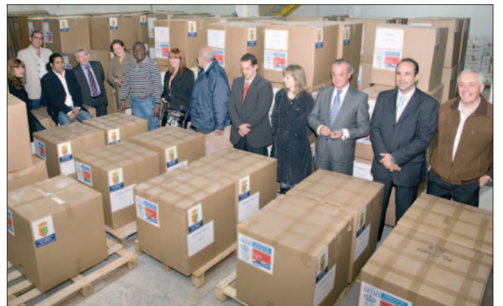
En el antiguo almacén municipal, el Ayuntamiento presentó la relación de lo recaudado en la campaña Todos con Cuba.