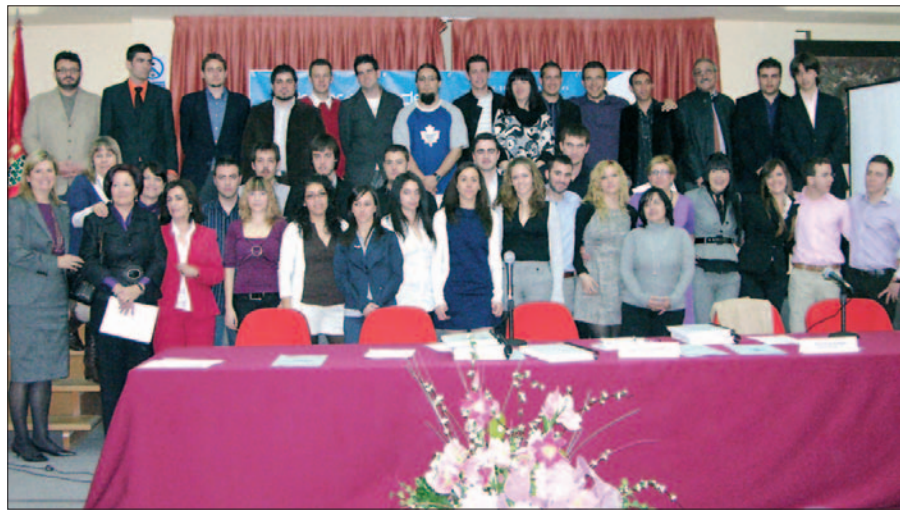
Los alumnos de Inglan que presentaron sus trabajos en el Centro de la Mujer.

U na tienda de productos de segunda mano, otra de artículos de bebé, una clínica veterinaria, una farmacia, una fábrica de automóviles o un centro de estética. Estos seis proyectos han sido presentados por 33 alumnos del Centro de Formación Profesional Inglan, como parte de un programa llamado de Fomento del Espíritu Emprendedor promovido por GISA, la agencia de desarrollo local.