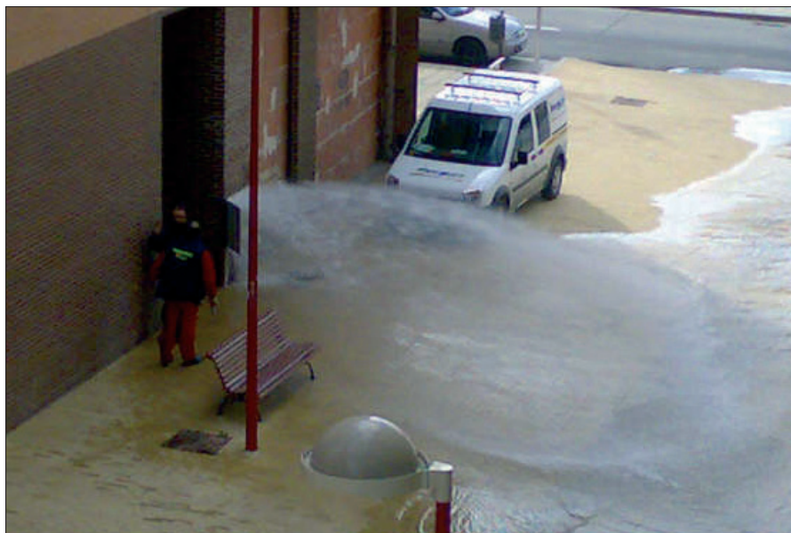
No son las Cataratas del Niágara. Es El Bercial. Concretamente el inmueble sito en la calle Manuel Vázquez Montalbán, 2. La rotura de la tubería general del edificio provocó que el agua brotara a borbotones anegando los bajos propios y los del edificio colindante. Por unos instantes, los vecinos pensaron que sus pisos se vendrían abajo al ver salir tanta agua. Todo quedó en un susto. La empresa de mantenimiento de la finca y los operarios del Canal de Isabel II arreglaron el desaguisado. Era la tercera vez que acudían a reparar la misma avería en un plazo de dos semanas.