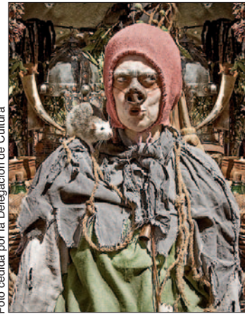
Uno de los personajes de El carro de los matasanos.

Del 12 al 15 de marzo Getafe se sumergirá en el Siglo de Oro. Los alrededores del García Lorca son los espacios elegidos para albergar el Mercado barroco, donde no faltarán los artesanos, la gastronomía, la música de cámara, los juegos de ingenio, títeres, teatro de calle... y sobre todo, mucha participación. Pegasus será la encargada de la organización del evento, que contará con cerca de un centenar de paradas, "todas ellas decoradas", dicen desde la empresa. De cerámica, plata, velas, vidrio, chocolote, cuero, cinturones... de todo se podrá encontrar en los diversos puestos, muchos de ellos regentados por los artesanos que elaborarán in situ los productos. Una ocasión única para ver de primera mano el trabajo artesanal. También los comerciantes vestirán ropajes de la época. Es algo que "tiene muy buena acogida entre el público. Se involucra en las actividades". El mercado cuenta con zonas diferenciadas. A la antes citada de los artesanos —frente a la estación— se suma el espacio destinado a la gastronomía, donde se podrán degustar productos llegados de distintas partes del país; sin olvidar las tabernas de la época, "con los mejores caldos y guisos", reza el programa. Junto al García Lorca estará ubicada la plaza del teatro donde se sitúa el escenario central del mercado. Este acogerá las representaciones de obras y música clásica, especialmente en horario nocturno. Y detrás del teatro, la plaza de los niños, con talleres y juegos in-