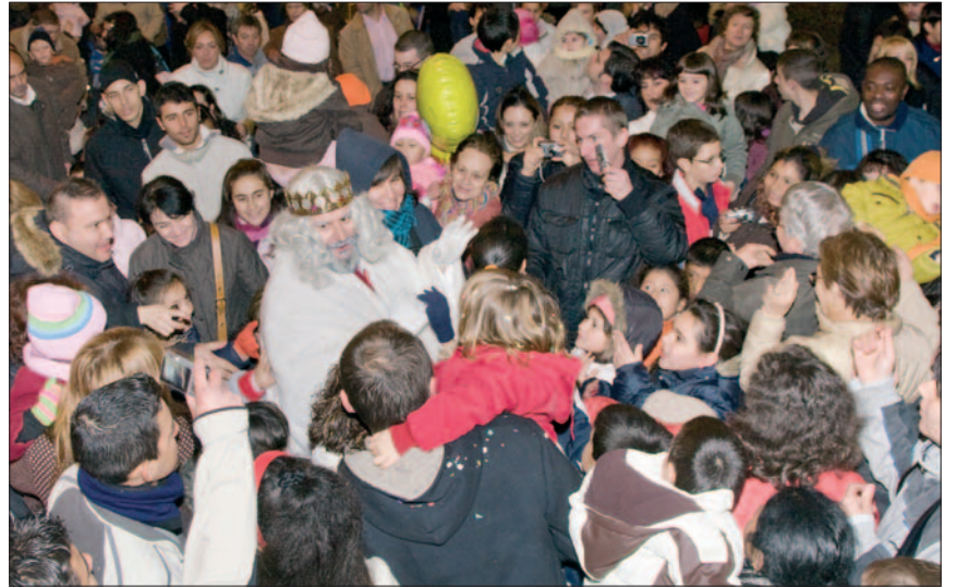
Algunas imágenes que dejó la Gran Cabalgata con los Reyes Magos a camello en su recorrido por el centro de la ciudad en la noche más mágica del año.