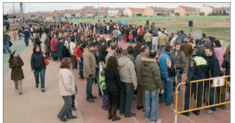
Cola para ver a los Reyes Magos en Juan de la Cierva.