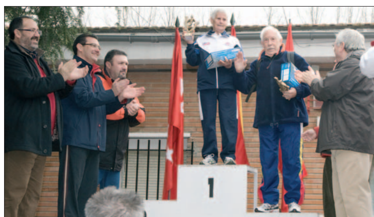
Los primeros veteranos en llegar a la meta el 31 de diciembre.