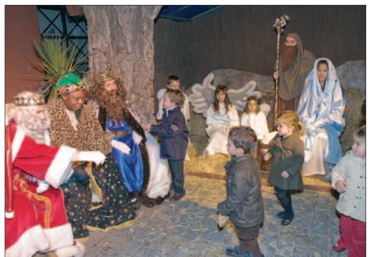
Los Reyes Magos en el belén viviente de la Casa de Extremadura.