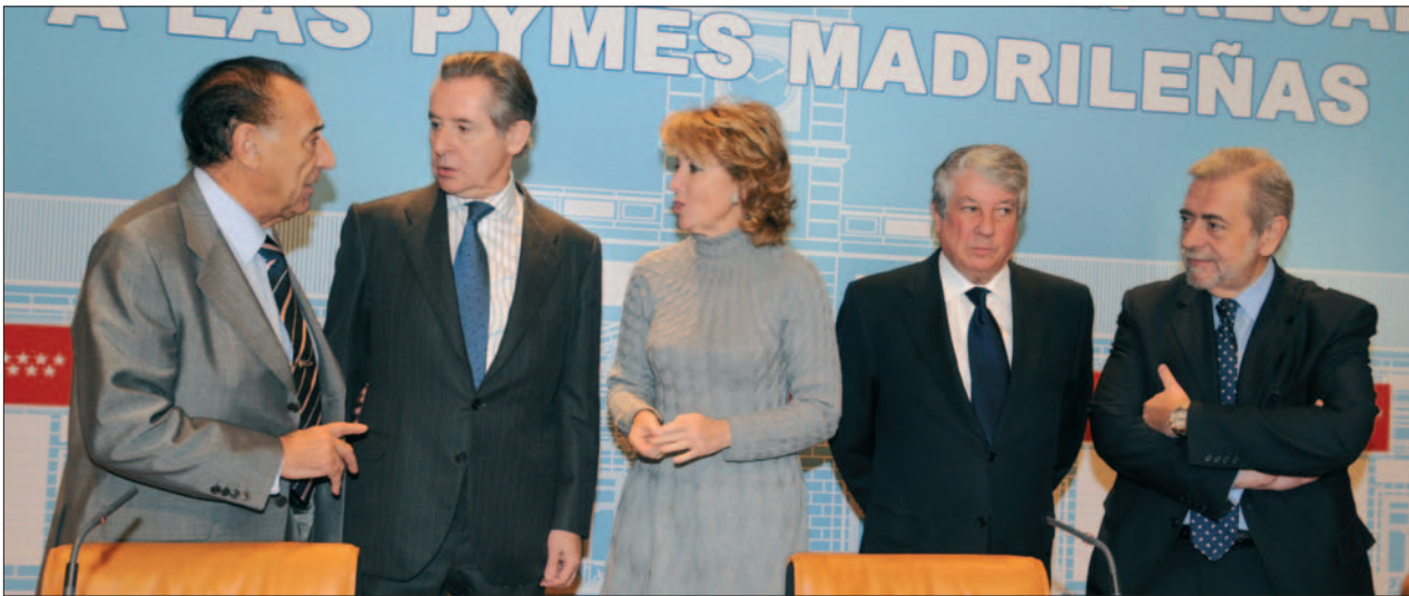
La presidenta de la Comunidad de Madrid, Esperanza Aguirre, presidió la firma del acuerdo.

C aja Madrid, CEIM Confederación Empresarial de Madrid-CEOE y la Cámara de Comercio e Industria de Madrid han firmado un acuerdo para lanzar un programa de apoyo a las pymes madrileñas al que se destinarán 2.250 millones de euros para favorecer la financiación de las empresas y apoyar sus proyectos de inversión.