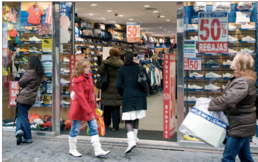
Un comercio de la calle Madrid ya anuncia sus rebajas.