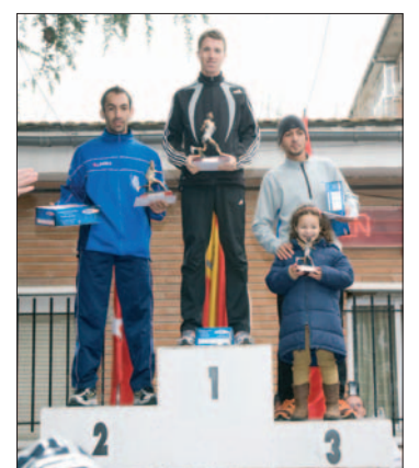
Ganadores de la San Silvestre.