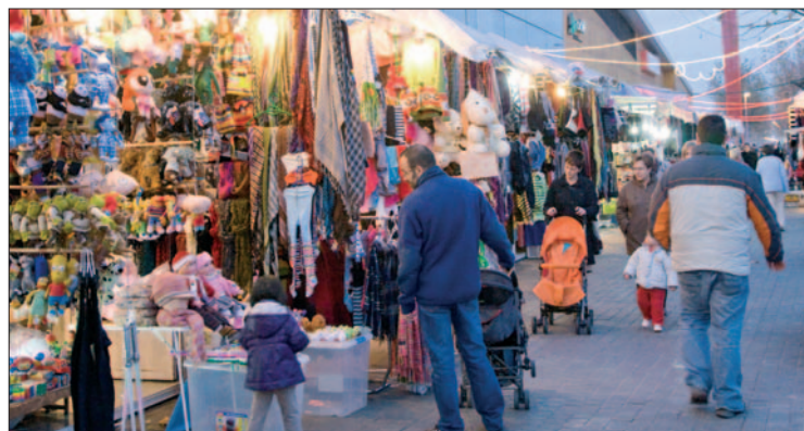
Mercadillo instalado en la estación de Cercanías Getafe Centro.