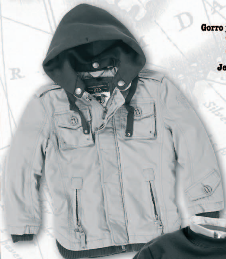
Chaquetón de niño con capucha de felpa desmontable, 44€