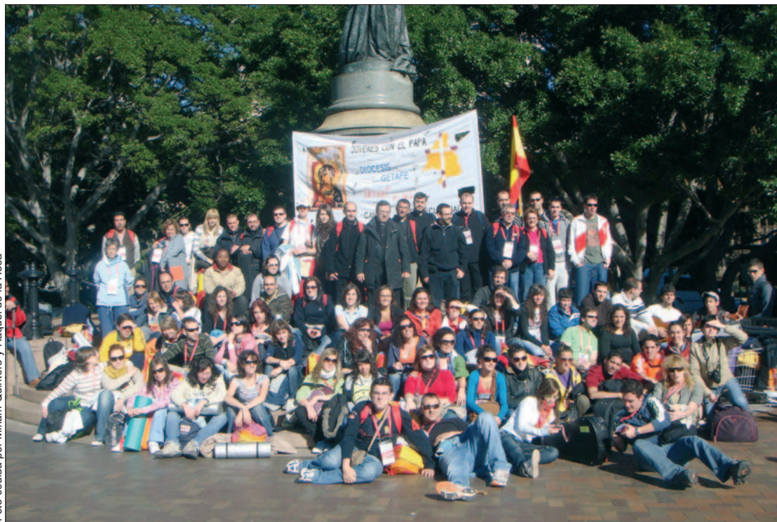
El grupo de la Diócesis de Getafe en el entorno de la Catedral de Sídney.

Para estas dos getafenses, Sídney ha significado acudir por primera vez a una jornada así. Los motivos que les llevaron, “muchos”. Por una parte querían conocer el país, y también porque “este tipo de encuentros son