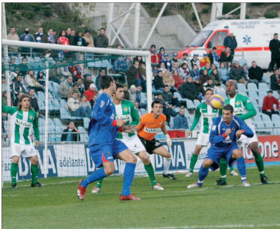
Getafe-Betis en el partido del Coliseum de la temporada 2007/08.