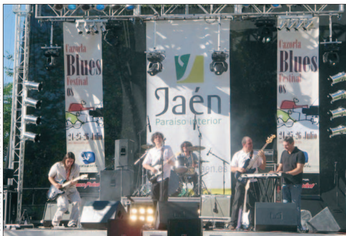
The Fritos Blues Connection, en el Festival de Cazorla.

2003 "y el tercero acabamos de terminarlo y lo presentaremos en Getafe".