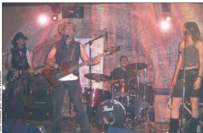
El grupo Sheriff Wallace lleva una década sobre el escenario.

Su memoria discográfica se materializa en tres discos. El primero se grabó en 1997, el segundo en