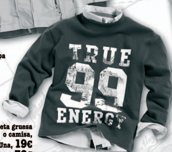
Camiseta gruesa o camisa, Una, 19€ Dos, 30€