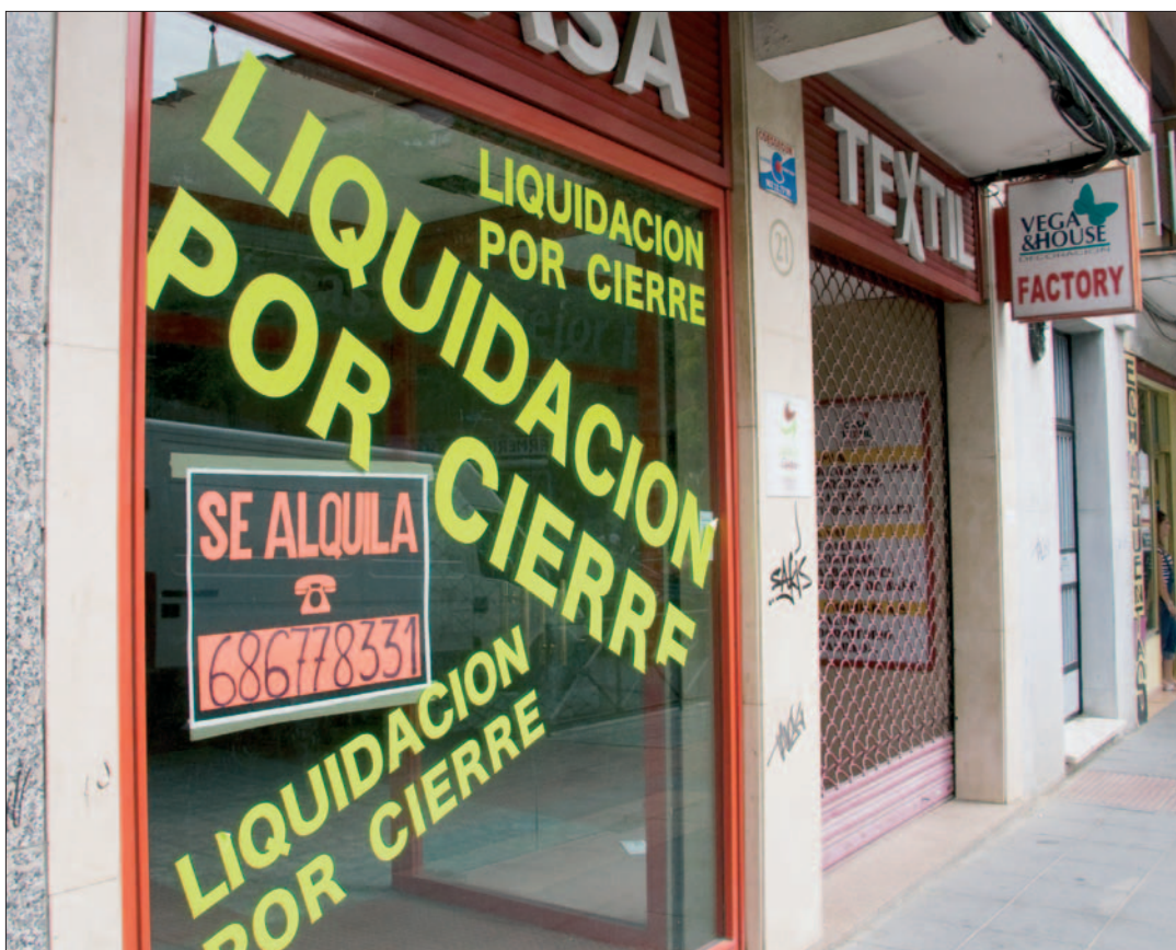
Algunos escaparates de la localidad lucen luminosos como este: "Liquidación por cierre".