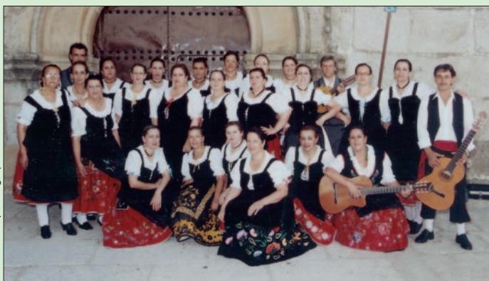
El grupo de danzas Nuestra Señora del Rosario de Alcuéscar.