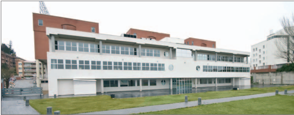
Las tres escuelas se integran en un nuevo edificio de 3.600 m 2 contiguo al actual Instituto de Formación Empresarial (IFE) de la Cámara de Madrid

La Cámara de Comercio de Madrid estrena este curso las Escuelas de Comercio, Diseño Industrial y Hostelería. Las tres escuelas, que fueron inauguradas por Esperanza Aguirre el pasado mes de julio, se integran en un nuevo edificio de 3.600 m 2 contiguo al actual Instituto de Formación Empresarial (IFE) de la Cámara de Madrid, situado en el número 11 de la calle de Pedro Salinas, en la intersección de López de Hoyos con Arturo Soria.