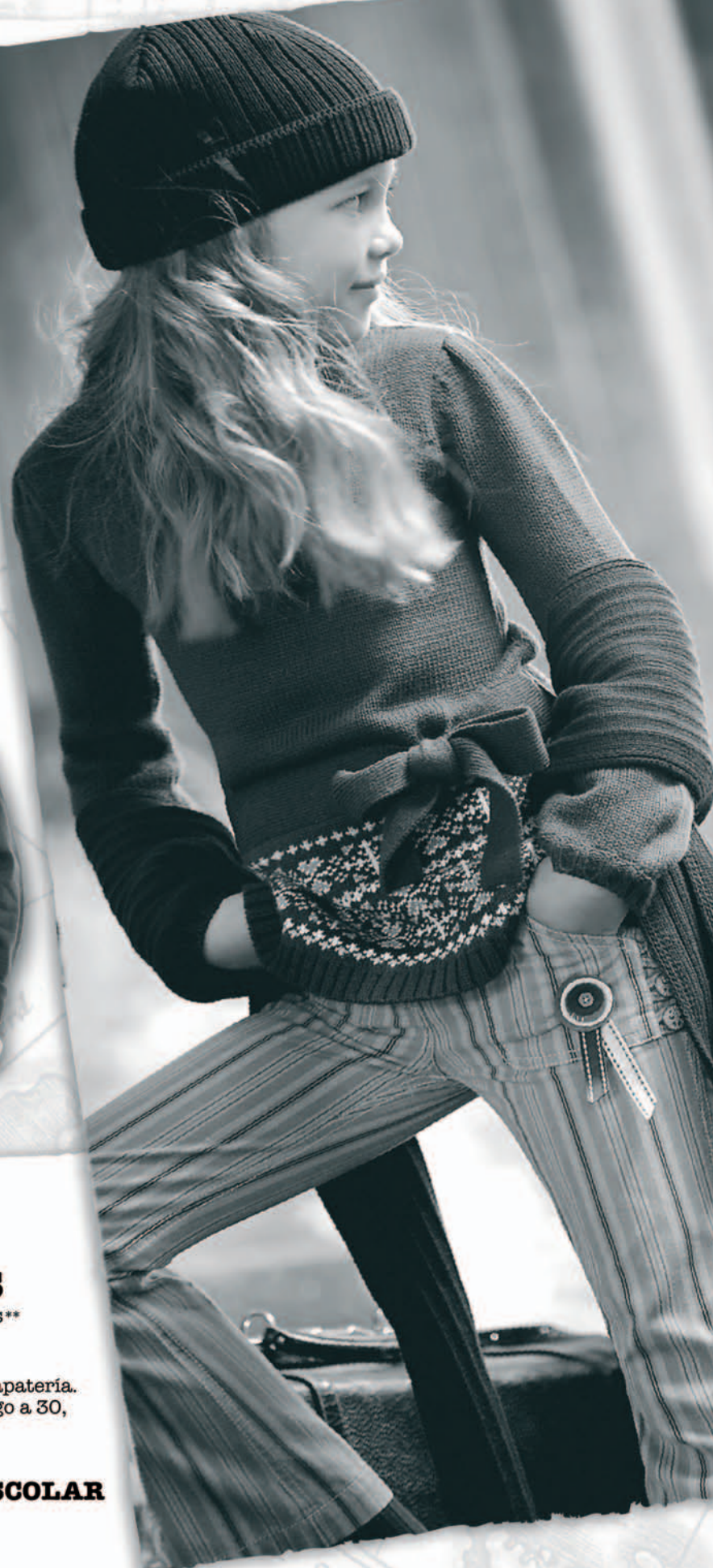
Pantalón de rayas, 21€