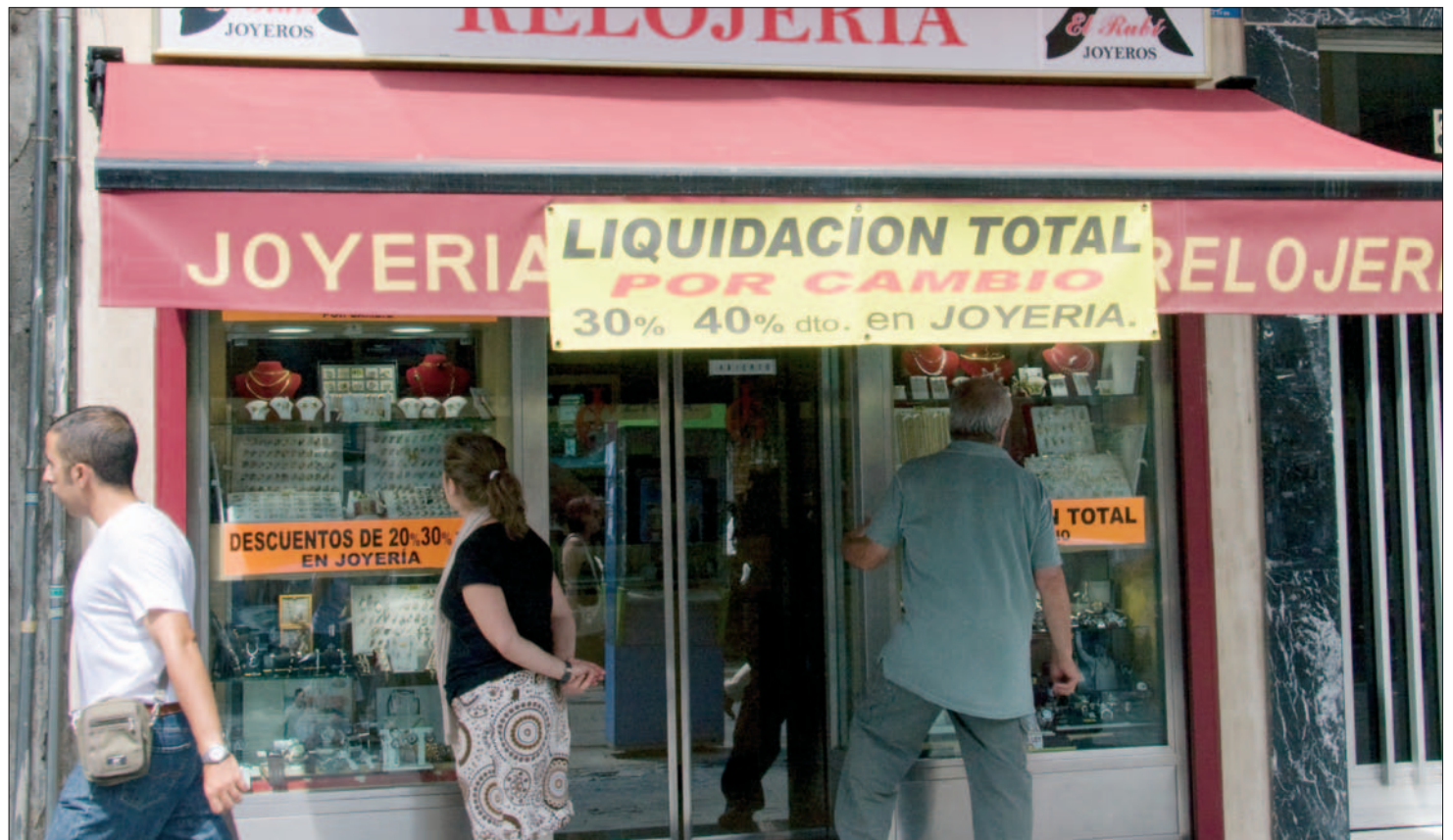
Un establecimiento del municipio anuncia su "liquidación total por cambio".