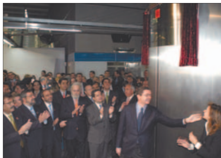
El protocolo de la inauguración oficial incluyó descubrir una placa, con el acompañamiento de los aplausos de rigor de los asistentes.