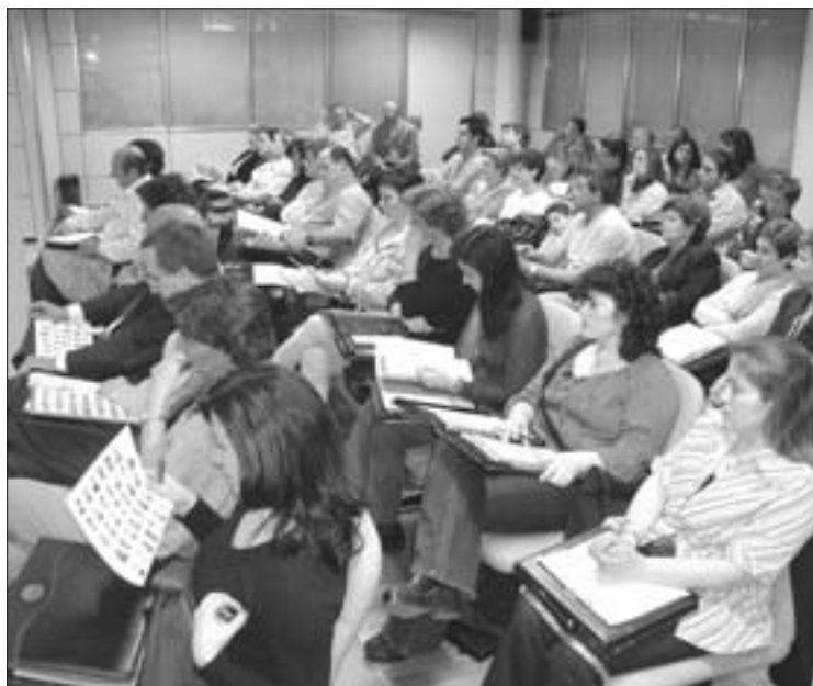
El salón de plenos del Consistorio fue ocupado por profesionales y miembros de colectivos educativos que presenciaron la constitución del nuevo Consejo Municipal de Educación.

Con un aumento de representantes de Educación Infantil, CEIP e IES, instituciones educativas y otros colectivos, que elevan su participación en la Asamblea a sesenta y cinco, se constituyó el nuevo Consejo Municipal de Educación, instrumento de participación ciudadana en la gestión educativa del municipio. Entre los consejeros que integran la citada Asamblea o Plenario, se encuentran miembros del Conservatorio, Universidad Carlos III, UNED, Área Territorial Madrid Sur, Centro de Apoyo a Profesores, Federación de Asociaciones de Padres o APANID entre otros. E.S.