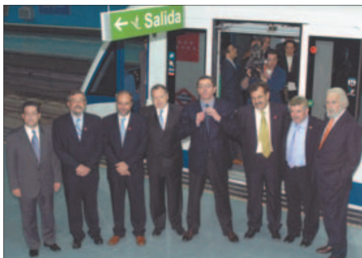
Los políticos que acapararon protagonismo: los "alcaldes afectados", el presidente Ruiz Gallardón y el consejero Cortés.

Los primeros días de funcionamiento, sin embargo, estuvieron protagonizados por numerosas incidencias de carácter menor (ascensores que no funcionan, paneles sin información, paradas y retrasos de los trenes por averías, líos con las máquinas expendedoras de billetes y con las tijeras de entrada y salida...), seguramente como consecuencia de las tradicionales prisas de última hora para conseguir que todo estuviera listo en la fecha prevista para la fotografía de rigor. S.Y.