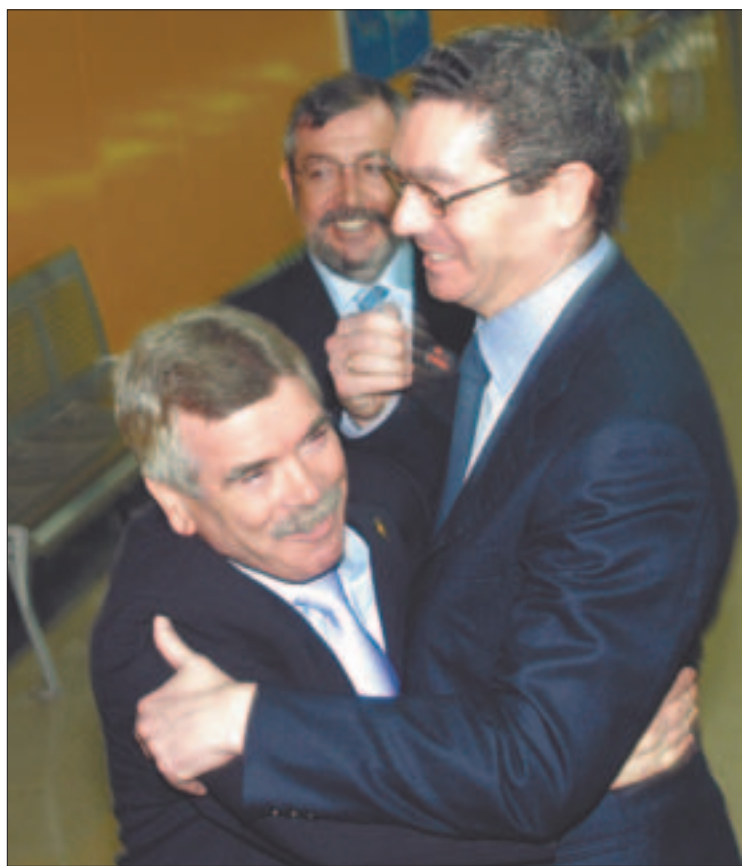
En la foto superior, el momento del efusivo abrazo entre Pedro Castro y Alberto Ruiz Gallardón; en la imagen de la derecha, una panorámica del numeroso grupo de representantes de los medios de comunicación que asistió a la inauguración oficial.