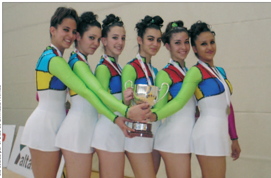
Cadetes del Club de Gimnasia Rítmica con el trofeo de la Comunidad de Madrid.

Para ello hay que entrenar duro, “es un deporte que requiere mucho esfuerzo y repeticiones”, y aunque llegue el verano “no descansarán mucho. Si queremos seguir compitiendo, no se puede parar a una gimnasta”. Aunque hasta febrero o marzo no empiecen a competir, “se respeta una constancia en los entrenamientos”.