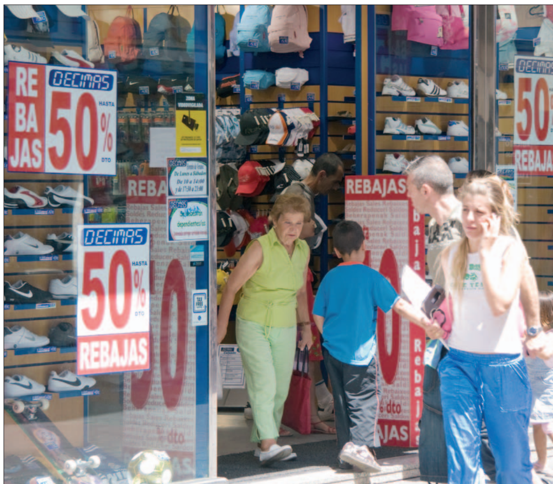
Uno de los establecimientos de la calle Madrid durante las rebajas.

Las rebajas han comenzado, pero los consumidores no se rascan el bolsillo todo lo que los comerciantes desean. Desde el pasado 21 de junio y hasta el 21 de septiembre, los carteles de "Todo al 50%" invitarán a los madrileños a abrir sus monederos y adquirir alguna ganga. Desde la Confederación de Consumidores y Usuarios (CECU) animan a comprar con "inteligencia, racionalidad y criterio". Entre tanto, los