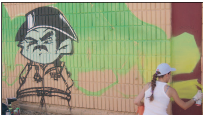
Grafitis en otras fiestas de Perales del Río.