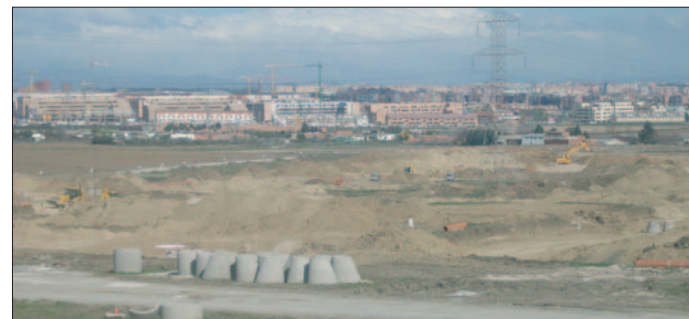
Vista panorámica del futuro barrio de Cerro Buenavista.

La Empresa Municipal del Suelo y la Vivienda (EMSV) ha comenzado a realizar los estudios geotécnicos y topográficos en las 1.567 viviendas que promueve en Los Molinos y Buenavista. Dos parcelas situadas en el barrio Cerro Buenavista han sido el primer emplazamiento elegido para el inicio de los trabajos. Durante las próximas semanas se completarán las labores del mapa de viviendas en el futuro vecindario,