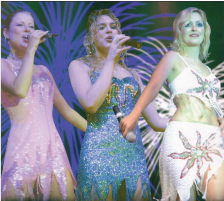
La orquesta Escala Royal amenizará la noche del 12 de julio.

ficiales —que tendrán lugar a la una de la mañana— serán dos de los momentos más esperados.