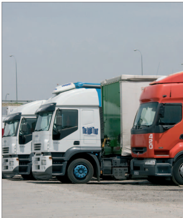
Una hilera de camiones circulará por el municipio en procesión.