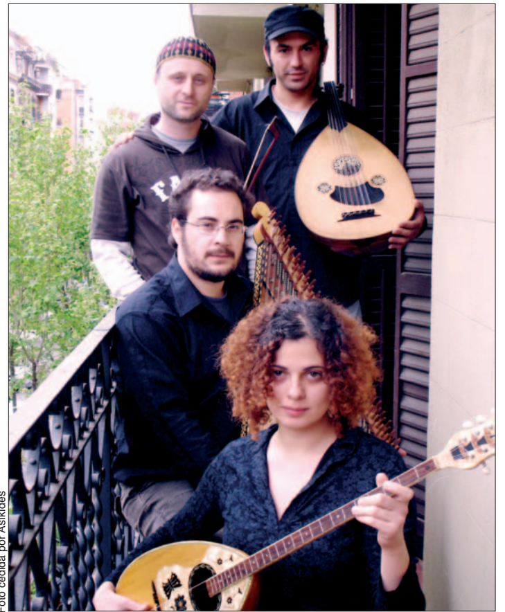
El grupo Asíkidés actuará el jueves, 17 de julio, en el Hospitalillo.

De Oriente Medio a Brasil Apenas han cumplido un año pero ya disponen de un amplio repertorio que les ha llevado a mostrar su identidad por numerosos lugares. The Baghdad Ensemble es un conjunto de cinco artistas de Oriente Medio que aúnan una serie de instrumentos especializados en músicas árabes. Bajo la premisa de "fomentar el respeto y el diálogo interculturales y promover el inte-