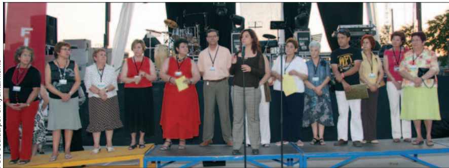
Celebración de la Fiesta del Voluntariado en el polideportivo Giner de los Ríos.

La cifra que ofrece el Ayuntamiento es la de más de 1.300 personas. Todos, voluntarios de la localidad. Fueron los que acudieron recientemente a la decimo séptima fiesta que para ellos organiza el Consistorio. El entorno elegido, el polideportivo Giner de los Ríos. Autoridades municipales y miembros de la Plataforma del Voluntariado de Getafe tomaron la palabra sobre el escenario, aquel que después ocupó una orquesta para continuar con la velada hasta pasada la una y media de la madrugada. Esta reunión servía para despedir