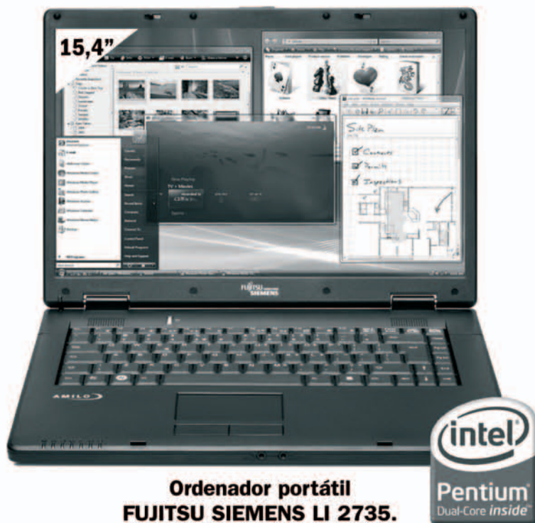
Ordenador portátil FUJITSU SIEMENS LI 2735.

Novedades de Verano a precios fantásticos