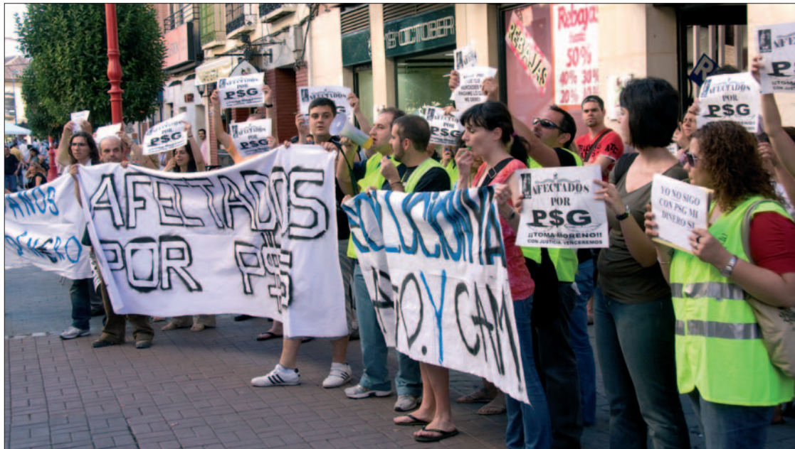
Miembros de la Asociación de Afectados de PSG durante la concentración.