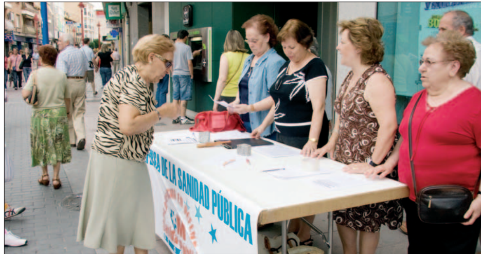
Mesa de recogida de firmas puesta en marcha por la plataforma.