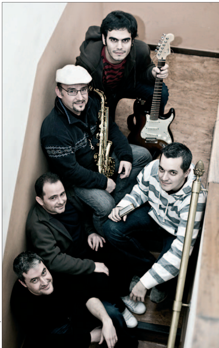
La banda de blues Killing Jazz.

Tras tres años rodando por diferentes escenarios, “principalmente en Madrid”, los componentes de Killing Jazz lo tienen claro: “Lo nuestro es el blues desconocido”. Por eso han tomado temas ajenos y los han hecho suyos “dándoles un toque más actual y eléctrico”. Sus directos destierran la idea de que ir a un concierto de este tipo es sinónimo de aburrimiento, “por eso de que todos los temas suenan igual. Somos fundamentalmente una banda de blues en la que hemos intentado encontrar una fusión con el swing y el jazz, apo-