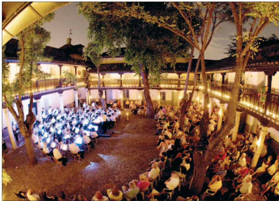
El Hospitalillo de San José se vistió de gala para la celebración del Concierto de la Luz, a cargo de la Banda Municipal de Música. La iniciativa, que tiene lugar por tercer año consecutivo, viene enmarcada dentro de las celebraciones de la noche de San Juan. El recinto apagó las luces para la ocasión iluminando el recital únicamente con antorchas.