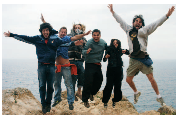
El grupo multirracial, La Rumbé.

La multirracialidad es una de las señas de identidad del mundo de hoy y también de La Rumbé. “Vamos a Getafe con un guitarrista brasileño, dos colombianos al saxo y el bajo, un argentino...”. Una mezcla explosiva por la que el fun-