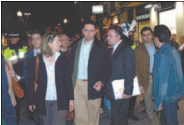
Tras el pleno extraordinario, los concejales del PP fueron insultados por algunos de los que protestaban contra la guerra.