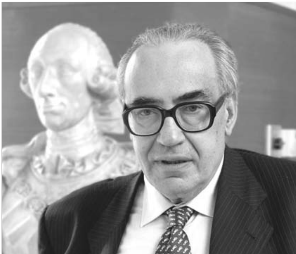
El rector de la Universidad Carlos III no cree que esta institución educativa esté poco volcada hacia el pueblo de Getafe, sino que lo hace de acuerdo con sus características y posibilidades.