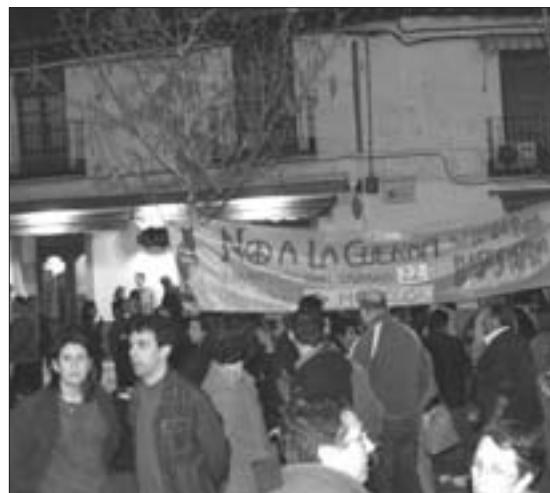
Tras un pleno extraordinario, cientos de vecinos continuaron con las protestas contra la guerra.