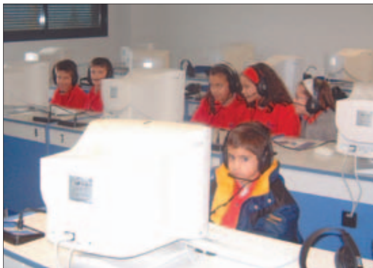
Las aulas de informática y multimedia facilitan la familiarización de los estudiantes con las más modernas y nuevas tecnologías.