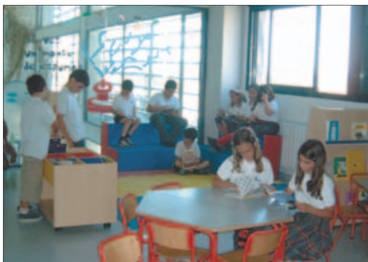
La biblioteca dispone de una zona habilitada especialmente para los alumnos más pequeños con 25 puestos de lectura.