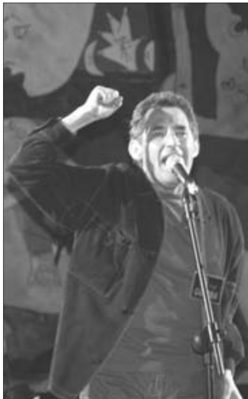
Miguel Ríos fue uno de los artistas que se desplazó hasta Getafe para protestar.