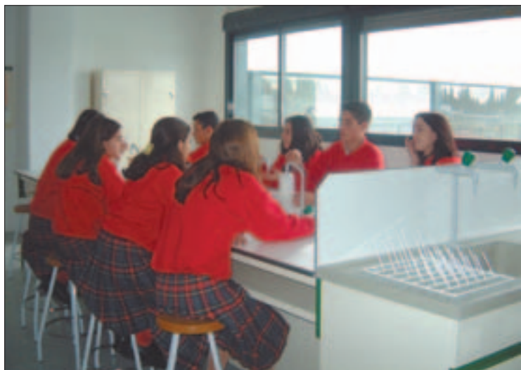
El laboratorio de química, junto a los de física o ciencias, permiten llevar a la práctica las enseñanzas y contenidos teóricos.