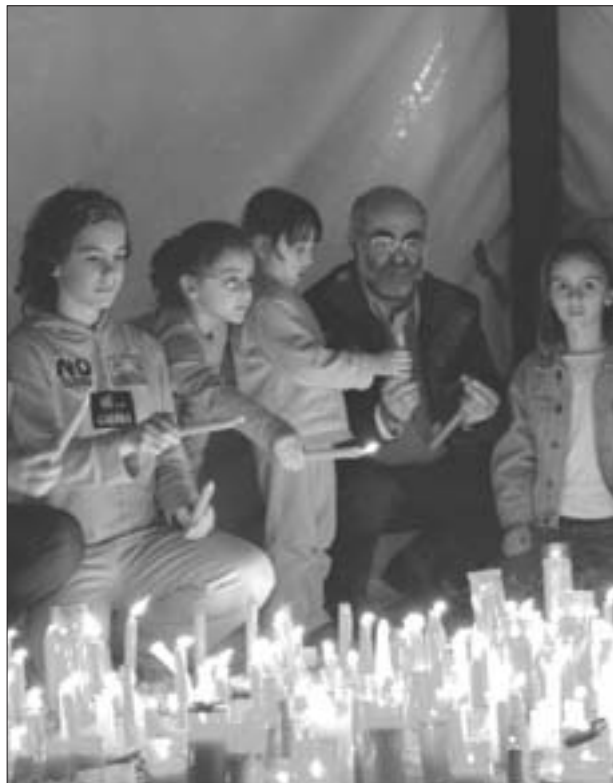
El lema "10.000 velas, 10.000 dibujos por la paz", fue una esperanza fallida con el inicio de la guerra.