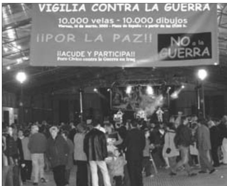
Música, solidaridad y paz caminaron juntos en un acto organizado por el Foro Cívico de Getafe en demanda de paz.