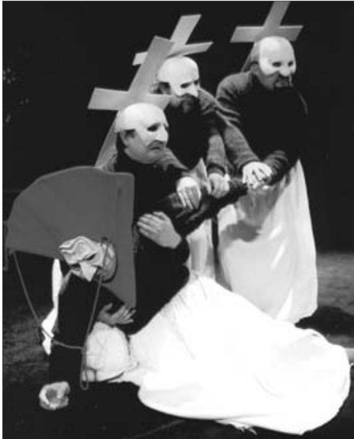
Abdicar de sus ideales o morir es el dilema al que se enfrenta el protagonista de “Galileo” en la obra homónima de Brecht.

“La mayor sabiduría que existe es conocerse a uno mismo”, afirmó Galileo, pero Brecht apostaba por algo más: un mundo socialmente igualitario. “Estamos hablando de un conflicto en el que se unen factores que son de completa vigencia: ahí tenemos lo que ha ocurrido con el Prestige y la reacción ciudadana con Nunca Más , o la cuestión armamentística, donde gran parte de lo que es la guerra se basa en los inventos utilizados por la humanidad para esta causa”,