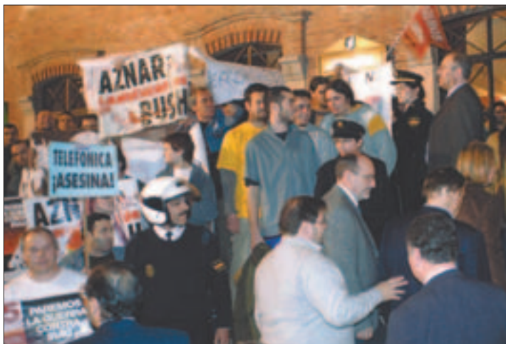
La entrada del Teatro García Lorca fue tomada por los manifestantes en un acto electoral al que finalmente no asistió Rato.