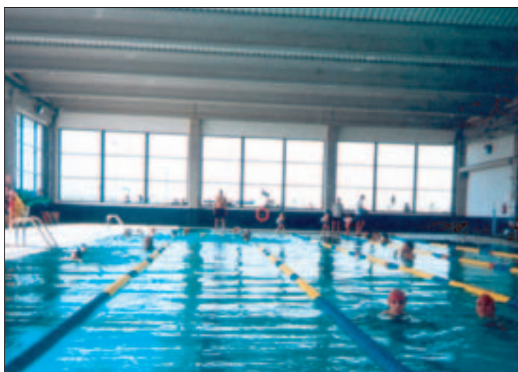
En la faceta deportiva, se potencia especialmente la natación; practicada en dos piscinas, una semiolímpica y otra para bebés.

de la comida (elaborada en el mismo centro y con menús especiales), son los tutores los que almuerzan con sus alumnos en los dos comedores existentes, (uno para los niños de 0 a 6 años y otro para los de a partir de 6) y educan a los más pequeños en los correctos hábitos alimenticios.