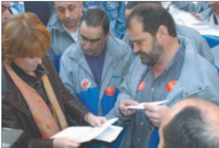
La candidata popular a la Comunidad de Madrid, Esperanza Aguirre, lee las peticiones de los trabajadores de Sintel.