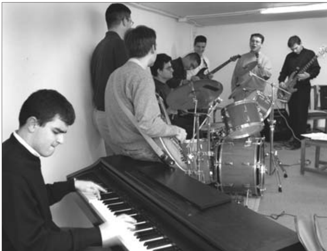
Unidos por su vocación religiosa y por su pasión musical, los seminaristas de La Otra Mejilla evangelizan interpretando las canciones incluidas en su disco titulado Dios dirá .

Definen su estilo como pop rock, y afirman que sólo las letras y el fin con el que tocan, les hace distintos de cualquier otra formación. Ellos son La Otra Mejilla, un grupo formado por diez seminaristas de la diócesis de Getafe (con edades comprendidas entre 18 y 32 años), que dando un giro a las prácticas evangelizadoras del cristianismo, han sacado a la luz su primer trabajo titulado Dios dirá , con el que pretenden hacer más accesible y cercana la palabra divina.