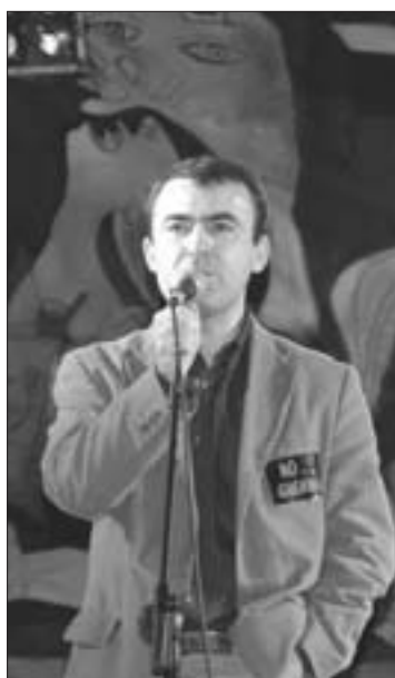
El escritor Lorenzo Silva fue una de las "voces por la paz".