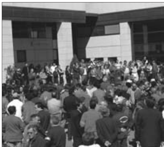
En la mañana posterior al ataque a Irak, se celebró una concentración frente al Ayuntamiento.

nes en su acampada nocturna amenizada con la actuación de una formación local. El comienzo de la guerra, no fue óbice para que continuaran las movilizaciones, que se tradujeron el día siguiente en sendas concentraciones en la plaza del Ayuntamiento, a las 12:00 y a las 20:00 horas. En la matinal, funcionarios y ciudadanos siguieron el llamamiento del Foro Cívico a todos los Ayuntamientos, mientras que la de la tarde, sucedió a un pleno extraordinario cargado de polémica. Fuera del Consistorio, cientos de ciudadanos mostraron con sus cánticos y pancartas, su repulsa ante el ataque a Irak y la participación del Gobierno español como país aliado. N.M.