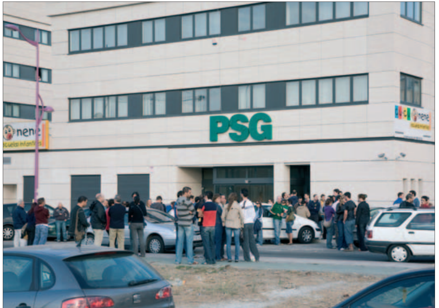
Socios de otras cooperativas que tienen adjudicadas sus viviendas en Buenavista se manifiestan contra PSG ante su sede.