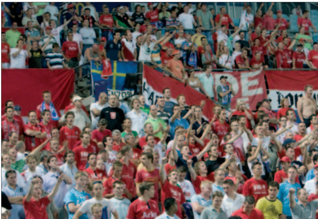
Afición del Twente en el partido disputado en el Coliseum Alfonso Pérez.

La fusión en 1965 del Sportclub Enschede y el Enschedese Boys fue el origen del actual FC Twente, que desde ese momento comenzó a tener relevancia. Ya en 1969 consiguió la tercera plaza, puesto que repitió en 1972 y 1973, consiguiendo acceder a competiciones europeas. Fueron los años dorados de un equipo que en la 1973/74 peleó por el título de la Eredivisie, un trofeo que se decidió en la penúltima jornada, en la que se enfrentó al Feyenord, su rival. A pesar de la racha de treinta partidos invicto, el Twente cayó derrotado y perdió sus opciones de lograr la primera posición. La siguiente campaña se-