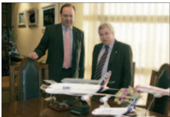
El presidente de EADS CASA y el alcalde observan algunas maquetas fabricadas por la compañía.

De producirse esta cesión de terrenos, la factoría duplicaría su superficie actual, convirtiendo a Getafe en una de las ciudades europeas con mayor concentración industrial. "Garantizaremos así no sólo la supervivencia actual de la compañía sino también su estancia en el municipio los próximos 20 años", concluyó Castro. R.H.