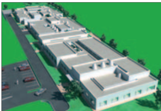
Aspecto que lucirá el nuevo edificio de Apanid.

El plazo de ejecución de los trabajos es de 14 meses, por lo que, previsiblemente, el nuevo edificio podrá abrir sus puertas a principios del año 2009.