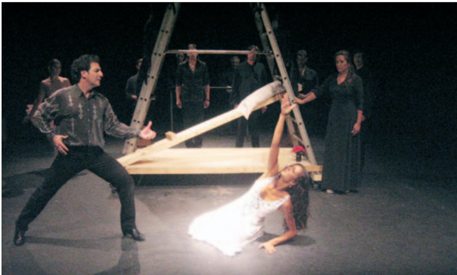
Una escena de la obra Flamenco para traviata , de la compañía La Cuadra de Sevilla.

Los sevillanos encabezan el cartel local de Madrid Sur. Su obra, Flamenco para traviata , ya se explica con el título, como dice el director de la función y de la compañía, Salvador Távora. "El lenguaje es el flamenco, en un entorno teatral como hacían los griegos, y la traviata es el tema". Sobre el escenario se verán gestos, baile, cante, palabras, acciones... El argumento "no es para niños, no hay buenos y malos, es para gente inteligente y con imaginación". Es un análisis del arte del tablao y la prostitución, un teatro de emociones. Los asistentes "no se van a aburrir, van a gozar". La compañía que fundó Távora participa por cuarta vez en este festival, aunque en Getafe se estrena. "Nos gusta ir allí. Nosotros nos movemos por ciudades como Nueva York, y Madrid Sur es muy vivo, no tiene nada que ver con el teatro burgués que se hace en otras capitales". En cuanto al público, y en la misma línea del discurso, el director siente ganas de encontrarse con un audi-