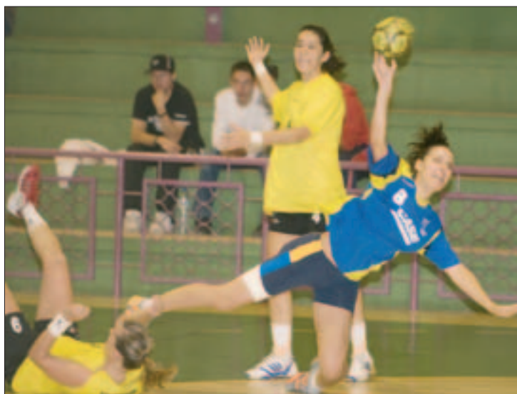
El Getasur, en su primer partido ante el S.S. de los Reyes