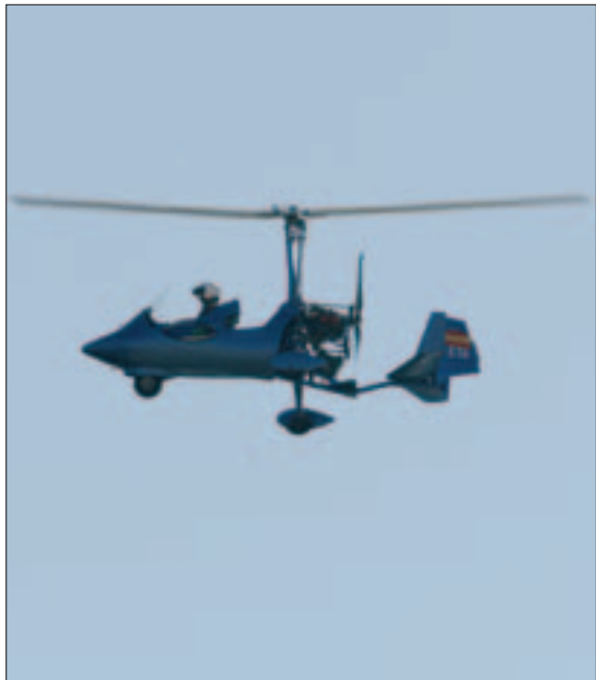
El autogiro en un momento de la exhibición.