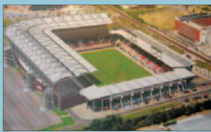
Estadio de Arke en la ciudad holandesa de Enschede.

El Twente ha convertido su campo en un difícil trago para sus rivales. Ya lo pudo comprobar el PSV Eindhoven, actual campeón del torneo nacional, que cayó derrotado en los primeros compases de la temporada pasada, mientras en la presente tampoco fue capaz de pasar del empate a cero. El estadio, situado en las afueras de la ciudad de Enschede, se construyó en mayo de 1998 y cuenta con una capacidad de 13.500 localidades. Lo estrenó precisamente el PSV en un encuentro que finalizó