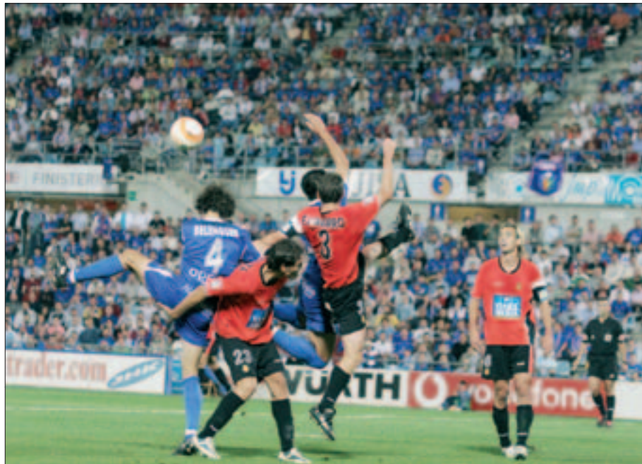
Partido ante el Mallorca disputado en el Coliseum Alfonso Pérez.