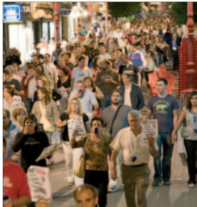
Manifestación de cooperativistas y empleados de PSG.