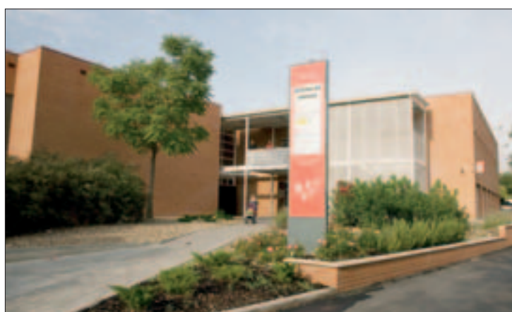
Fachada de la oficina del INEM sita en el Sector III.

E l paro registrado en Getafe desciende ligeramente respecto a 2006. La tendencia a la baja de este índice no ha permitido, sin embargo, rebajar de 6.000 las personas inscritas como demandantes de empleo. En agosto de 2007 —último apunte disponible al cierre de esta edición— la cifra de paro registrado ascendía a 6.460 personas. 3.491 de esos demandantes de empleo eran mujeres, un 61% del total. Aunque este dato sitúa al colectivo femenino en el más afectado por el desempleo en cuanto a géneros se refiere, los datos facilita-