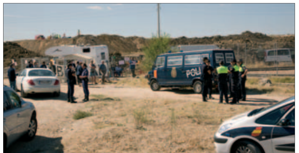
Diez empleados de PSG permanecen en el desarrollo urbanístico.