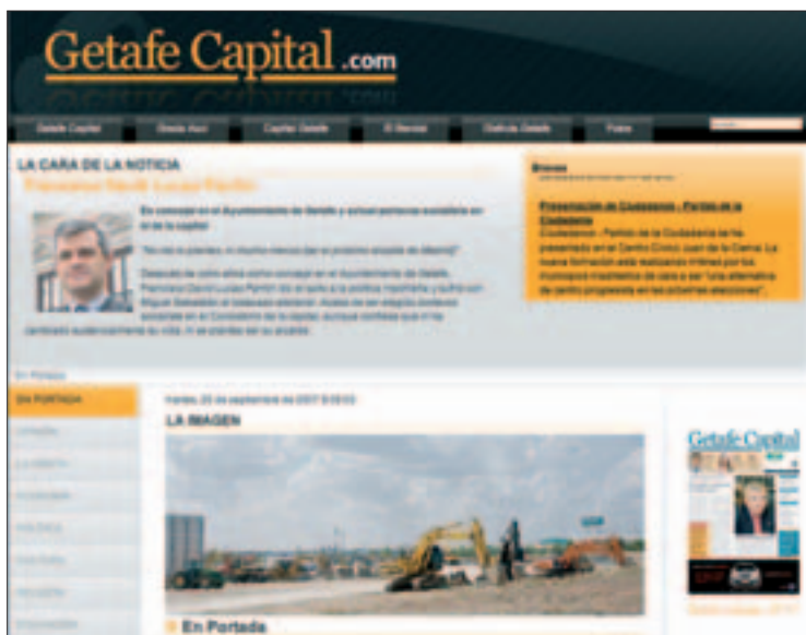
El nuevo diseño de la web, www.getafecapital.com .

La decisión de sustituir el verde corporativo de la cabecera de la edición impresa por el naranja es otro de los cambios que presenta la versión digital de GETAFE CAPITAL. “Nos decidimos por este color porque queríamos diferenciar la edición en papel de la digital y porque además, creemos que el naranja comunica muy bien, es actual y sobre todo porque estéticamente es muy completo”, explica Fernández. El naranja se emplea también para ubicar al usuario dentro de las diferentes secciones en las que se ordenan los elementos de la página. Mediante un menú situado en el margen izquierdo, los internautas podrán navegar por los diferentes espacios del periódico digital. Bajo