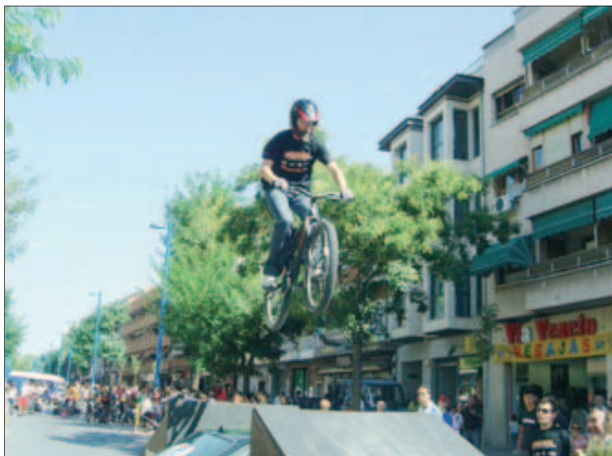
Las calles fueron tomadas durante un día por las bicicletas en la celebración central de la semana de la movilidad. Aquellos que se acercaron al núcleo urbano de la ciudad pudieron participar en actividades de spinning y también presenciar un espectáculo de bike trial, con llamativos saltos de bicis por encima de un coche.