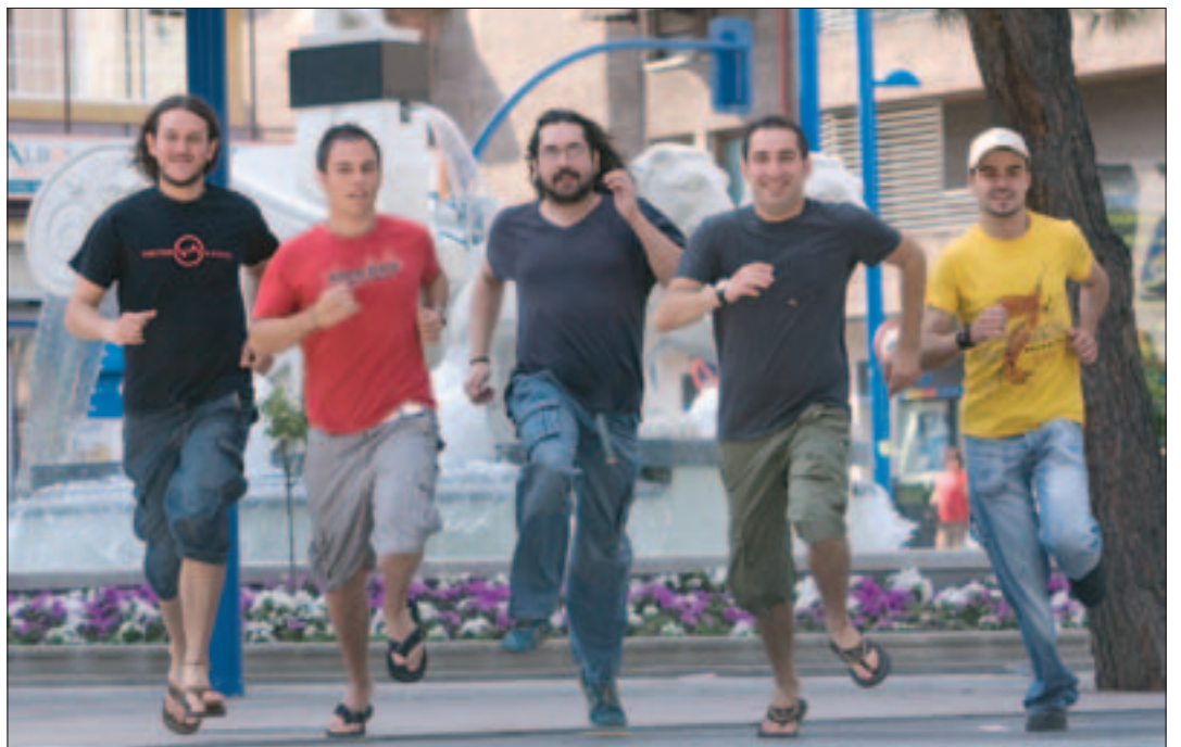
Los componente de El Paso del Trueno en la céntrica plaza del General Palacio.

“Somos gente distinta pero con la misma esencia”