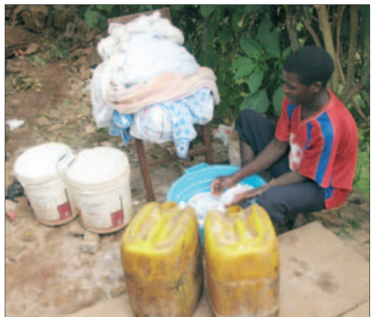
No hay lavadoras, hay que limpiar a mano.

se cerraba más el círculo”. Cuando llegó el dueño del hotel donde se hospedaban y Lancho le vio la cara de susto empezó a temblar. “Al final salimos como pudimos, casi atropellando a la gente”. Salvando este encuentro, el resto de la estancia se desarrolló sin altercados, “hay sensación de seguridad. La gente es extrañamente pacífica. Es raro, han estado 13 años en guerra y hace sólo uno que ésta terminó”. Eso sí, policías y soldados lucen campantes sus armas.