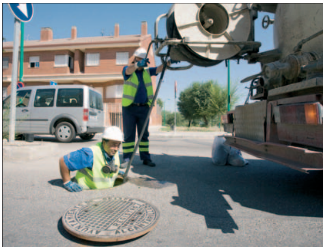
Operarios de mantenimiento bajando a un colector de aguas pluviales en Perales del Río.

separar ambos trayectos. Una tormenta de intensidad, “cuando cae mucha agua en poco tiempo, y no hay capacidad para evacuarla”, es uno de los momentos críticos, explica Arroyo. “En el invierno, una lluvia mediana, continua, no suele traer problemas. Siempre tenemos incidencias, pero en esas épocas estamos funcionando sábados, domingos, fiestas, las 24 horas”.