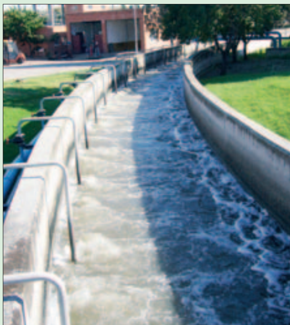
Depuradora Sur, junto a Perales del Río y el Manzanares.

El proceso de una depuradora urbana consiste en simular el ciclo biológico natural que se desarrollaría en el río, favoreciendo las condiciones óptimas para que los microorganismos responsables trabajen a tope. El viaje que realiza el agua a través de tanques y tuberías, tiene la función de eliminar todos los contaminantes que ha ad-