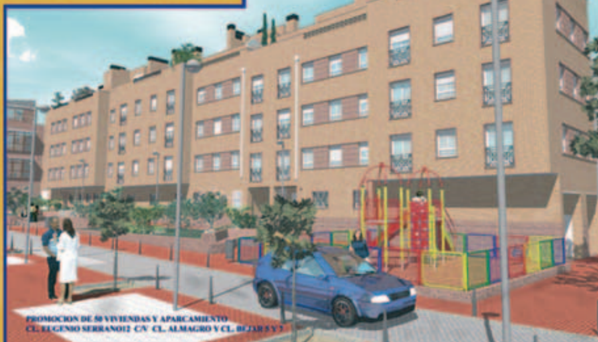
PROMOCIÓN DE 50 VIVIENDAS Y APARCAMIENTO CL. EUGENIO SERRANO12 CV CL. ALMAGRO Y CL. BÉJAR S Y 1

GETAFE CENTRO C/ EUGENIO SERRANO C.V. C/ BÉJAR Promoción de 50 viviendas y plazas de garaje. Calidades excepcionales