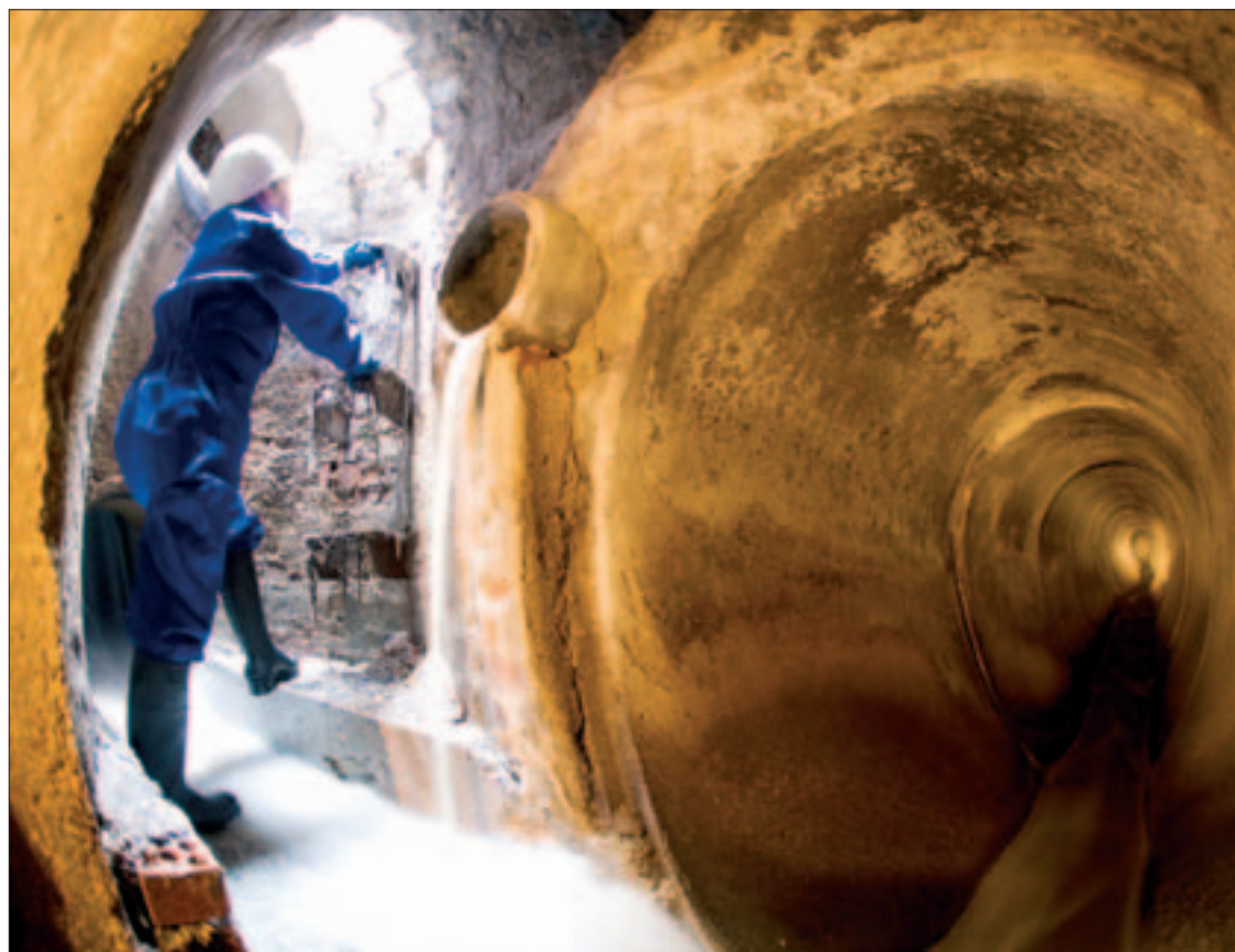
Colector ovoide de aguas fecales situado en la esquina entre las calles Polvoranca y Cuestas Bajas.

El circuito de Getafe es en su gran mayoría mixto, circulando juntas las aguas residuales, procedentes de las viviendas, y las pluviales. “Estas últimas se recogen a través de imbornales (las rejillas del borde de las aceras por donde desagua la lluvia) y sumideros en las aceras”. En barrios como el Sector III o Perales del Río se están comenzando a