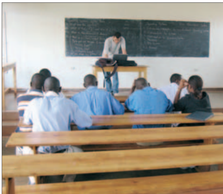
Clase de informática impartida por un miembro de la Politécnica.

No sé de dónde salían tantos, decían Umugunzu , que significa hombre blanco y también hombre rico. No se acercaban a hablar contigo, sólo algunos te daban la mano. Me tiraban del pelo. Porque claro, no habían visto a nadie, y menos a un hombre con el pelo largo y pelirrojo”. Otro episodio no fue tan cándido. Les ocurrió en Buyumbura, donde fueron asaltados por unos “yonquis” que les pidieron dinero. De repente, se vieron rodeados de gente, “cada vez