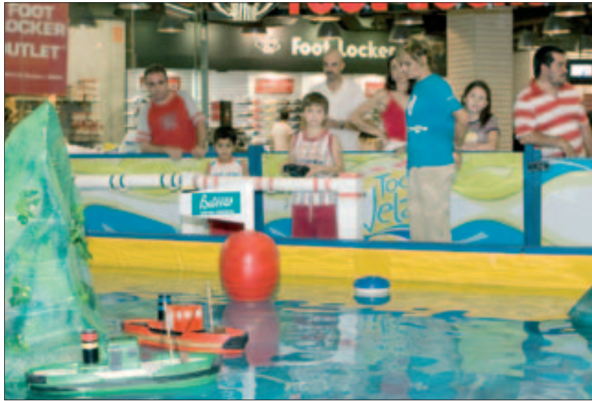
Dos pequeños jugando con los barcos teledirigidos en Bulevar.

A toda vela Centro Comercial Bulevar Hasta el lunes, 10 de septiembre