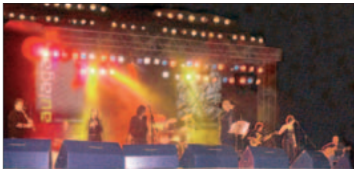
El grupo extremeño Aulaga Folk en concierto.

Toman la música popular de su zona cacereña, "que estaba olvidada", y la hacen "más atractiva", uniéndola a ritmos actuales, introduciendo por ejemplo la batería. Ésta comparte tablas con las guitarras acústica y flamenca, laúd, bajo, panderos, clarinete, requin-