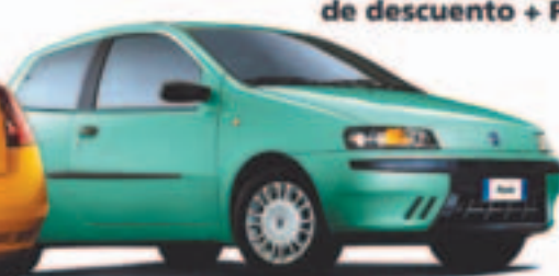
Fiat Punto con ABS desde 7.950 €