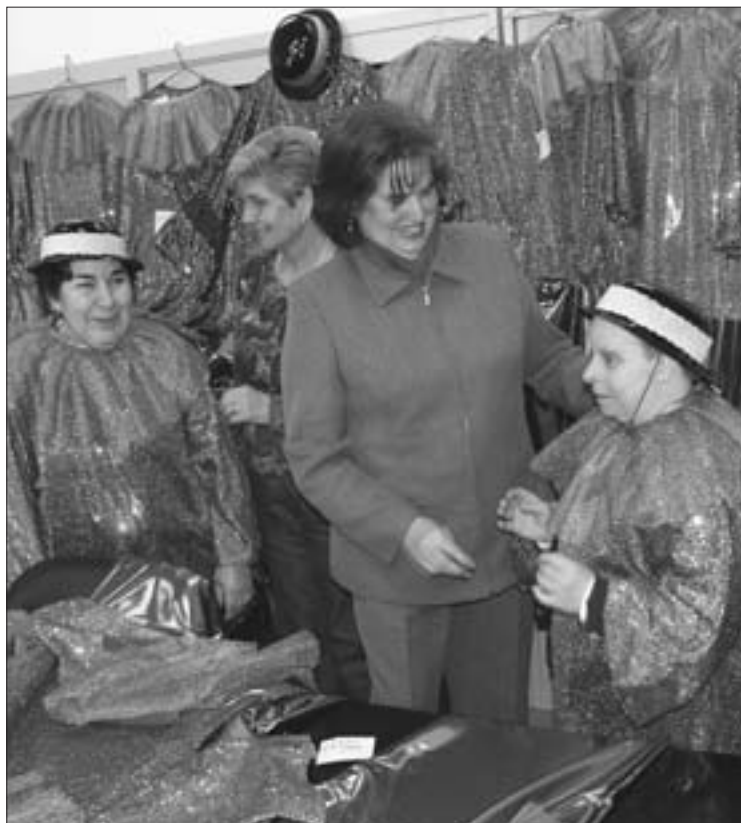
Los disminuidos psíquicos del CAMP esperan ansiosos el inicio del desfile. En la fotografía podemos ver a algunos de ellos probándose los trajes que lucirán en la fiesta, junto a sus madres.

"Nosotros buscamos la picaresca a picotazos, cogemos muchos temas variados. No solemos tener costumbre de meternos con la política"; aunque este fin de semana, tendrán que hacer referencia a los últimos acontecimientos que marcan el devenir español y mundial. "Evidentemente, era obligado hablar del tema del Prestige. Otro de los pasodobles se dedica a la función del Gobierno que va por libre, sin contar con los demás y que se ha bajado los pantalones ante Bush". Palmira Iglesias, de la Peña Taurina La Oreja, desvela qué cara va a tener el pelele este año: "Representará a un voluntario de los que han ido a Galicia". Su murga —ataviada con monos brillantes, guitarras y tupés, recordando al Rey, Elvis Presley en el 25 aniversario de su muerte—, es la primera en salir con el pelele, rumbo hacia la plaza del Ayuntamiento. En el balcón consistorial se cuelga el pelele, como marca la tradición, y allí se quedará hasta el día de la sardina, cuando se descuelgue y se queme en la hoguera junto al resto de malos rollos y demonios.