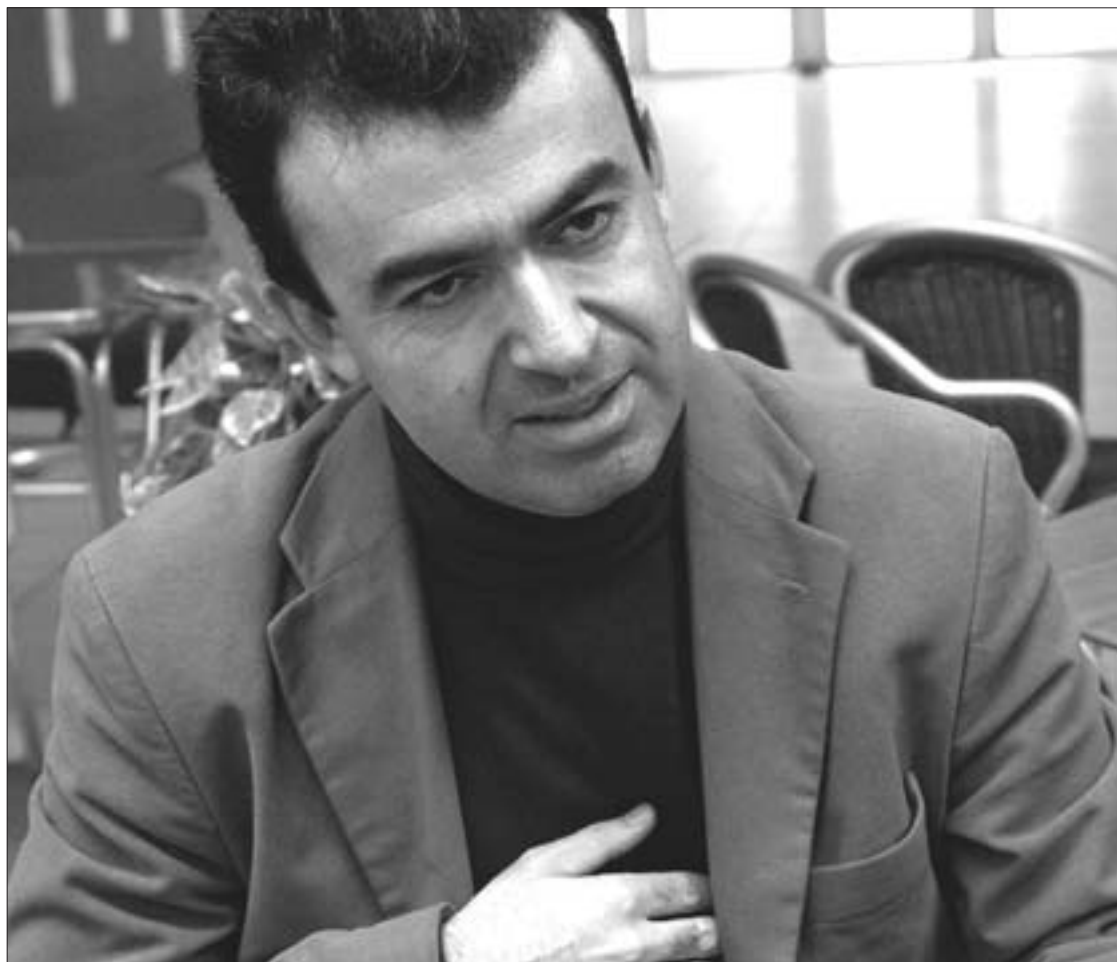
El escritor madrileño asegura que para escribir sus historias, en las que debe ser cuidadoso y verosímil, parte de la realidad, pero reinventándola para que sea más atractiva para el lector.

“Es el último paso que he dado y es muy reciente. No había escrito nada al respecto hasta este año, y lo que ha salido es un álbum ilustrado (el texto es mío, las ilustraciones no). Es un intento de llegar al momento casi fundacional de un posible interés de alguien por la lectura y por los relatos; es el momento en que tus padres se sientan contigo por la noche y te van leyendo historias. Creo que la lectura se hace manteniendo el interés desde el principio, y además manteniendo hasta el final el afán de comunicarle al lector cosas que tengan que ver con él o que puedan entrar en su mundo. El escritor de-