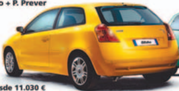
Fiat Stilo desde 11.030 €