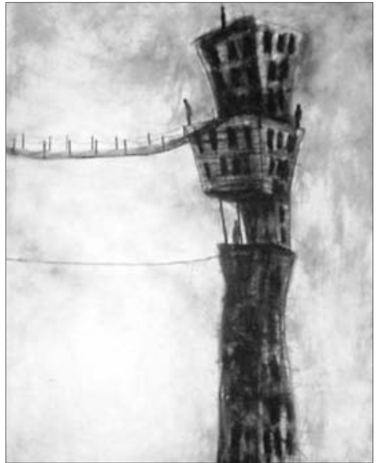
Escuelita II, de Sandor González, una de las obras expuestas.

Las paredes del Centro de Arte Ciudad de Getafe acogen hasta el próximo 7 de marzo una exposición en la que se recogen las últimas tendencias del arte cubano, una recreación de lo que han significado dos generaciones de artistas que han aportado una nueva forma de ver el mundo.