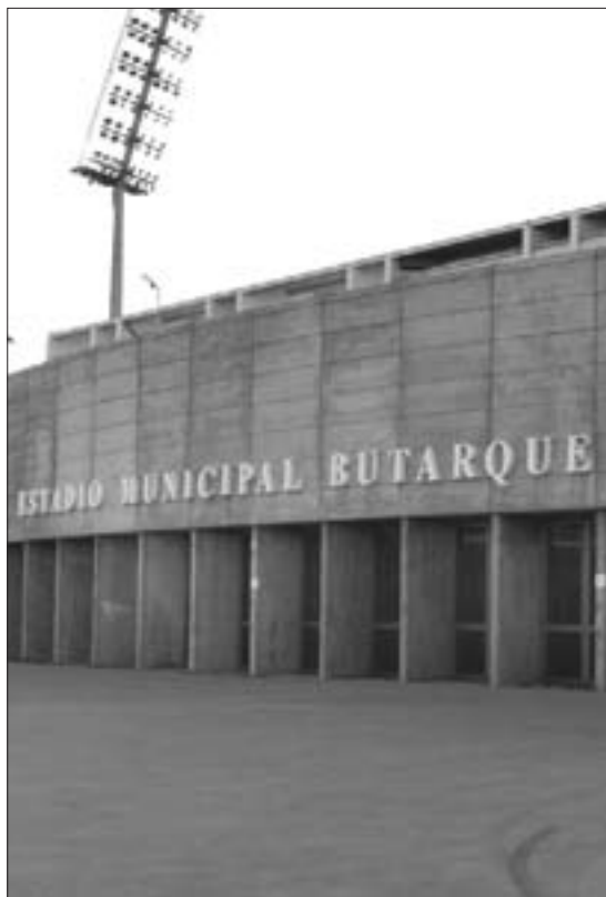
Los partidos de fútbol entre los equipos del Getafe y el Leganes siempre han sido de máxima rivalidad, desde los primeros tiempos, cuando las dos aficiones iban andando al estadio del contrario.