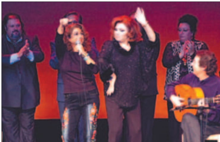
Al ritmo del “Sarandonga”, Lolita y Rocío Jurado hicieron un vis a vis, con los artistas invitados ejerciendo como palmeros.