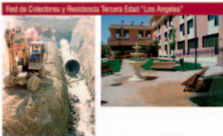
Red de Colectores y Residencia Tercera Edad "Los Angeles"