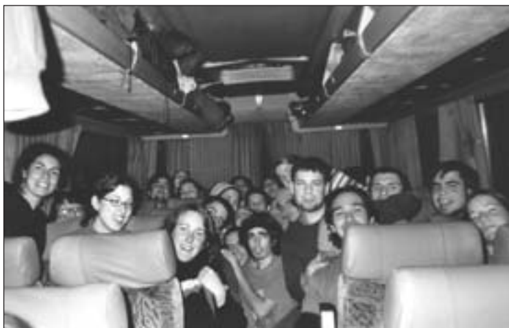
Los alumnos de la Carlos III respondieron masivamente al llamamiento solidario para ayudar en las costas gallegas.