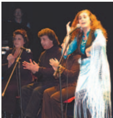
La cantaora Estrella Morente, acompañada por Montoyita, deslumbró a los asistentes con su belleza y con su voz.