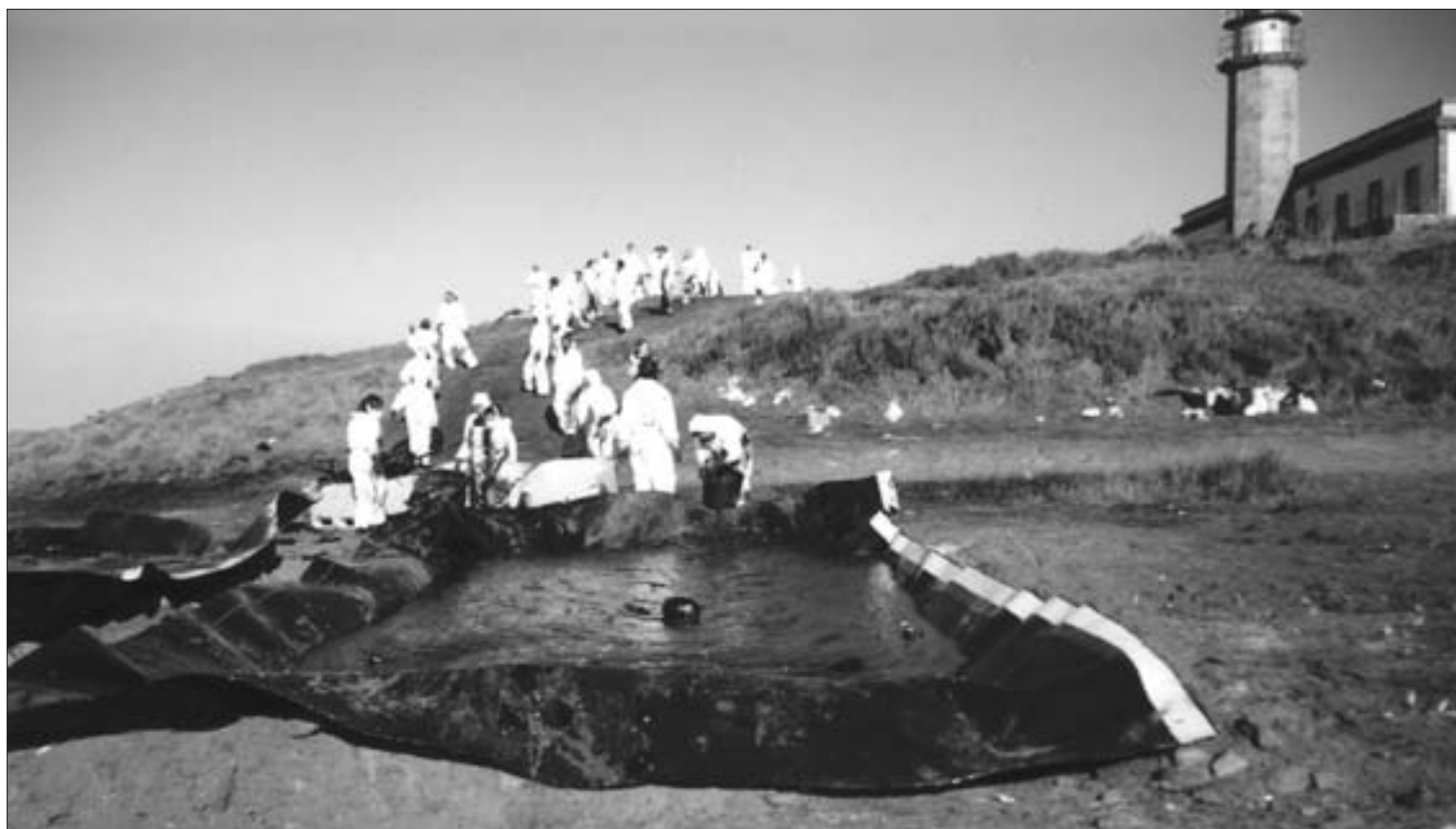
Como muestra la fotografía, los voluntarios getafenses forman una cadena humana para terminar vertiendo el fuel limpiado en un improvisado vertedero.

Tras más de ocho horas de viaje y de llegar a altas horas de la madrugada, los voluntarios se llevaron la primera sorpresa al encontrarse los polideportivos con colchones, mantas, almohadas, agua y todo lo mínimamente necesario. En Malpica, el alojamiento corrió a cargo del Ayuntamiento, mientras que en