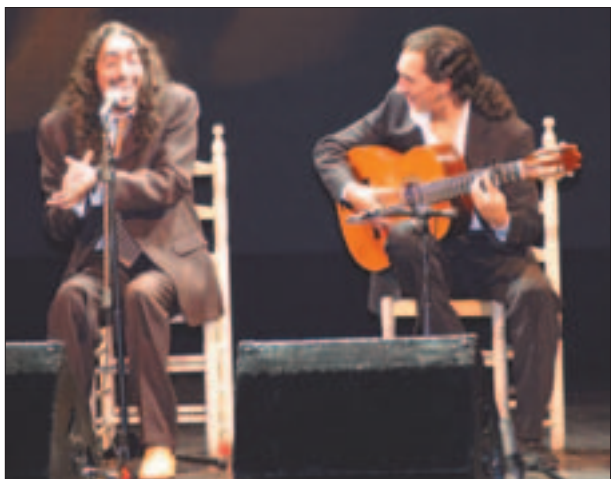
Un momento de la actuación de Diego El Cigala, otra de las primeras figuras del flamenco que no quiso perderse la cita solidaria en el Lorca de Getafe.