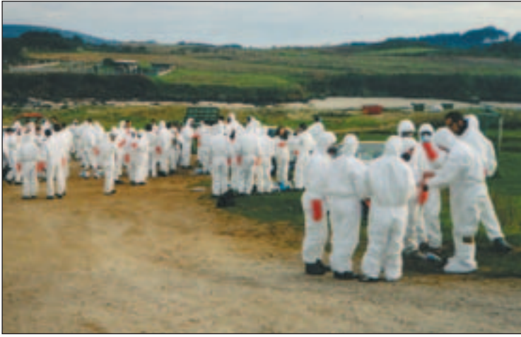
Los getafenses que han estado en las costas gallegas coinciden en apuntar la descoordinación inicial y la dureza del trabajo.