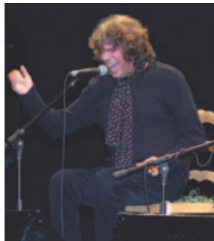
Piezas del último trabajo de José Mercé, “Lío”, resonaron en esta noche de duende, genio y solidaridad.