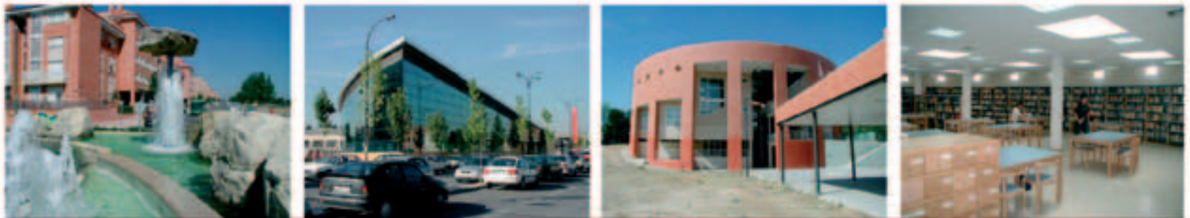
Viviendas Arroyo Güebro y Estación Centro de Cercanías y MetroSur