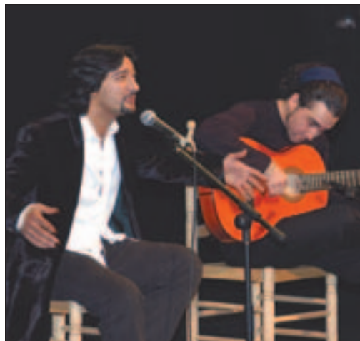
José El Francés, animó a los más jóvenes con dos de sus baladas y unas bulerías homenajando al recordado Camarón.