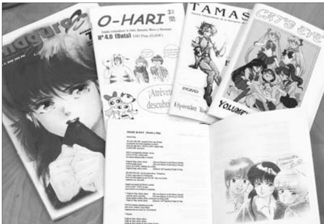
Los fanzines locales dedicados al manga y anime japoneses se citan con publicaciones de otras provincias en salones del cómic, como el recientemente celebrado en Madrid.

El fanzine (del inglés fan, y magazine, revista), se define como una publicación realizada por aficionados, esto es, no profesionales, y habitualmente se publica a través del más humilde de los medios: la fotocopiadora, aunque en Getafe encontramos algunas excepciones. Si buscamos bien, en nuestra ciudad podemos hallar un buen puñado de