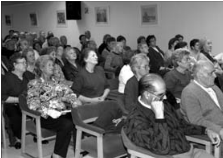
El auditorio a rebosar de premiados, asiduos del centro y voluntarios, siguió con atención las evoluciones del acto, que se cerró con refrescos, sangría y tapas, en la cafetería.