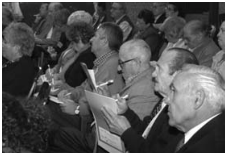
Los invitados al Encuentro, dos personas en representación de cada organización, mostraron su interés por los temas discutidos, tomando nota de lo que comentaban compañeros y ponentes.

La vieja pretensión de subir las pensiones e igualarlas a las que se cobran en el resto de países de la Comunidad Económica Europea, varias son las demandas que han incorporado en su agenda las organizaciones de mayores de la localidad: potenciar el Consejo Sectorial de Mayores y reflexionar sobre la gestión —lo que implicaría la decisión conjunta para la toma de decisiones entre los mayores y la Administración—, seguir trabajando por la eliminación de barreras arquitectónicas, asegurar los servicios sociales —entendidos como la cuarta columna del bienestar social—, continuar con la política de equipamientos residenciales, y una reclamación preponderante, por su carácter globalizador: desarrollar el Plan y la Casa del Mayor, al cobijo de una esperada concejalía exclusiva para este sector social. Estos retos fueron expuestos y debatidos por el grueso de asociaciones de la tercera edad, así como por técnicos, en lo que significa la avanzadilla de próximas iniciativas, el I Encuentro de Mayores, celebrado a instancias de la Casa de Andalucía. Las conclusiones ya han sido remitidas al Consejo Sectorial del Mayor.