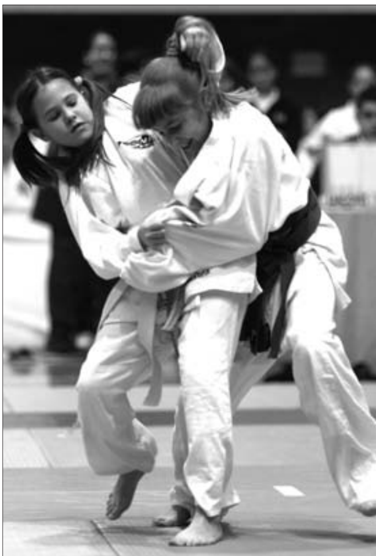
El pasado noviembre se celebró en Getafe el campeonato zonal de judo; el 21 de diciembre tendrá lugar un encuentro entre los clubs del municipio, y el 22 de marzo, el campeonato local.

La delegación de deportes del Ayuntamiento también se preocupa para que este interés siga yendo a más impulsando iniciativas competitivas y lúdicas. Así, al campeonato zonal que se celebró el pasado mes de noviembre, se sumará el festival benéfico que se realizará el próximo 21 de diciembre, un encuentro entre los clubes de Getafe. También tienen previsto para el 22 de marzo de 2003 la celebración del campeonato local, que será la fase