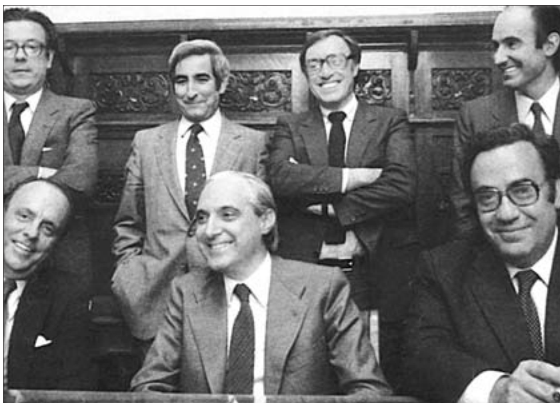
El pueblo español refrendó la Constitución el 6 de diciembre de 1978 y el Rey la sancionó solemnemente el 27 de diciembre ante la presencia de los diputados y senadores de las Cortes constituyentes. En la fotografía, los llamados padres de la Constitución. Arriba, Miguel Herrero, Gabriel Cisneros, Jordi Solé Tura y Miguel Roca. Abajo, Manuel Fraga, José Pedro Pérez-Llorca y Gregorio Peces Barba.