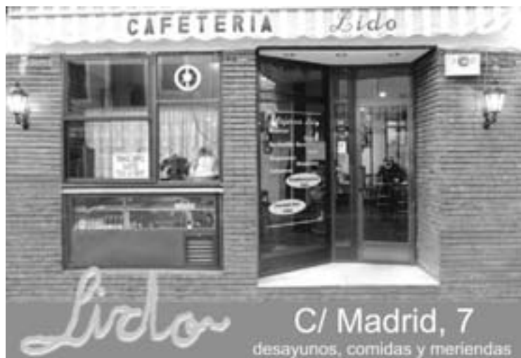
Lido C/ Madrid, 7 desayunos, comidas y meriendas