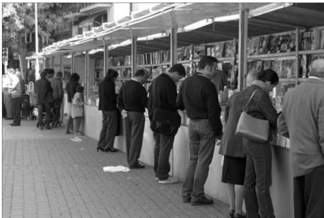
Los organizadores de la feria consultados por GETAFE CAPITAL coinciden en su valoración del público de Getafe: correcto en todo momento y muy interesado por la lectura.

● La principal causa esgrimida por los libreros es la poca rentabilidad económica que sacan, algunos no tienen a quien dejar al cargo del establecimiento y el tener que contratar a alguien les supondría una pérdida.