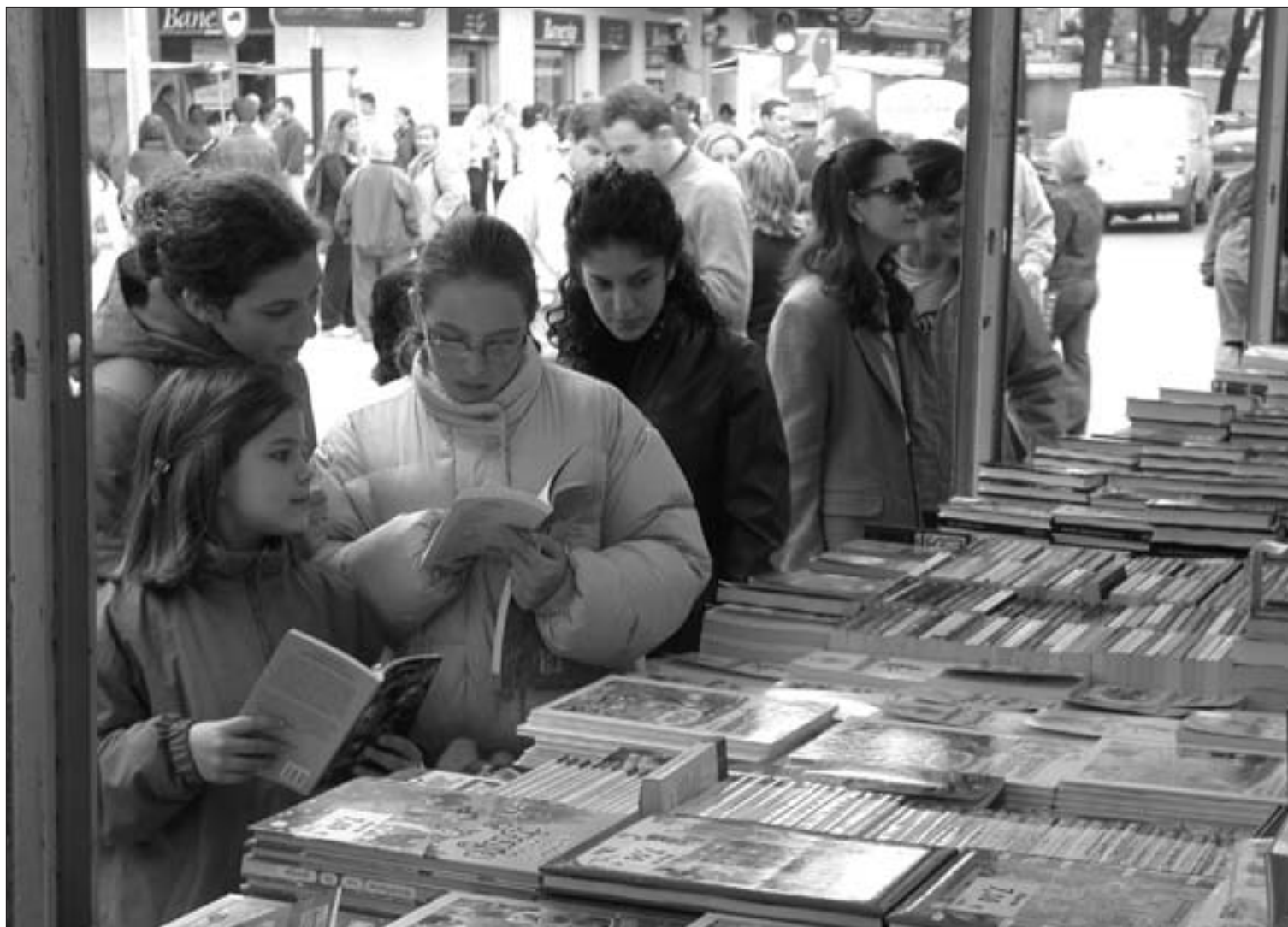
Las mañanas de los fines de semana son aprovechadas por los más jóvenes para hojear la literatura infantil expuesta en los stands.