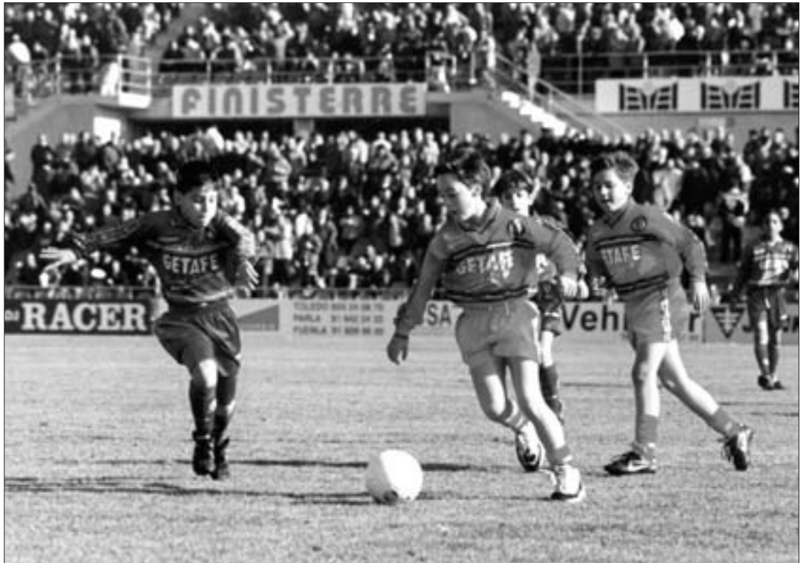
Los niños de la Escuela de Fútbol del Getafe aprenden, a través de la práctica del fútbol, a valorar otros aspectos indispensables para la vida adulta, como el compañerismo o la responsabilidad.

También conviene resaltar que los alumnos de esta escuela de fútbol pagan 150 euros por temporada; que se convierten en 135, en el supuesto de que se abone esta cantidad de una sola vez, y por ese precio se les proporciona, además, toda la indumentaria que utilizarán en los entrenamientos y los partidos. Con estos ingresos se cubre una parte de los cincuenta millones que la Escuela del Getafe tiene de presupuesto para el conjunto de la temporada.