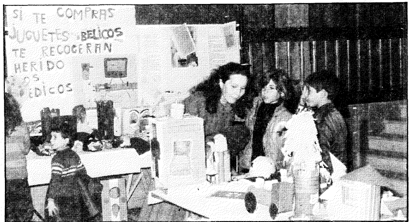
Las exposiciones, como esta de juguetes del Centro Cívico Juan de la Cierva, también son elementos de participación.