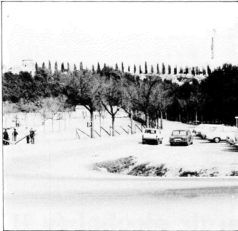
El Cerro de los Angeles será uno de los puntos en donde se desarrollarán las actividades previstas.

El programa previsto inicialmente incluye tres grupos de actividades en las que el aprendizaje y el entretenimiento van unidos: un grupo de actividades educativas y de conocimiento, en el que se dedicará un día al medio ambiente, otro a la seguridad, otro a conocer las empresas más importantes de Getafe, etc.; el segundo grupo se centra en las ac-