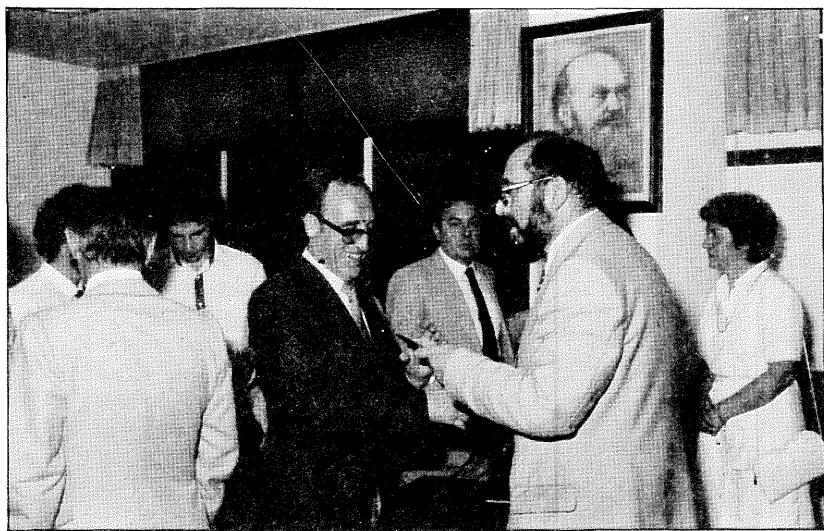
El autor de estos artículos, a la derecha, en un reciente homenaje que se le tributó. Al fondo, un retrato de Silverio Lanza.