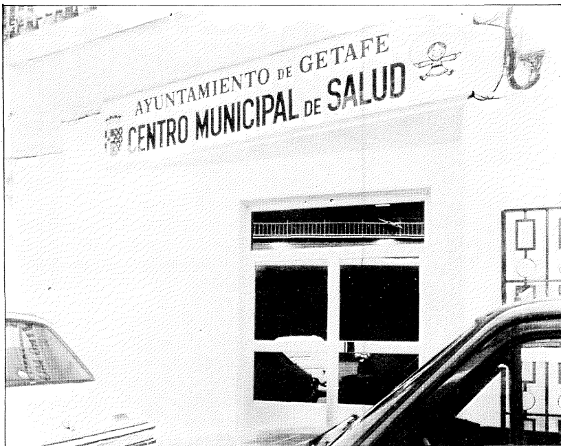
El Centro Municipal de Salud, situado en la calle Alvaro de Bazán, 12, es la única de las cuatro entidades que se configura como un servicio institucional público.

Tal y como anunciábamos en el número 43 de este boletín, en este número damos por terminada la información relativa al consumo de alcohol en Getafe. Aquí intentamos ofrecer una información básica y orientativa de las entidades que se ocupan del tema en nuestra localidad.