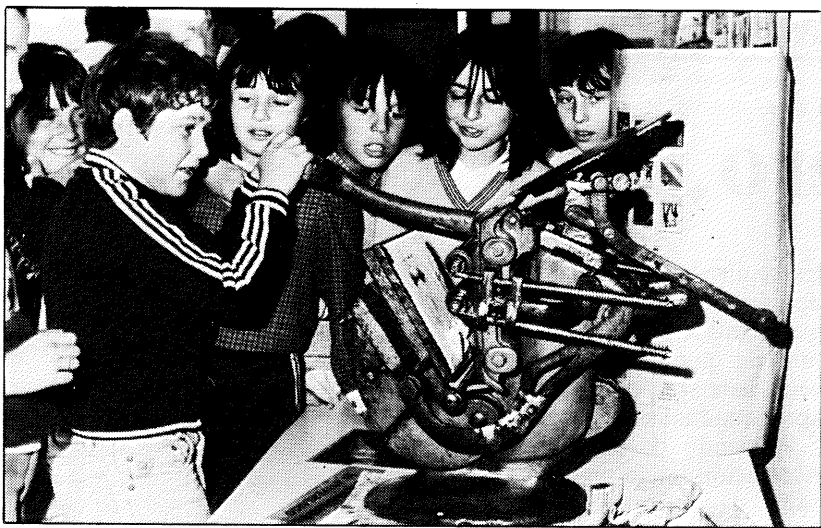
Los chavales tuvieron la oportunidad de utilizar los distintos elementos expuestos, como en el caso que recoge la fotografía, donde puede verse cómo un niño utiliza una pequeña y antigua imprenta manual.

Los chicos de 8.º de «El Greco» informan: