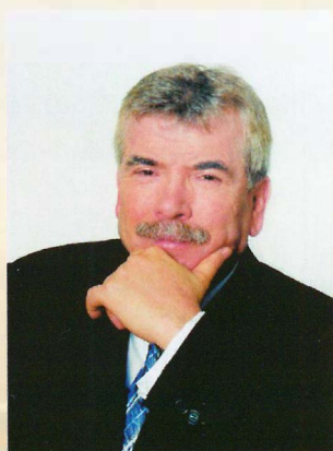
PEDRO CASTRO VÁZQUEZ Alcalde de Getafe

Una ciudad tiene una serie de características propias que la diferencian de otras y le otorgan lo que denominamos su personalidad. Getafe cuenta entre sus señas de identidad con la denominación de ciudad industrial, en la que, con el paso de los años, ha habido que realizar una profunda remodelación en todos los sectores. El trabajo realizado es ingente y no exento de riesgos. Las relaciones con las administraciones centrales y autonómicas, la inversión en suelos industriales idóneos, el esfuerzo en materia de formación y una apuesta importante por lograr que seamos una ciudad atractiva para instalar industrias de futuro, son los argumentos de peso para seguir siendo considerados como la Locomotora del Sur.