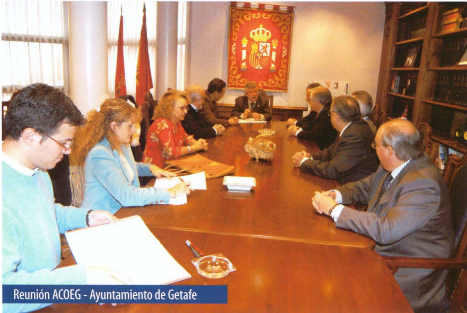
Reunión ACOEG - Ayuntamiento de Getafe

Uno de los grandes motores económicos es el comercio, un sector que es preciso cuidar al máximo por cuanto es el eje vertebrador de la ciudad, un eje que ahorma la ciudad y que propicia lugares de encuentro de los ciudadanos. El Ayuntamiento apuesta por este modelo que ofrece calidad, trato personalizado y profesionalidad y lo hace codo a codo con la Agrupación de Comerciantes y Empresarios de Getafe (ACOEG), un colectivo que lleva 25 años trabajando en este objetivo