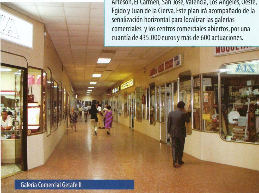
Galería Comercial Getafe II

Como la realizada en la Galería Lope de Vega, con una cuantía de 120.000 euros. Durante el año 2006 se convocarán más subvenciones a galerías por un importe de 210.000 euros.