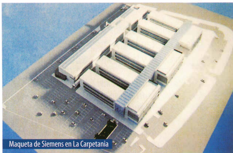
Maqueta de Siemens en La Carpetania