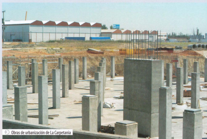
▶ Obras de urbanización de La Carpetania