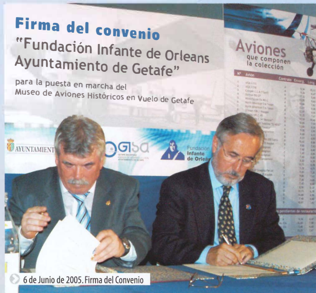
6 de Junio de 2005. Firma del Convenio