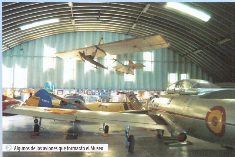
Algunos de los aviones que formarán el Museo