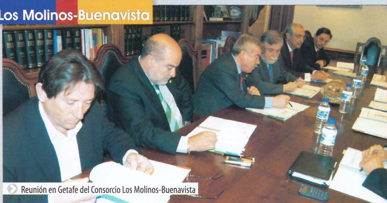
Reunión en Getafe del Consorcio Los Molinos-Buenavista