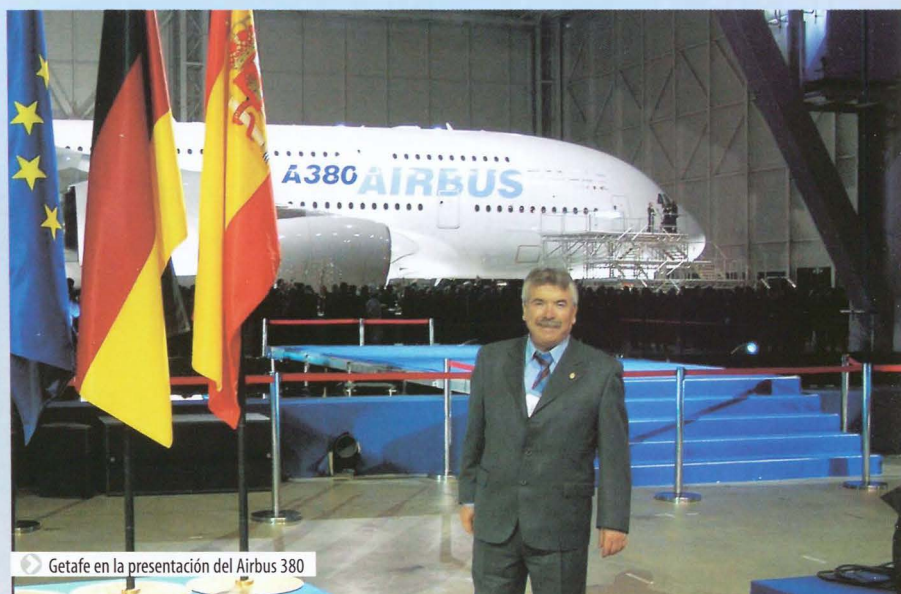
▶ Getafe en la presentación del Airbus 380