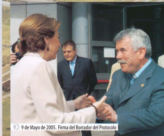
9 de Mayo de 2005. Firma del Borrador del Protocolo