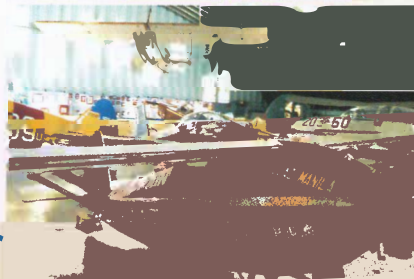
Museo de la Aviación