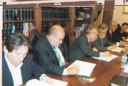
Los Molinos Buenavista