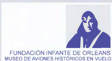
FUNDACIÓN INFANTE DE ORLEANS MUSEO DE AVIONES HISTÓRICOS EN VUELO