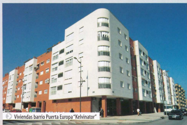
Viviendas barrio Puerta Europa "Kelvinator"