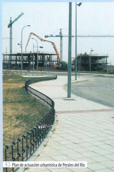
Plan de actuación urbanística de Peralas del Río