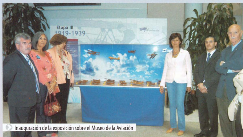
Inauguración de la exposición sobre el Museo de la Aviación