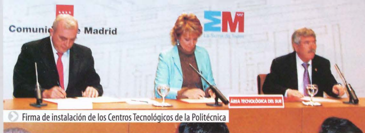
► Firma de instalación de los Centros Tecnológicos de la Politécnica