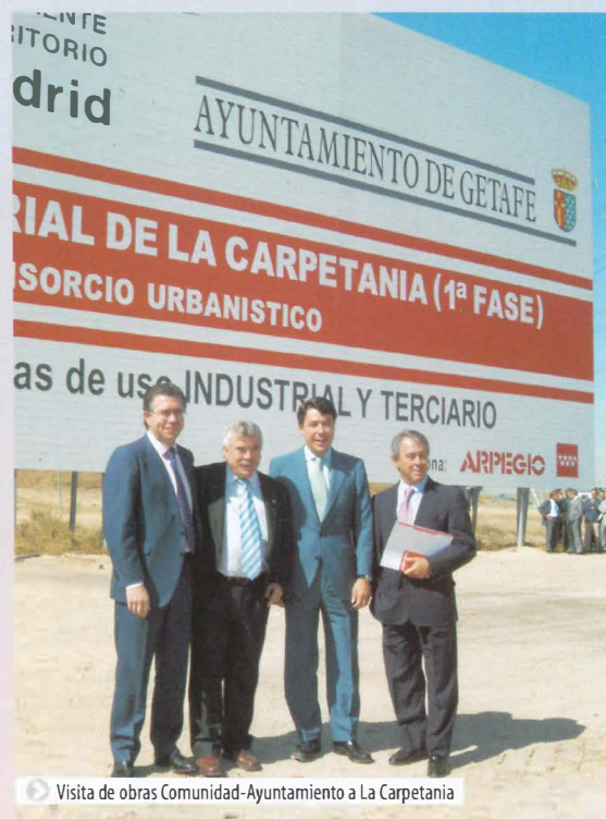
▶ Visita de obras Comunidad-Ayuntamiento a La Carpetania