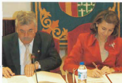
Metro Perales y Casar