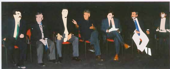
Los alcaldes del Sur con el Presidente de Honor del Instituto de Cultura del Sur, Felipe González, en el acto inaugural del Instituto en Parla

artesanos, políticos, abogados, poetas, emprendedores, artistas, cantantes, profesores, rectores, investigadores, editores, escritores, soñadores, bailarines, pintores, cineastas, sociólogos, bohemios, técnicos, el universo del teatro, premios Nobel, nuevos creadores, navegantes de la "red", actores y compositores, a la par que se mezclan con el "otro" extremeños, catalanes, magrebíes, portugueses, franceses, mexicanos, valencianos, vascos, asturianos, madrileños, cántabros, alemanes, africanos, ciudadanos del mundo y trotamundos.