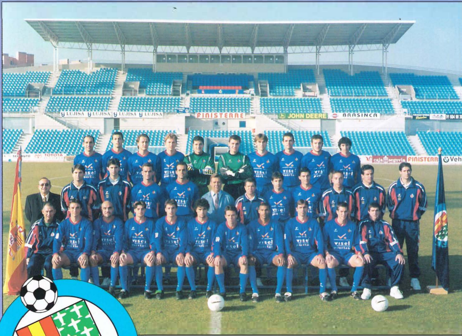
Primera plantilla del Getafe C.F., quien en la próxima temporada han de luchar por consolidarse en 2.ª División.