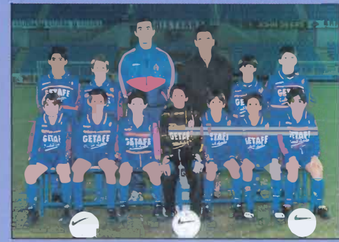
El nuevo proyecto pretende que estos chavales lleguen algún día a pertenecer a la élite del fútbol, habiendo salido de Getafe.