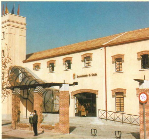
Fábrica de Harinas, sede de GISA

La Agencia de Desarrollo Local Getafe Inicativas, S.A. (GISA) diseña y promueve el Proyecto ESTIC como instrumento de activación de la economía local