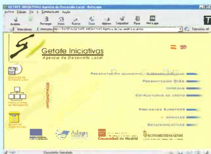
Páginas web de GISA

Experiencias de cooperación con la Universidad Carlos III en la implantación de nuevas herramientas de gestión. Colaboración con empresas líderes de nuestro municipio como CASA y SIEMENS en la integración de nuestras Pymes en sus sistemas de calidad.