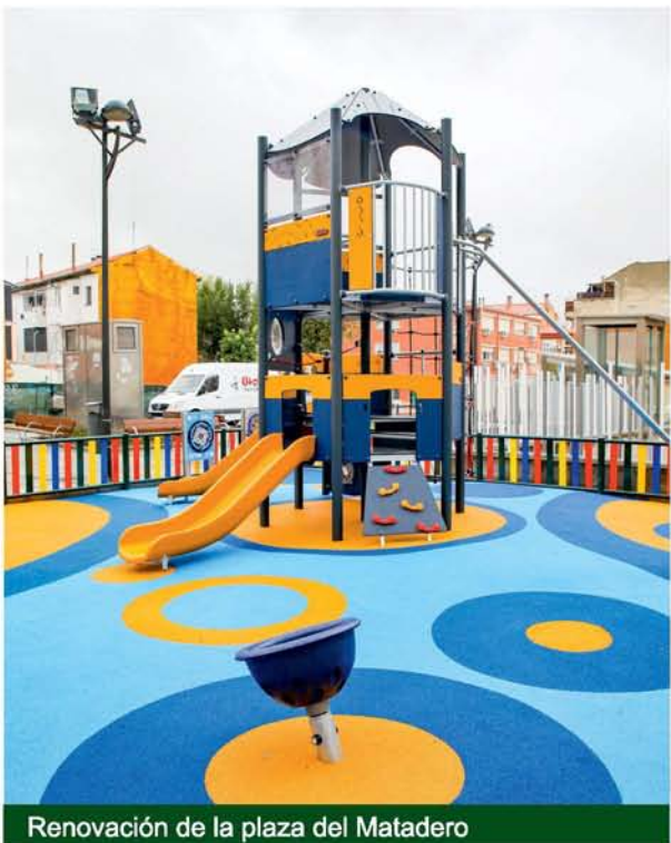
Renovación de la plaza del Matadero