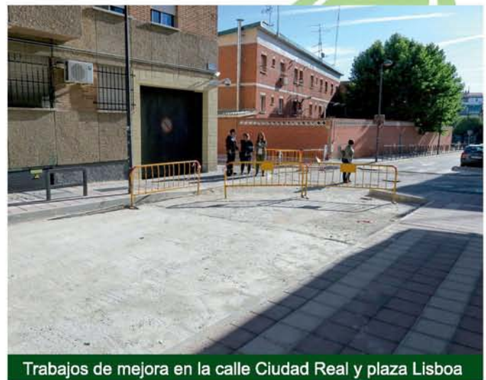
Trabajos de mejora en la calle Ciudad Real y plaza Lisboa