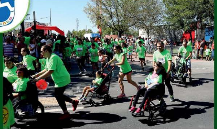
CARRERA DEDINES 2019