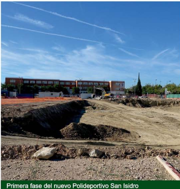
Primera fase del nuevo Polideportivo San Isidro

Con el objetivo de que niños y niñas puedan disfrutar de una educación de calidad en todos los ámbitos, se atenderán las mejoras reclamadas por madres, padres y personal directivo.