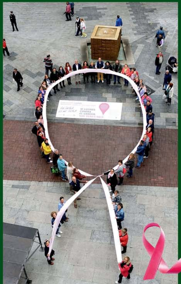
DÍA CONTRA EL CÁNCER DE MAMA