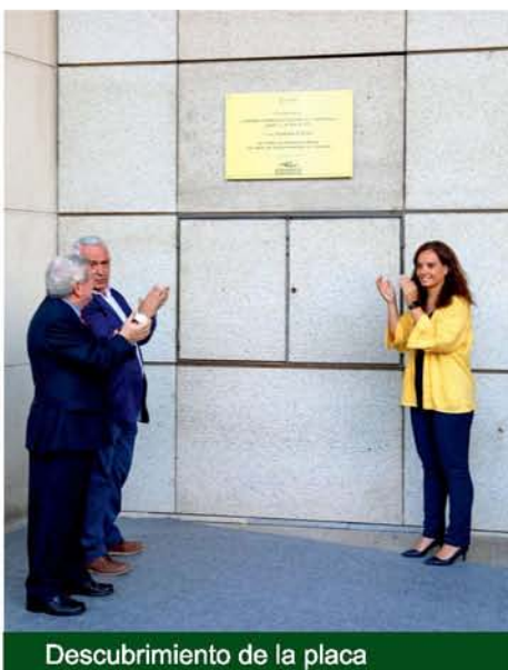
Descubrimiento de la placa