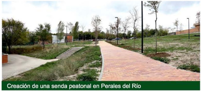
Creación de una senda peatonal en Perales del Río