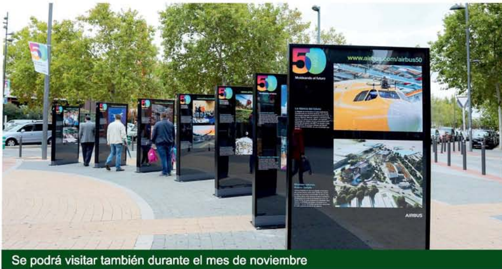
Se podrá visitar también durante el mes de noviembre