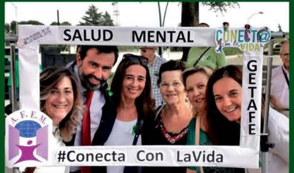
DÍA DE LA SALUD MENTAL 2019