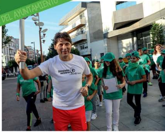
El atleta olímpico Roberto Parra llevó la antorcha a los 22 colegios participantes