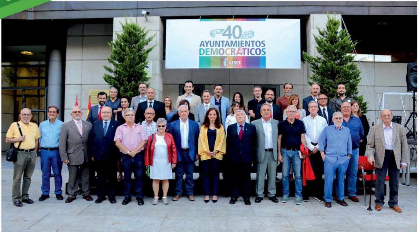
Corporaciones municipales de 1979 y 2019