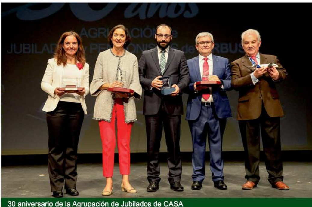
30 aniversario de la Agrupación de Jubilados de CASA

▼ La alcaldesa arrancó el compromiso de la Comunidad de Madrid para desbloquear la ampliación de Carpetania