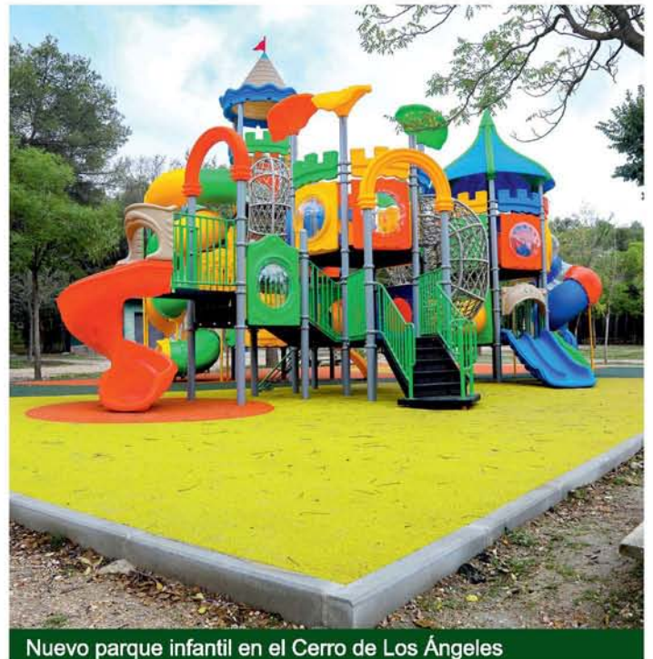
Nuevo parque infantil en el Cerro de Los Ángeles