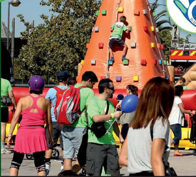
CARRERA DEDINES 2019