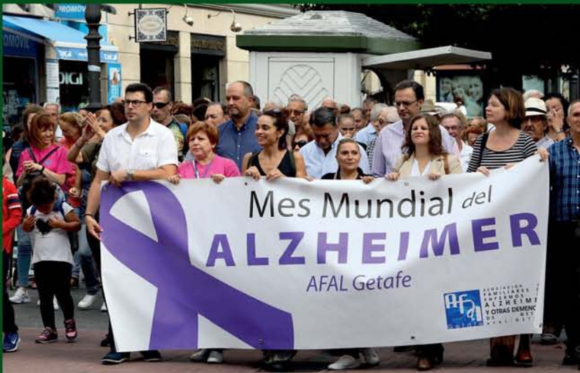
DÍA INTERNACIONAL DEL ALZHEIMER EN GETAFE