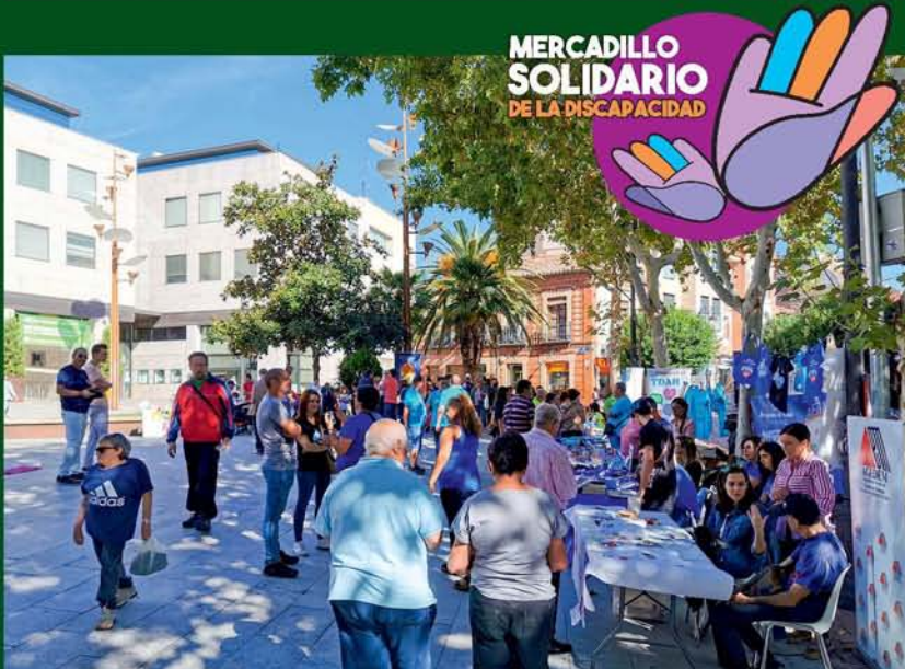
MERCADILLO SOLIDARIO DE LA DISCAPACIDAD