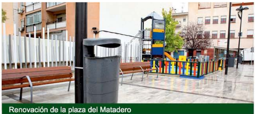
Renovación de la plaza del Matadero