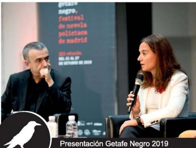
Presentación Getafe Negro 2019

Conciertos, Circo, Danza, Teatro de Calle, Mercadillo y una infinidad de actividades en el centro y en los barrios de Perales del Río, Los Molinos, Buenavista y El Bercial