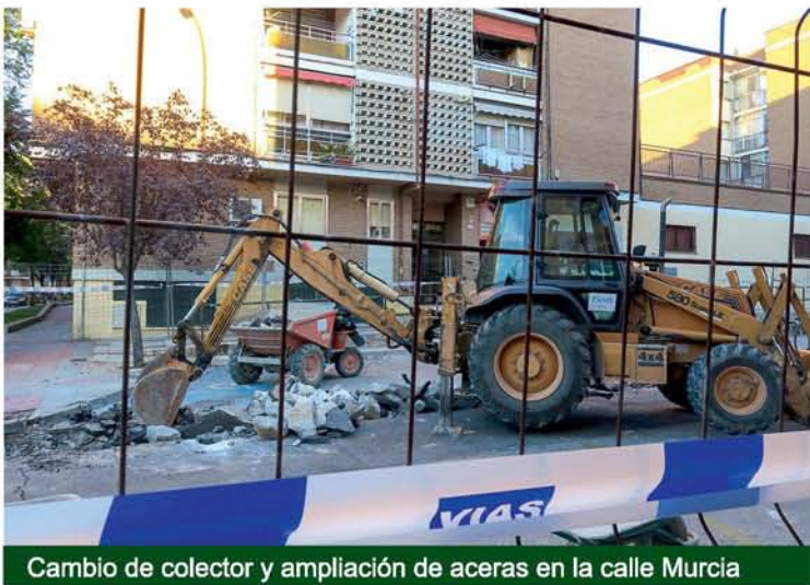
Cambio de colector y ampliación de aceras en la calle Murcia