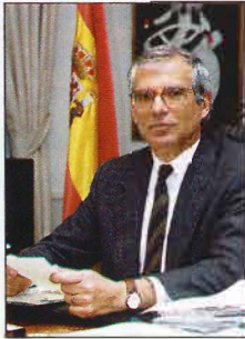
JOSÉ BORRELL FONTELLES

Estas son las frases de los principales protagonistas, que quedarán ya grabadas en la memoria histórica de este pueblo.