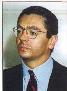
ALBERTO RUIZ-GALLARDÓN JIMÉNEZ

“En Getafe, 16.000 personas utilizan este medio de transporte un día laborable medio, y esa es una cifra extraordinariamente alta.”