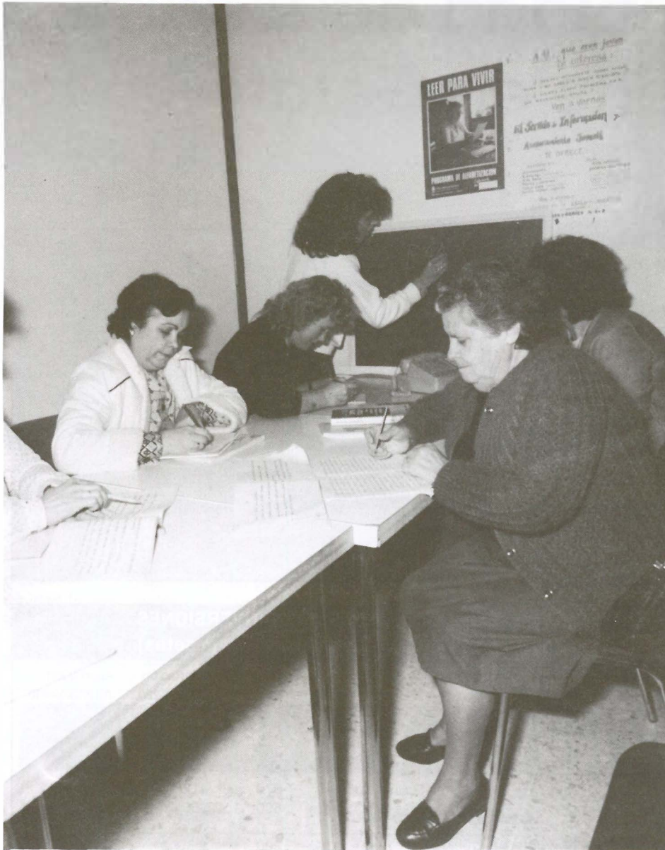
La matrícula se podrá realizar del 1 al 10 de septiembre