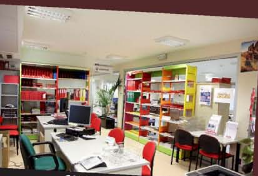
SALAS PARA ATENCIÓN Y CONSULTA

Cuenta con dos plantas y más de 600 m 2 para realizar actividades interiores y al aire libre