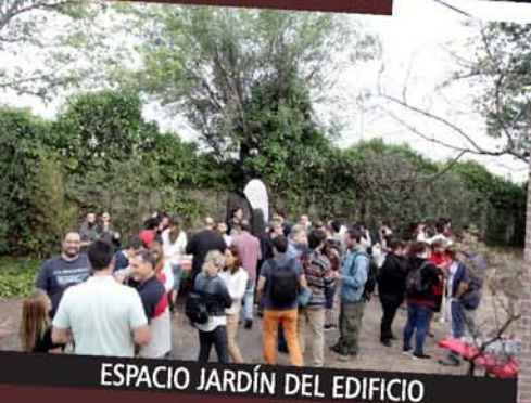
ESPACIO JARDÍN DEL EDIFICIO

Está situado en la avenida Fuerzas Armadas en el barrio de San Isidro