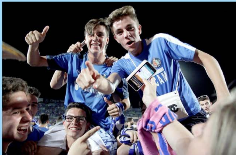
LOS SEGUIDORES DEL GETAFE LO CELEBRAN EN EL CAMPO