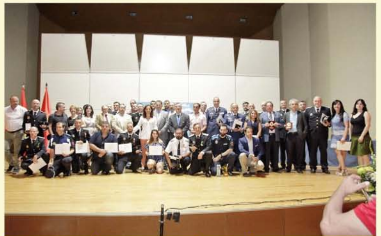
LA POLICÍA LOCAL CELEBRÓ SU PATRÓN CON RECONOCIMIENTOS