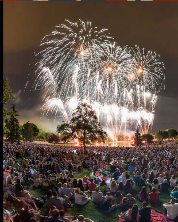
FUEGOS ARTIFICIALES EN EL LAGO DEL SECTOR III

El espectáculo Piromusical concentró a más de 15.000 personas en el Parque Alhóndiga-Sector III