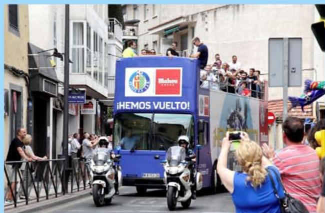
EL AUTOBÚS LLEGA AL AYUNTAMIENTO

Presidente, entrenador, plantilla y cuerpo técnico fueron recibidos por la alcaldesa y la corporación municipal en el Ayuntamiento