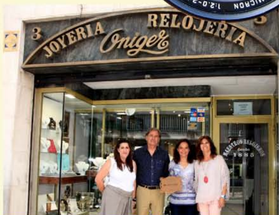
UNA PLACA IDENTIFICARÁ A LOS PEQUEÑOS COMERCIOS CON MÁS DE 50 AÑOS COMO RECONOCIMIENTO A TODA SU TRAYECTORIA