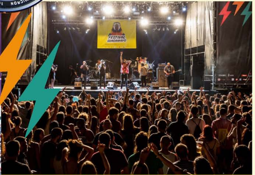
CULTURA INQUIETA PONE ACENTO CULTURAL AL VERANO