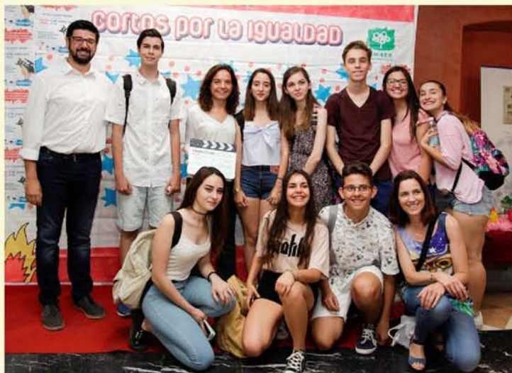
MÁS DE 700 JÓVENES HICIERON SUS 'CORTOS POR LA IGUALDAD'