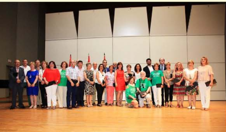
EL EXMINJSTRO DE EDUCACIÓN, ANGEL GABILONDO, ACOMPAÑÓ A LOS MAESTROS Y MAESTRAS JUBILADOS ESTE AÑO