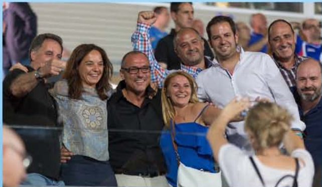
EN EL PALCO DURANTE EL PARTIDO