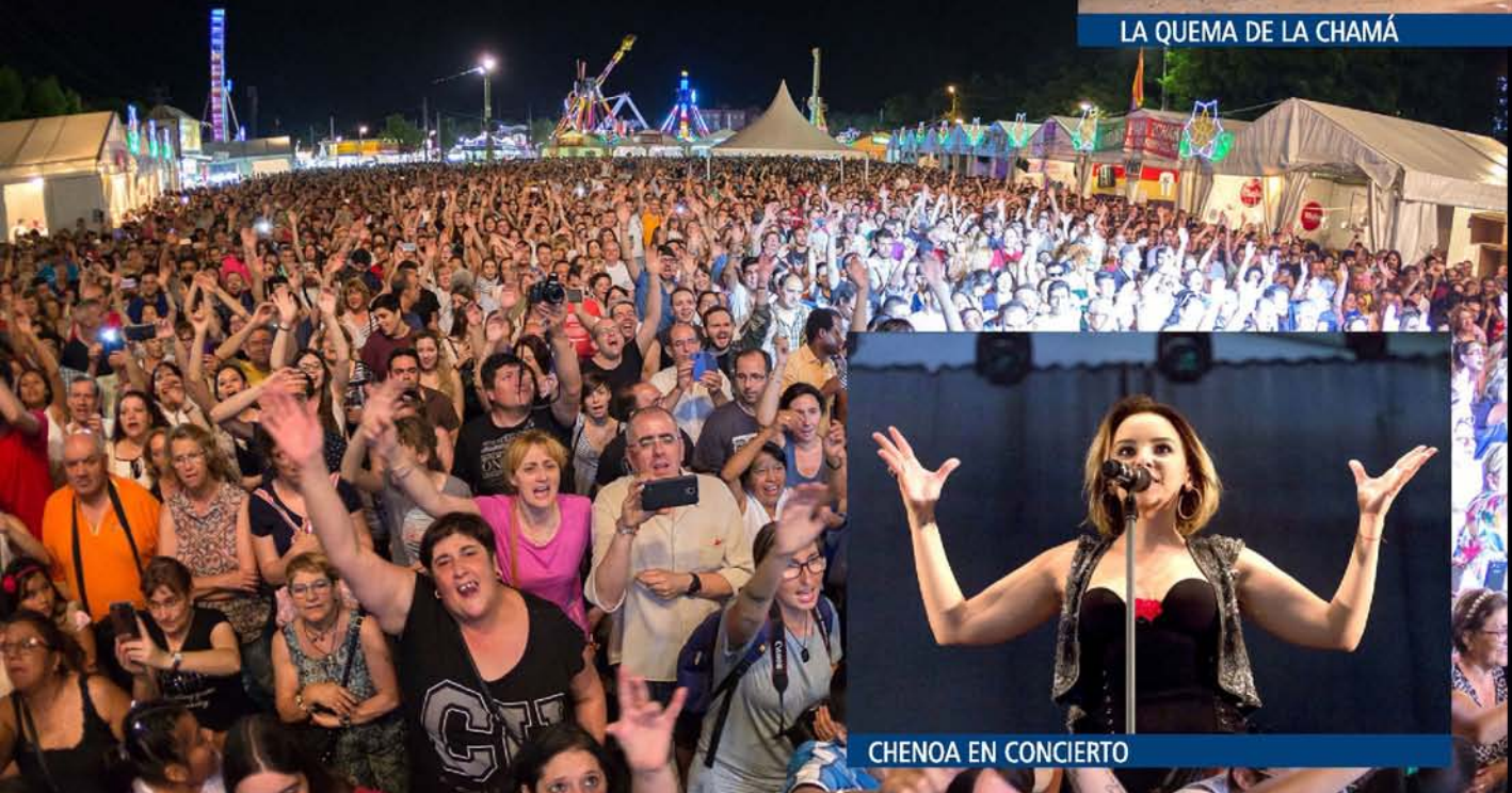
CHENOA EN CONCIERTO