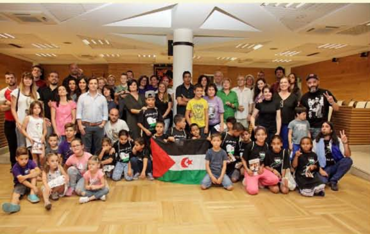
14 NIÑOS SAHARAUIS DISFRUTARÁN DE UNAS 'VACACIONES EN PAZ'