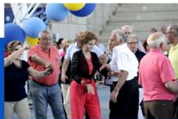
Por primera vez se celebró el Gran Baile de Getafe