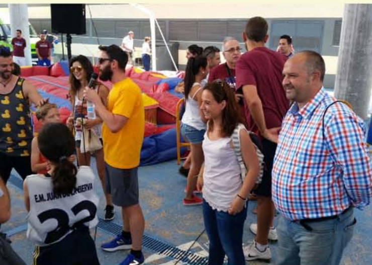
IMPROVICIADOS: PROYECTO SOLIDARIO CON DANI ROVIRA