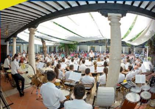
CONCIERTOS, ENCIERROS Y PASACALLES

Por primera vez se desarrolló una campaña informativa contra el acoso sexual