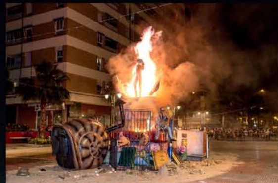
LA QUEMA DE LA CHAMÁ