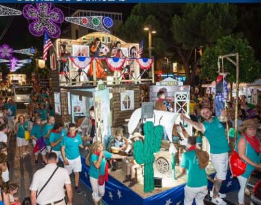
DESFILE DE CARROZAS

75.000 personas disfrutaron del Desfile de Carrozas por las calles de la ciudad