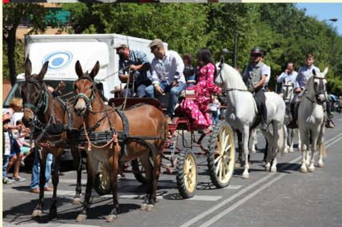
LA SEGUNDA ROMERÍA ROCIERA MÁS IMPORTANTE DE ESPAÑA SE CELEBRA EN GETAFE