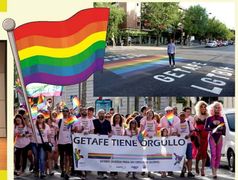
CADA AÑO GETAFE TIENE MÁS ORGULLO