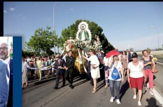
BAJADA DE LA VIRGEN