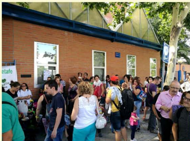
LA COMUNIDAD EDUCATIVA CONTRA LAS OBRAS POR FASES DEL GOBIERNO REGIONAL EN EL BARRIO DE LOS MOLINOS