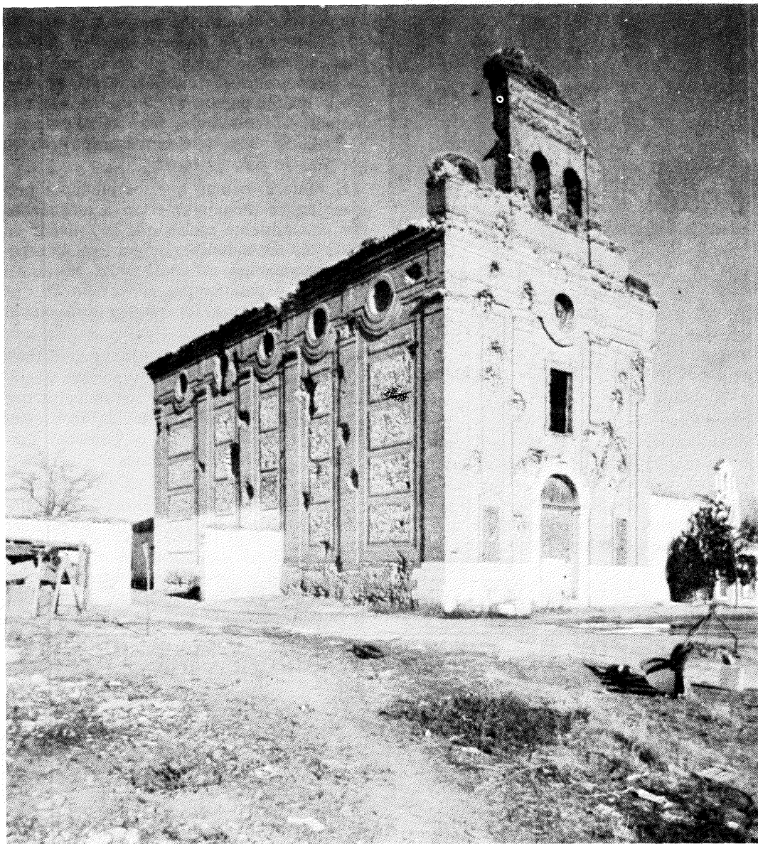
De los poblados anteriores y absorbidos por Getafe, sólo quedan restos en Perales del Río.

En cambio, la fundación de Getafe por los árabes ofrece bastantes dudas. Seseña y Benavente manifiestan en las "Relaciones" "que el pueblo es nuevo y que tenemos entendido, según hemos oído decir a hombres antiguos, que habrá como doscientos y cincuenta años que se mudó donde estaba la población a donde está agora, que fue de dicho Alarnes". Si tomamos al pie de la letra las manifestaciones que hacen estos dos getafenses en la segunda mitad del siglo XVI, resulta que el actual núcleo urbano de Getafe nació como entidad de población sobre el año 1326, o sea, en la primera mitad del siglo XIV, cuando gobernaba el Reino de Castilla Alfonso XI.