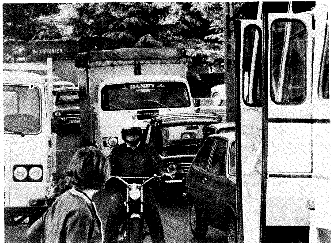
Los atascos de unos días traerán soluciones de muchos años.