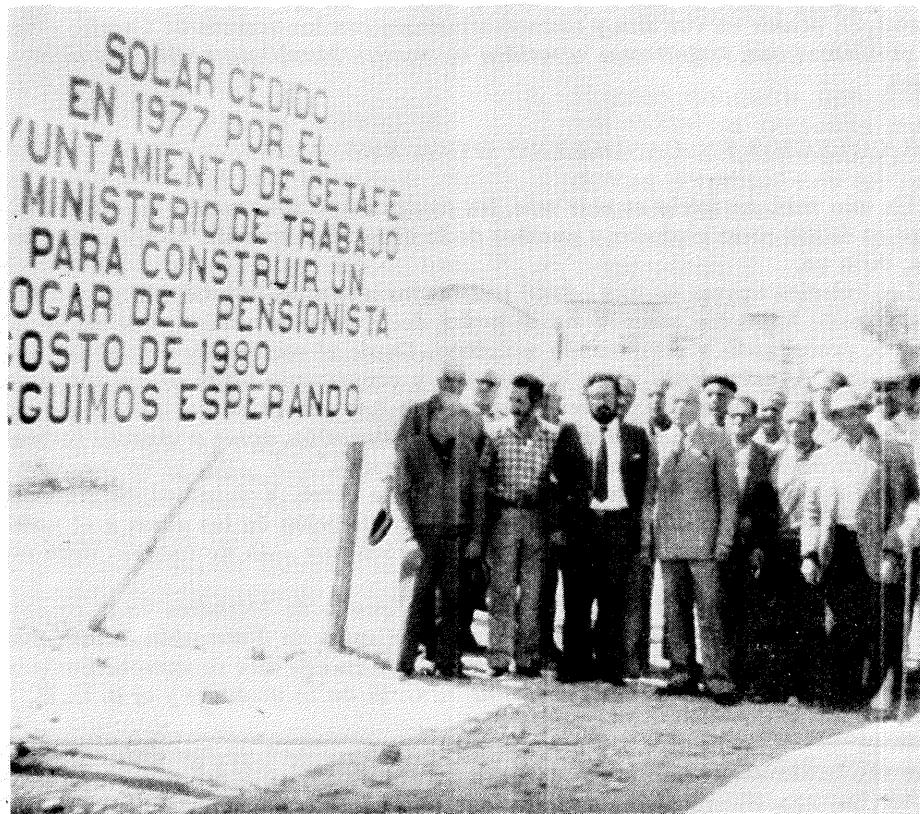
Los jubilados y el Ayuntamiento siguen esperando.

chos casos nuestra salud no nos permite tomar nada, entonces sólo nos queda la posibilidad de pasear por nuestras heladas calles, quitándonos el frío como mejor podamos.