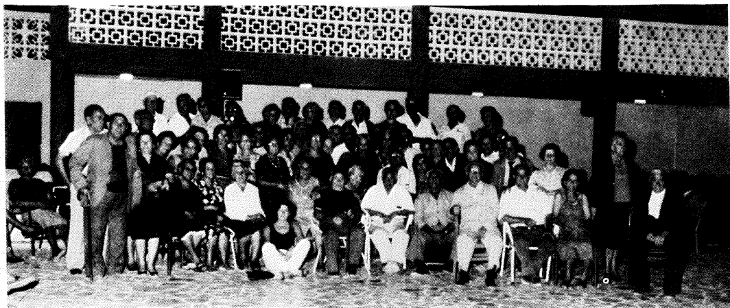
Los afortunados descansan y posan para la posteridad.