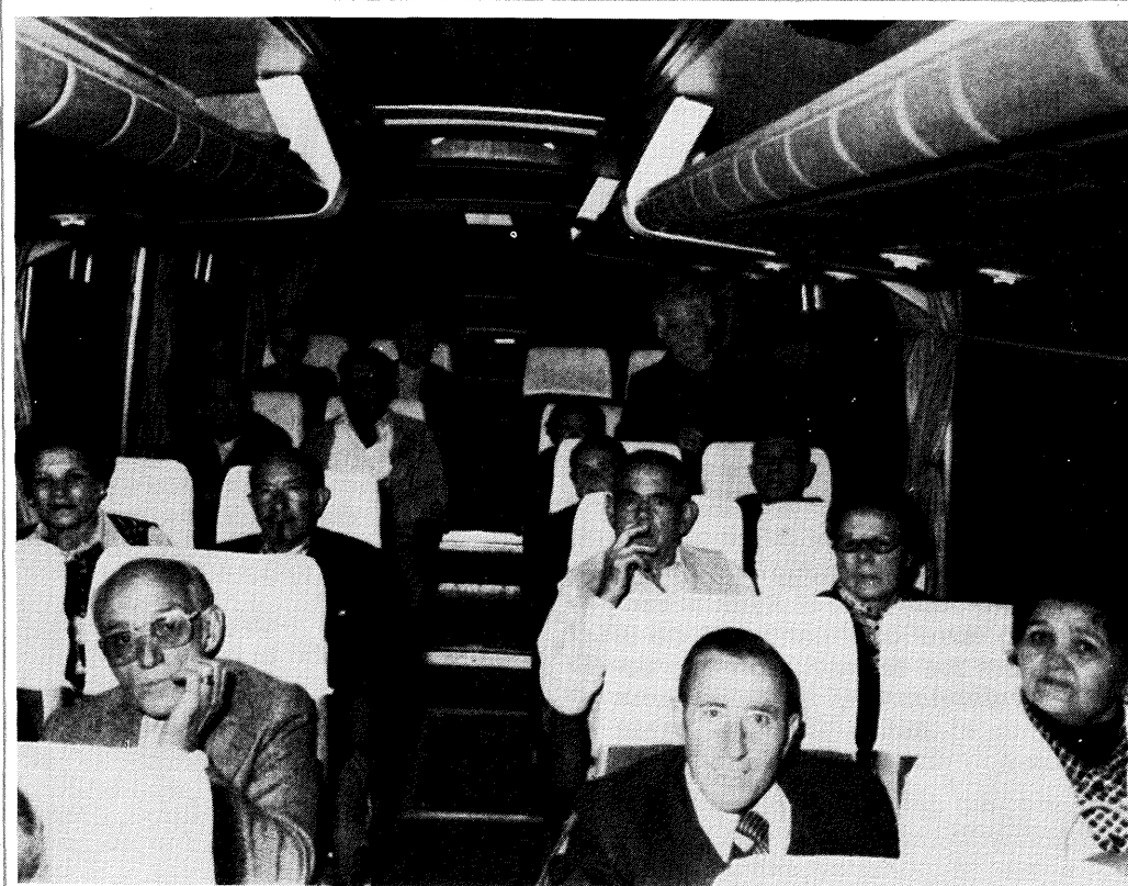
Aunque no en autobús como este, los jubilados podrán viajar más por menos dinero.

Fdo.: JESUS NEIRA SALAZAR Concejal de Sanidad y Saneamiento