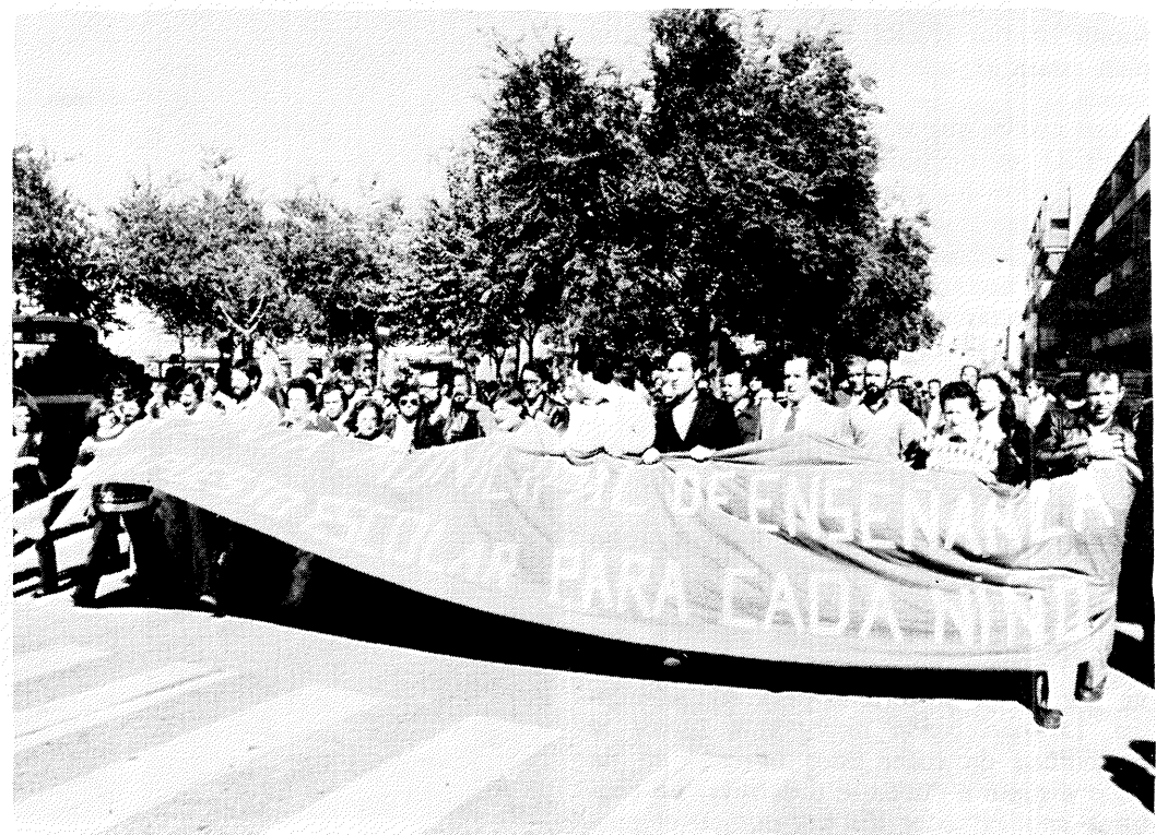
A la cabeza de la manifestación la Junta Municipal de enseñanza.

El domingo, día 12 de octubre, tuvo lugar una multitudinaria manifestación convocada y encabezada por la Junta Municipal de Enseñanza reclamando la pronta solución de los problemas de este sector.