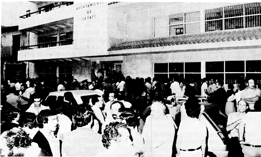
Los vecinos abarrotaron la plaza de la Constitución para seguir el pleno a través de la megafonía.

Actualmente, las discusiones entre trabajadores y ejecutivos de Kelvinator se centran en el problema de la reducción de personal.