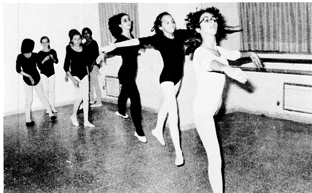
Las clases de ballet, un éxito por encima de lo esperado.

mente, pero ya estamos empezando a modelar el barro aunque no a cocer ni a tornear.