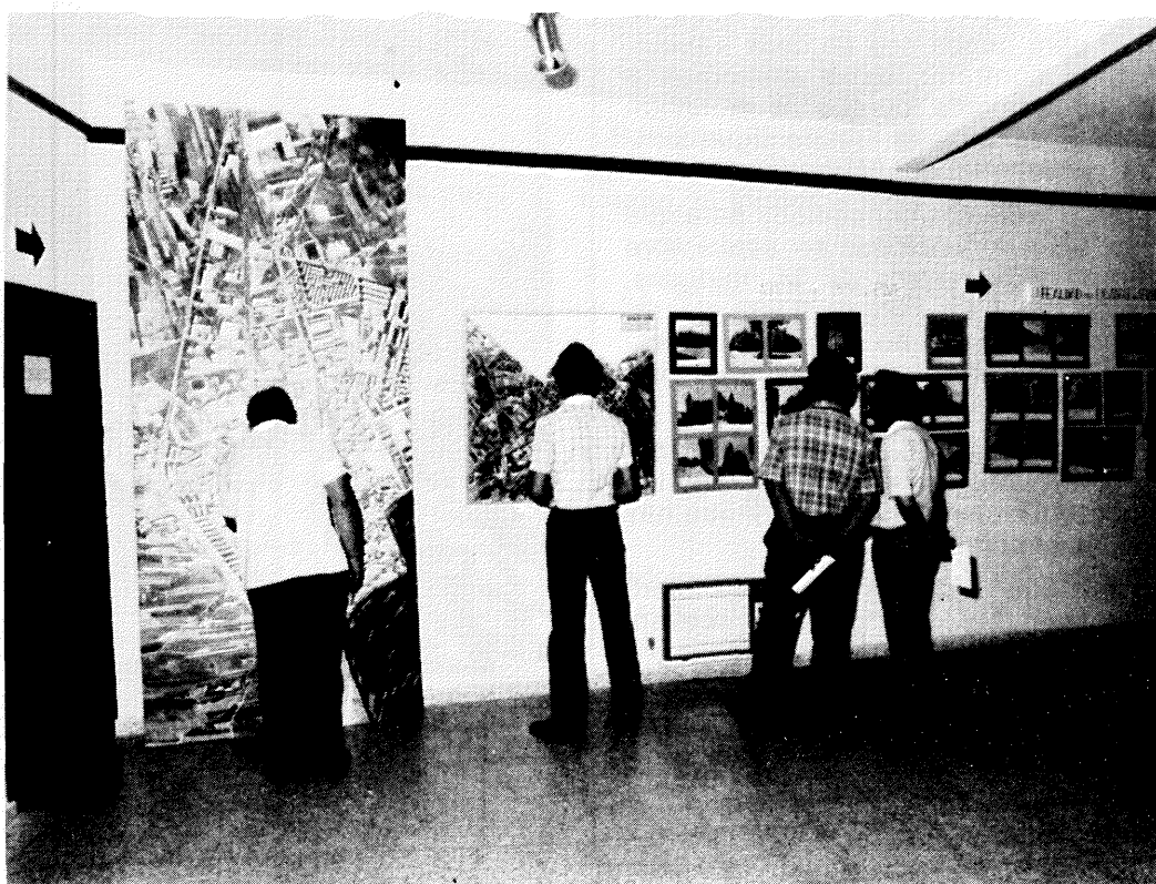
Antes de ser aprobado, el PERI estuvo expuesto. Ahora es el momento de hacer reclamaciones.