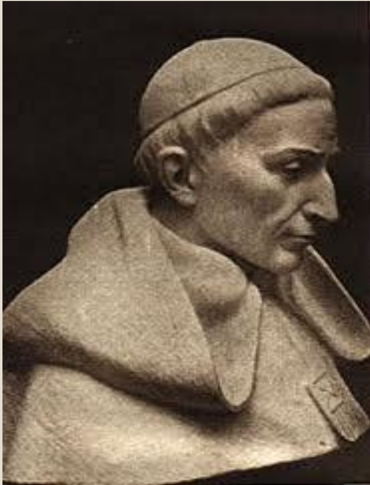
De Toledo a Madrid - Tirso de Molina (Seudónimo de Fray Gabriel Téllez; Madrid, 1584 - Almazán, 1648)

Labradoras, Getafe Leganés, mozos, Torrejón casaditas Pinto uno y otro. ¡Jesús que lindos! ¡Jesús que lindos! Torrejón, Valdemoro Getafe y Pinto