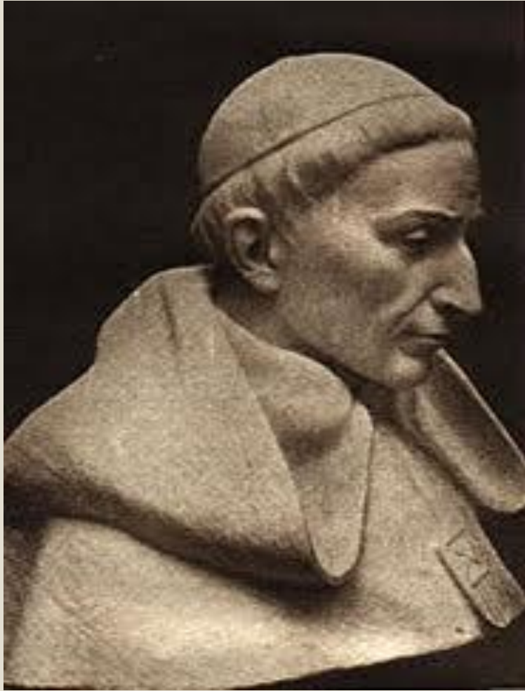
De Toledo a Madrid - Tirso de Molina (Seudónimo de Fray Gabriel Téllez; Madrid, 1584 - Almazán, 1648)