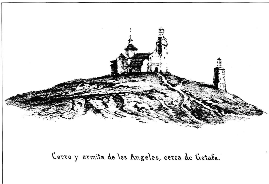
Cerro y ermita de los Angeles, cerca de Getafe.

Pero en lo esencial, el pueblo no cambia demasiado. El panorama