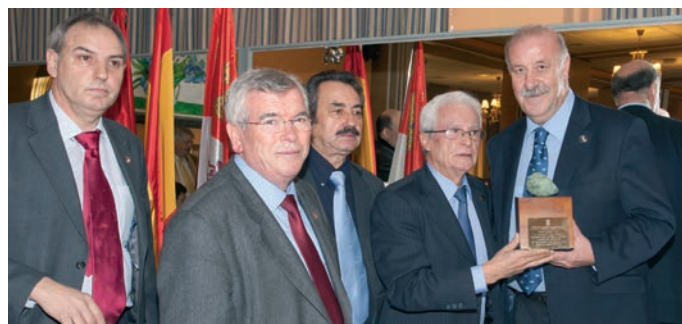
Vicente del Bosque, castellanoleonés distinguido por la Casa de Castilla y León.

El seleccionador nacional Vicente del Bosque, que llevó a la Roja a ganar el Mundial en junio de este año, ha sido el elegido por la Federación de Centros y Casas Regionales de Castilla y León en la Comunidad como ganador del Premio Surco, un galardón que se le ha entregado en la Casa Regional de Castilla y León de Getafe el pasado 11 de diciembre y que el entrenador ha recogido en persona. El acto se completó con la degustación de un cocido maragato y la velada estuvo amenizada por dulzaineros y el dúo musical Nostalgia.