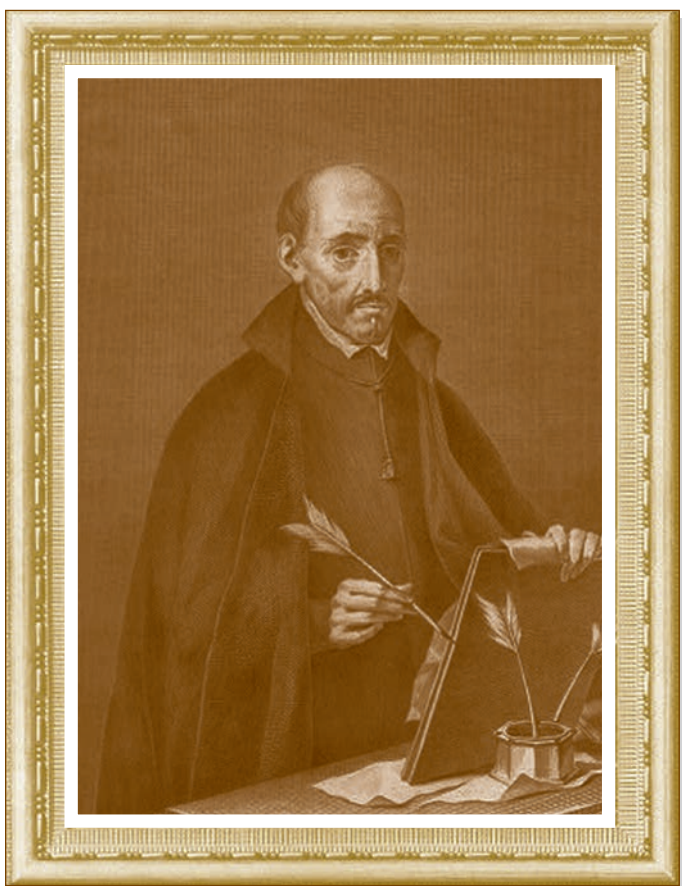
Grabado del escritor y poeta cordobés, Luis de Góngora y Argote (1561-1627).

El Teatro Auditorio Federico García Lorca, el Centro de Arte Ciudad de Getafe, la Iglesia Catedral Santa María Magdalena y la Iglesia de PP Escolapios recogerán la mayoría de las obras clásicas y los conciertos de antigua y sacra. Otros espectáculos y expresiones artísticas pasarán a las Parroquias de Cerro Buenavista, San Sebastián, San Eugenio, Justo y Pastor y a los Centros Cívicos y Centro de Poesía, mientras que el mercado de época volverá a ocupar la calle Ramón y Cajal y aledaños.