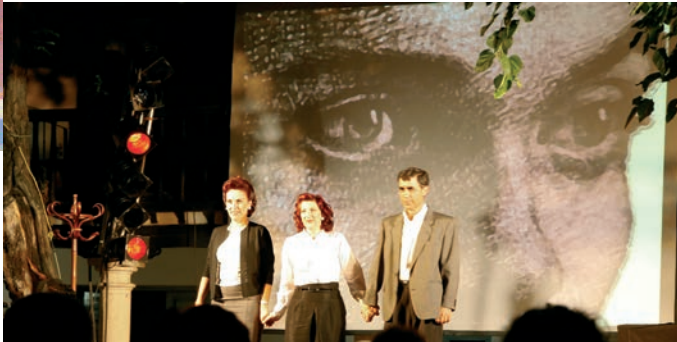
Representación teatral Miguel Hernández a través de las ondas en el Hospitalillo.