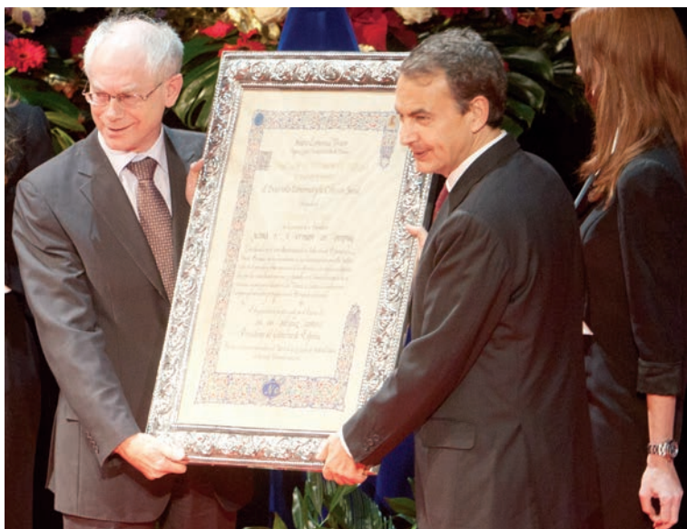
Herman Van Rompuy recibe el premio de manos del presidente.