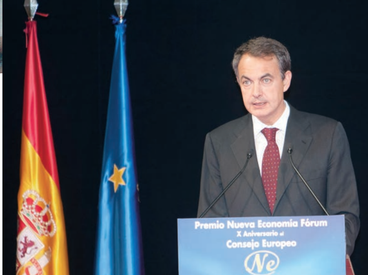
José Luis Rodríguez Zapatero en un momento de su intervención.