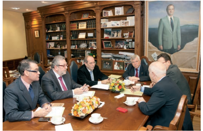
Última reunión de los alcaldes del sur en el Ayuntamiento de Getafe.

Por otra parte, el edil criticó las reducciones de la Comunidad en sus presupuestos regionales y recordó la deuda que el Gobierno de Esperanza Aguirre mantiene con Getafe: 66 millones de euros.