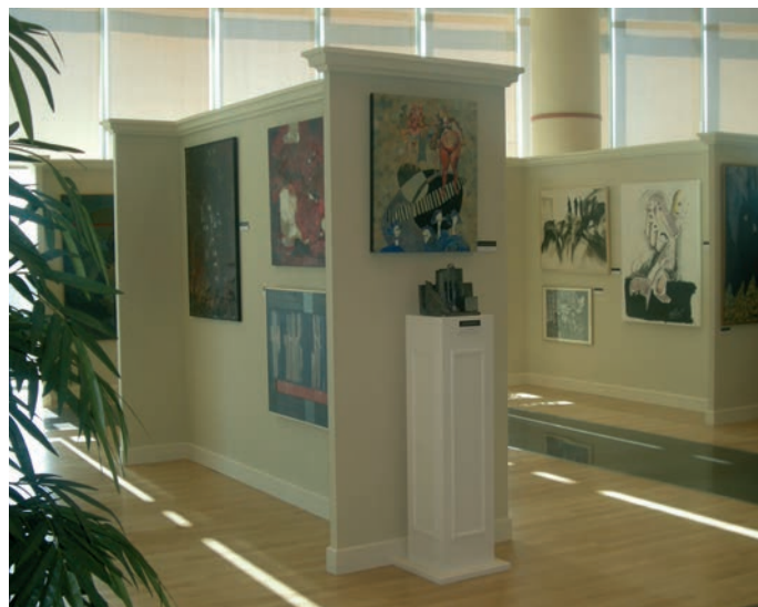
Espacio cedido por El Corte Inglés al colectivo La Carpa como sala de Exposiciones.