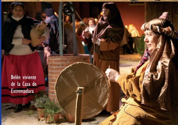
Belén viviente de la Casa de Extremadura

rán las cartas de 18.30 a 21.00 horas junto al belén murciano.