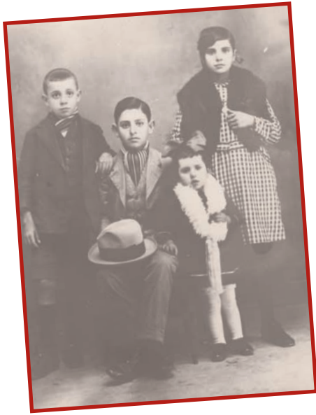
Miguel Hernández era el segundo hijo varón de una familia de Orihuela dedicada al pastoreo.