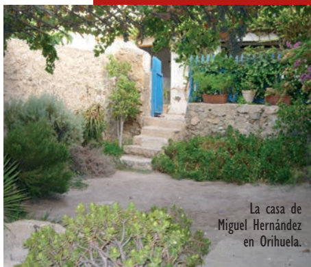
La casa de Miguel Hernández en Orihuela.

Y entre la Casa Museo y las Escuelas del Ave María, donde estudió el joven poeta, está el Centro de Estudios Hernandianos, que difunde la obra de Miguel Hernández, investiga y realiza proyectos educativos, entre otras iniciativas. Los tres espacios: Casa Museo, sala de exposiciones y Centro de Estudios Hernandianos forman el Rincón Hernandiano en Orihuela.