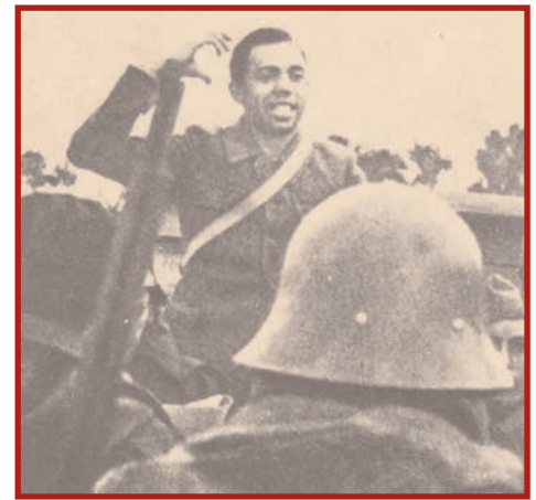
Se incorpora al Ejército Popular de la República y es nombrado comisario de Cultura.