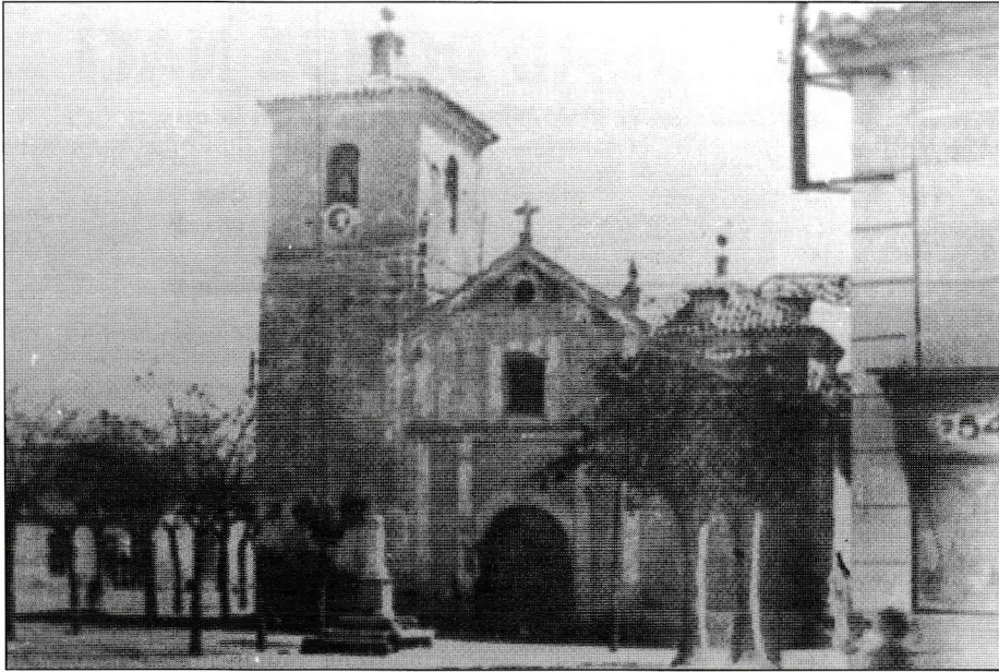
Antigua iglesia de San Eugenio (Iglesia Chica)