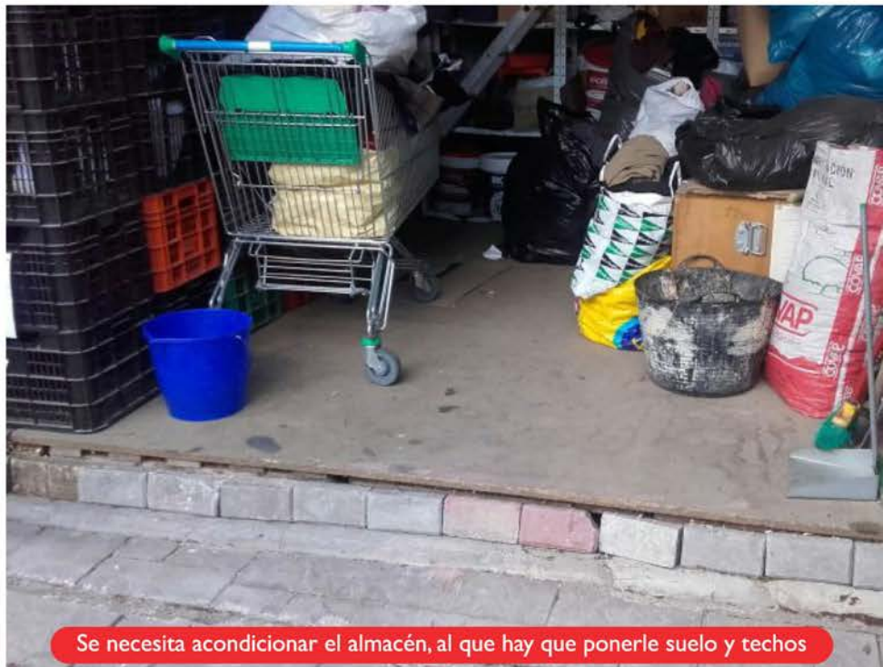
Se necesita acondicionar el almacén, al que hay que ponerle suelo y techos

Necesitan fondos para poder acondicionar otro almacén cercano, pero éste no tiene techo ni suelo. Por esa razón se cuelan los animales