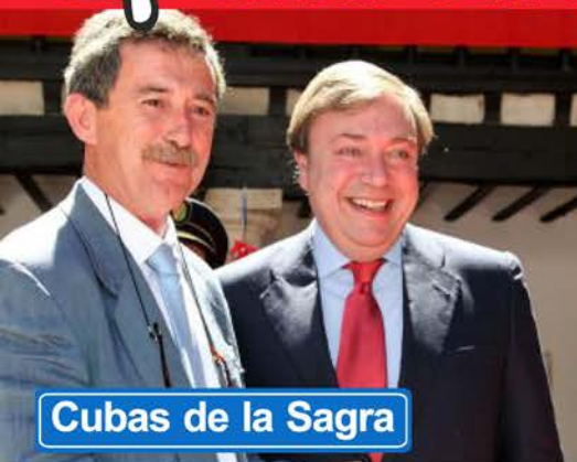
Cubas de la Sagra