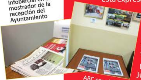
ABC en edificios municipales

Infobercial en el mostrador de la recepción del Ayuntamiento