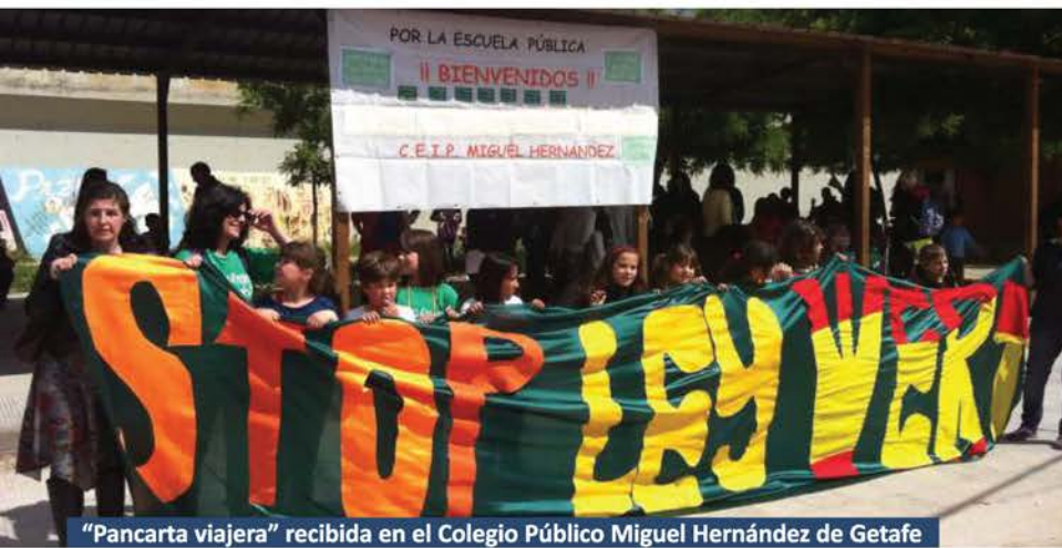
"Pancarta viajera" recibida en el Colegio Público Miguel Hernández de Getafe

Los portavoces del AMPA fueron categóricos sobre las consecuencias de la entrada en vigor de la Ley: "aumentará la ratio de alumnos en las aulas eliminando apoyos en materias instrumentales, como lenguaje y matemáticas. Se reducirán asignaturas centrando la carga lectiva en unos contenidos elementales y se aislará la enseñanza artística de la educación integral. Además, se plantea la segregación de alumnos por sexo y los que opten por las enseñanzas aplicadas (FP) no tendrán ninguna titulación de aprovechamiento de la ESO. Pero sin duda, el colmo de los despropósitos es la eliminación de todas las atribuciones de los Consejos escolares que quedan únicamente como órganos consultivos en manos de las decisiones unilaterales de la dirección del centro" .