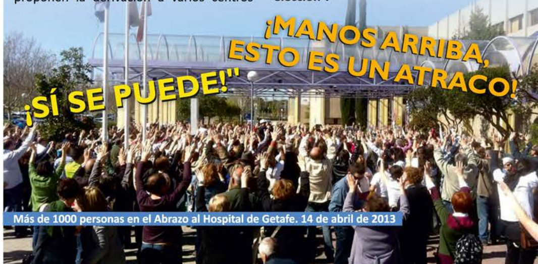
Más de 1000 personas en el Abraza al Hospital de Getafe. 14 de abril de 2013

Todos los profesionales consultados afirman que esta situación supone la vulneración de la Ley 12/2001, de 21 de diciembre, de Ordenación Sanitaria de la Comunidad de Madrid que recoge como uno de sus principios rectores, “la orientación del Sistema a los ciudadanos, estableciendo los instrumentos necesarios para el ejercicio de sus derechos, reconocidos en esta Ley, especialmente la equidad en el acceso y la libertad de elección”.