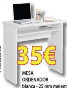
MESA ORDENADOR blanca - 25 mm melamina