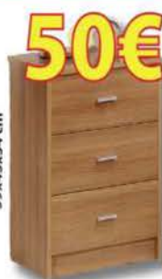
MESA DE NOCHE 3 cajones. Varios colores