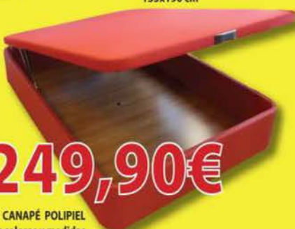
CANAPÉ POLIPIEL Varios colores y medidas