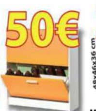
ZAPATERO 2 trampones

VENTA DE MÁS 200 MUEBLES PROCEDENTES DE EXPOSICIÓN