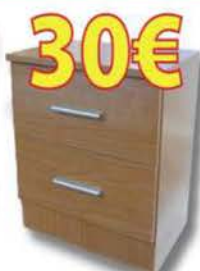
MESA DE NOCHE 2 cajones. Varios colores