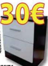
MESA DE NOCHE 2 cajones. Varios colores