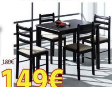
MESA + 4 SILLAS disponible en Wengue y Cerezo - 110x70 cm