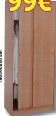
ARMARIO CON PUERTAS CORREDERAS

VENTA DE MÁS 200 MUEBLES PROCEDENTES DE EXPOSICIÓN