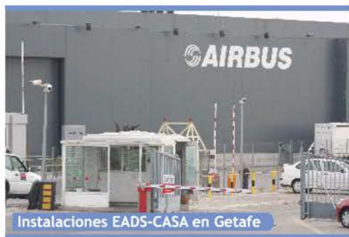
Instalaciones EADS-CASA en Getafe