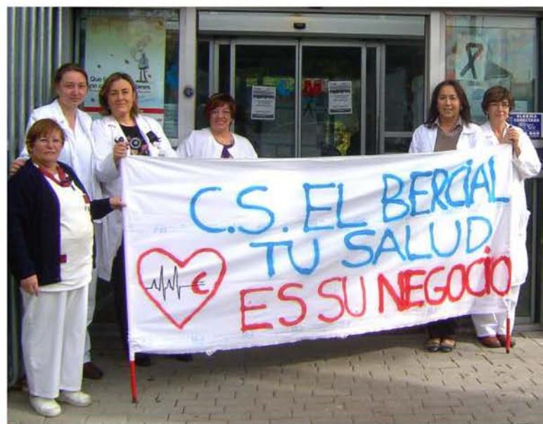
Profesionales sanitarias del Centro de Salud "El Bercial"

Lo más importante es que todos entendamos que estamos luchando solo y exclusivamente para defender la Sanidad Pública. No se habla de sueldos, ni de pagas extras, ni nada por el estilo. Tenemos que ser conscientes de que una vez privatizado un Centro de Salud, tardaremos diez años, o los que sean, en recuperarlo. Nos estamos jugando mucho, está en peligro todo el Sistema de Salud Pública y estamos seguros de que todos juntos, profesionales y pacientes, podemos detenerlo.