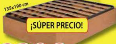
CANAPÉ LÁMINAS Cerezo, blanco, wengue