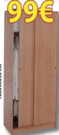
ARMARIO CON PUERTAS CORREDERAS