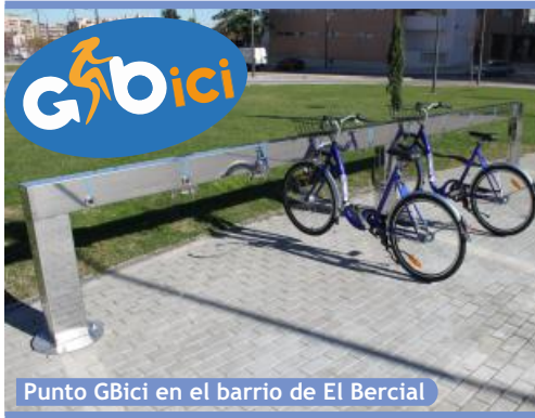
Punto GBici en el barrio de El Bercial

► Se ha adjudicado a una fundación, con un coste de 536.000 euros para los vecinos