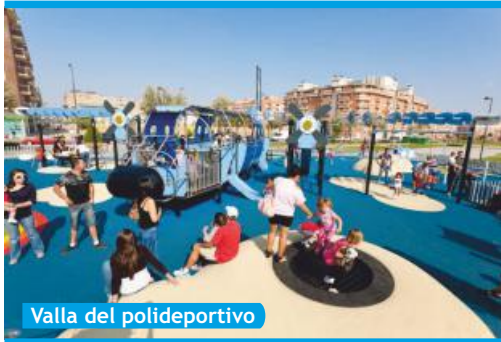
Valla del polideportivo

► El primer Parque Temático infantil de Europa, una petición de la Asociación Vecinal Nuevo Bercial - (NUBER) desarrollada por el Gobierno Municipal en 2011