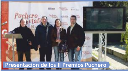
Presentación de los II Premios Puchero

► NUBER se reunió con ACOEG y los hosteleros de El Bercial para impulsar la presencia de éstos y la de todos los barrios en el evento.