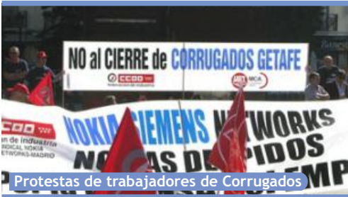
Protestas de trabajadores de Corrugados

► Las familias expresan su enfado con el Ayuntamiento por no haber hecho nada para evitarlo