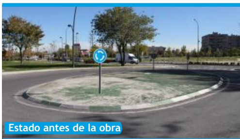
Estado antes de la obra