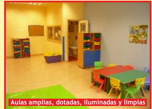
Aulas amplias, dotadas, iluminadas y limpias