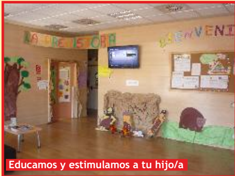
Educamos y estimulamos a tu hijo/a