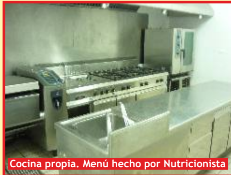
Cocina propia. Menú hecho por Nutricionista