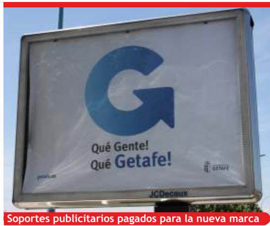
Soportes publicitarios pagados para la nueva marca

PSOE, IU desaprueban el gasto. UPyD manifiesta dudas sobre su legalidad