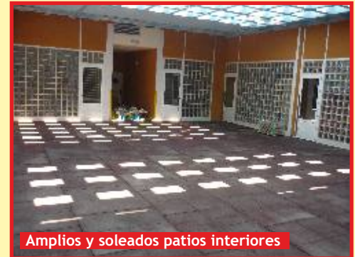
Amplios y soleados patios interiores