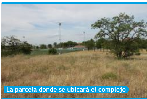
La parcela donde se ubicará el complejo

En la parcela deportiva destinada a la construcción del Balneario-SPA municipal