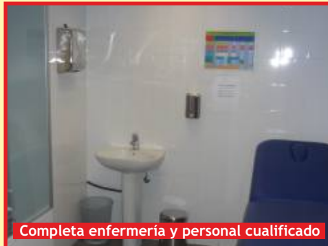
Completa enfermería y personal cualificado