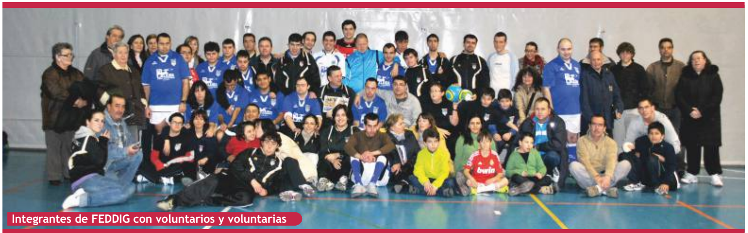
Integrantes de FEDDIG con voluntarios y voluntarias

Desde el 2008 en el barrio de El Bercial, ayudando a integrar deportistas