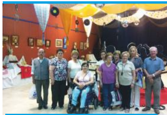
Algunos de los alumnos y voluntarios del centro

El centro cívico de El Bercial inauguró su exposición de fin de curso en la que se exhiben los trabajos desarrollados en los talleres impartidos durante el año y en los que han participado en torno a 700 alumnos y alumnas, haciendo patente su esfuerzo realizado.