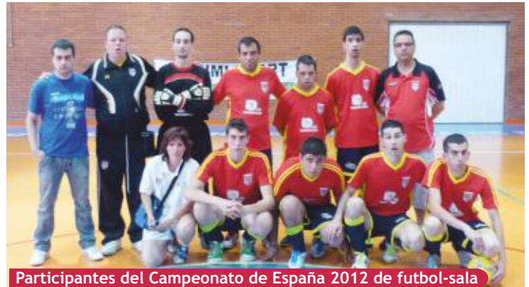
Participantes del Campeonato de España 2012 de fútbol-sala

sala, celebrado los días del 23 al 27 de mayo en Murcia, llegaron a las semifinales, quedando finalmente clasificados en cuarta posición, siendo la primera vez que participaba en el mismo un equipo de la ciudad de Getafe.