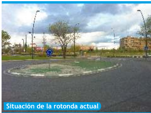
Situación de la rotonda actual

El pasado 24 de abril, en la Junta de Gobierno Local del Ayuntamiento de Getafe, se aprobó por unanimidad el proyecto de "Remodelación de la rotonda en la Avenida de las Trece Rosas", dentro del punto 23 del orden del día.