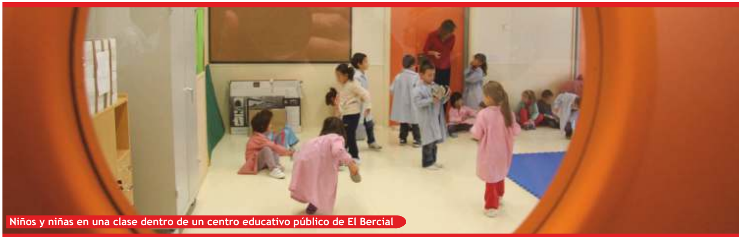
Niños y niñas en una clase dentro de un centro educativo público de El Bercial

Las AMPAS de los colegios de El Bercial temen que la demanda de plazas escolares supere ampliamente la oferta