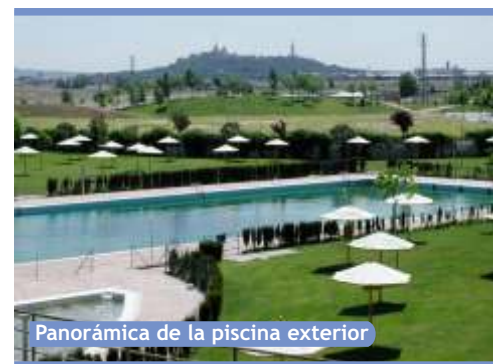
Panorámica de la piscina exterior

Ahora el objetivo es decidir un nuevo modelo de gestión para esta piscina, ya que desde el Consistorio defienden que la mala gestión del anterior Gobierno municipal ha derivado en un