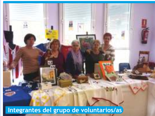
Integrantes del grupo de voluntarios/as

Un año más, y ya van 10, el grupo de solidaridad "Frente a una Mirada" ha llevado a cabo su tradicional rifa solidaria, con el objetivo de recaudar fondos que lleven a entidades sociales a mantener sus actividades. Esta vez, la entidad elegida ha sido la Asociación de Minusválidos de Vicálvaro (AMIVI).