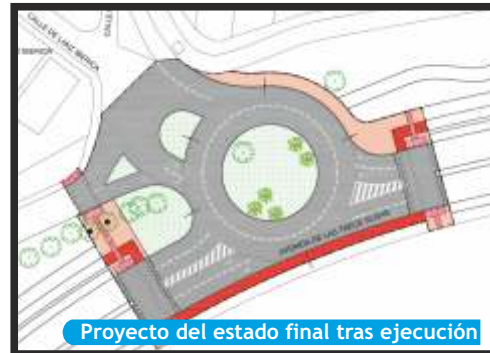
Proyecto del estado final tras ejecución

El plazo de ejecución de la obra se estipula en dos meses.