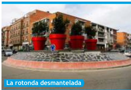
La rotonda desmantelada

El barrio de El Bercial cuenta, desde hace pocos días, con nuevos árboles plantados en la Avenida de las Trece Rosas, muy cerca de la rotonda que en breve será remodelada.