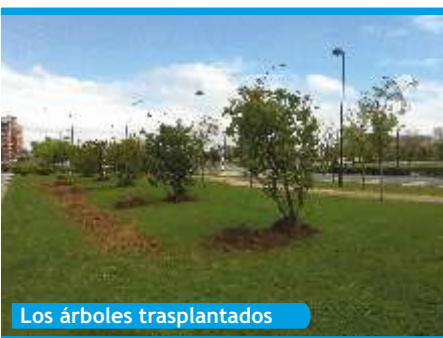
Los árboles trasplantados