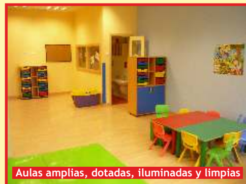
Aulas amplias, dotadas, iluminadas y limpias