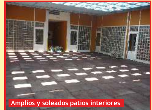
Amplios y soleados patios interiores