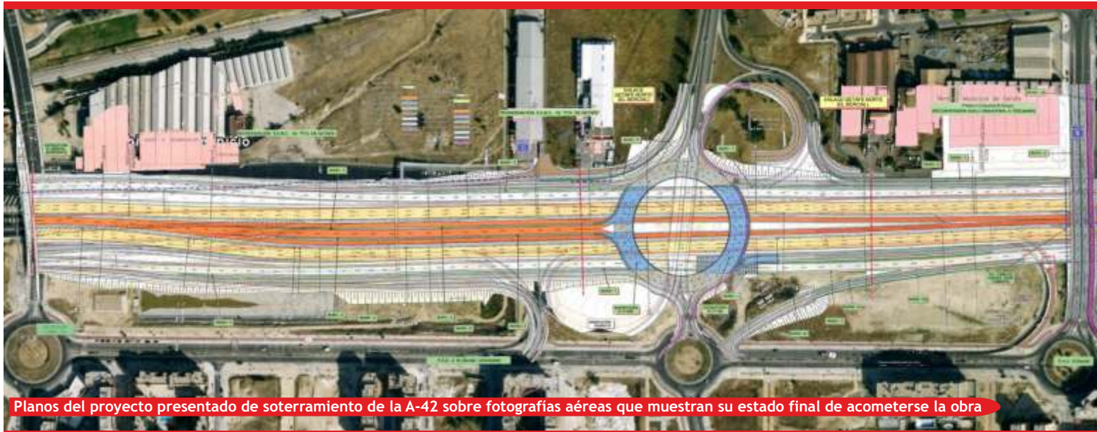
Planos del proyecto presentado de soterramiento de la A-42 sobre fotografías aéreas que muestran su estado final de acometerse la obra

Tras anunciarse en 2010 que se paralizaba durante dos años, co