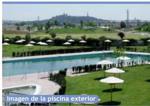
Imagen de la piscina exterior

Aprueba un gasto de 800.000 euros para ampliar el contrato hasta finales de agosto