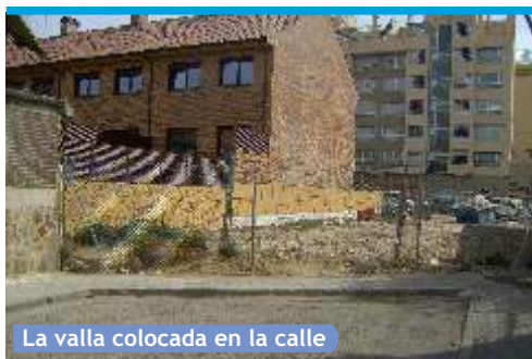
La valla colocada en la calle

Los residentes se muestran preocupados por si el cierre de su calle, en caso de accidente, pudiera convertirla en una "ratonera" sin salida