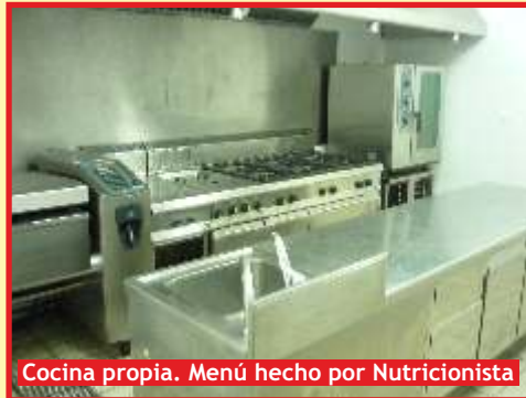
Cocina propia. Menú hecho por Nutricionista