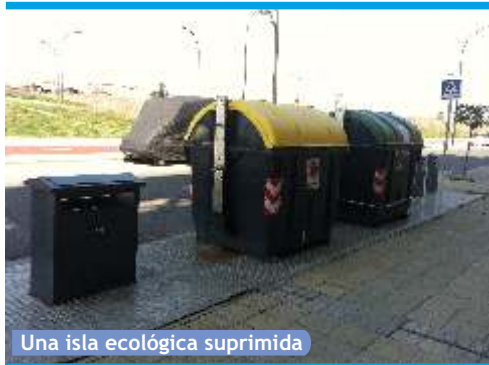
Una isla ecológica suprimida

La supresión de algunas islas ecológicas no ha gustado a los vecinos y vecinas de El Bercial por lo que han llamado a la movilización, mediante la colocación de cientos de carteles en los contenedores aéreos colocados en las islas ecológicas suprimidas.