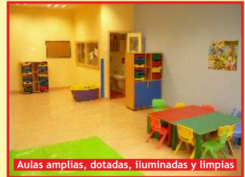
Aulas amplias, dotadas, iluminadas y limpias