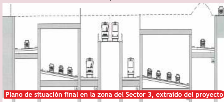
Plano de situación final en la zona del Sector 3, extraído del proyecto

★ Y, lo más importante, sólo una parte del trazado que discurre por El Bercial iría soterrado, el resto iría al aire libre.