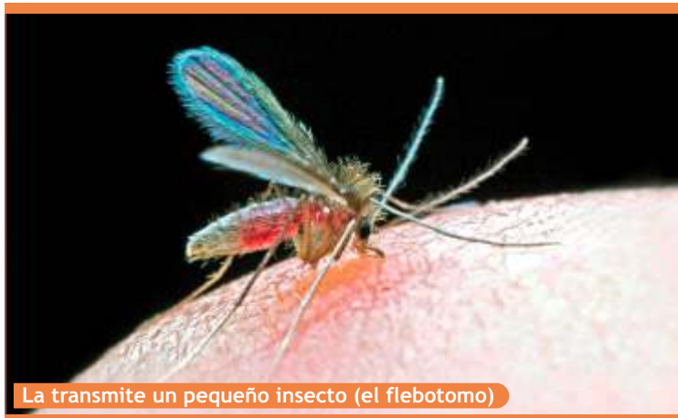
La transmite un pequeño insecto (el flebotomo)

La leishmaniosis canina está causada por un protozoo del género Leishmania , un parásito microscópico que se transmite a los perros, de manera exclusiva, a través de la picadura de un pequeño insecto (el flebotomo), siendo imposible la transmisión directa de la misma.