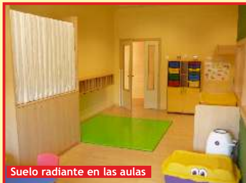
Suelo radiante en las aulas