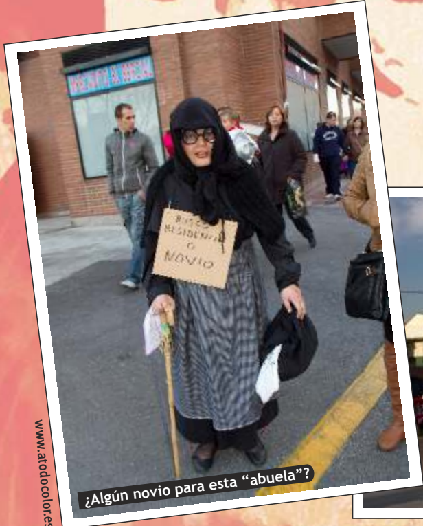
¿Algún novio para esta "abuela"?