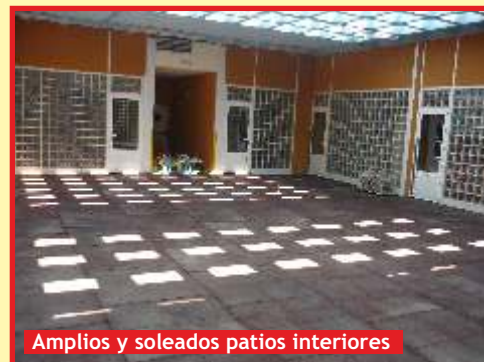
Amplios y soleados patios interiores