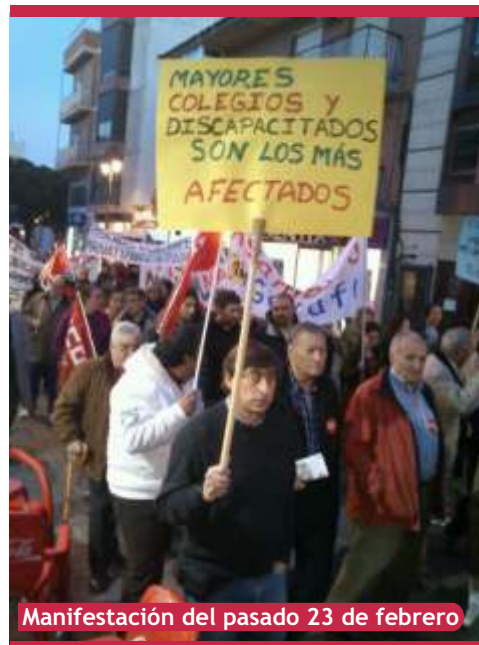
Manifestación del pasado 23 de febrero

Por su parte UPyD va a presentar en el próximo pleno una propuesta en la que insta al gobierno a mantener el sistema actual de gestión hasta el 31 de Diciembre. Esta propuesta aunque fuera apoyada por todos los grupos de la oposición no tendría validez, ya que es el gobierno municipal, de manera unilateral, el que decide si quiere prorrogar o no, porque no es competencia del pleno. Además, UPyD solicitará dentro de esta propuesta que se revise la política de precios del Complejo Acuático Getafe Norte para hacer más viable la actividad, con el cobro de una cantidad simbólica en aquellas actividades que ahora son gratuitas.