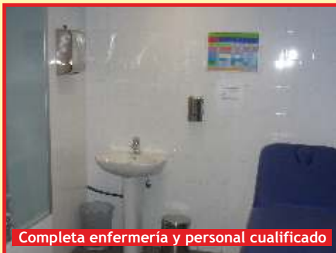
Completa enfermería y personal cualificado