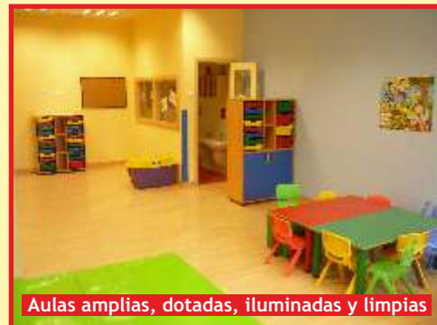
Aulas amplias, dotadas, iluminadas y limpias