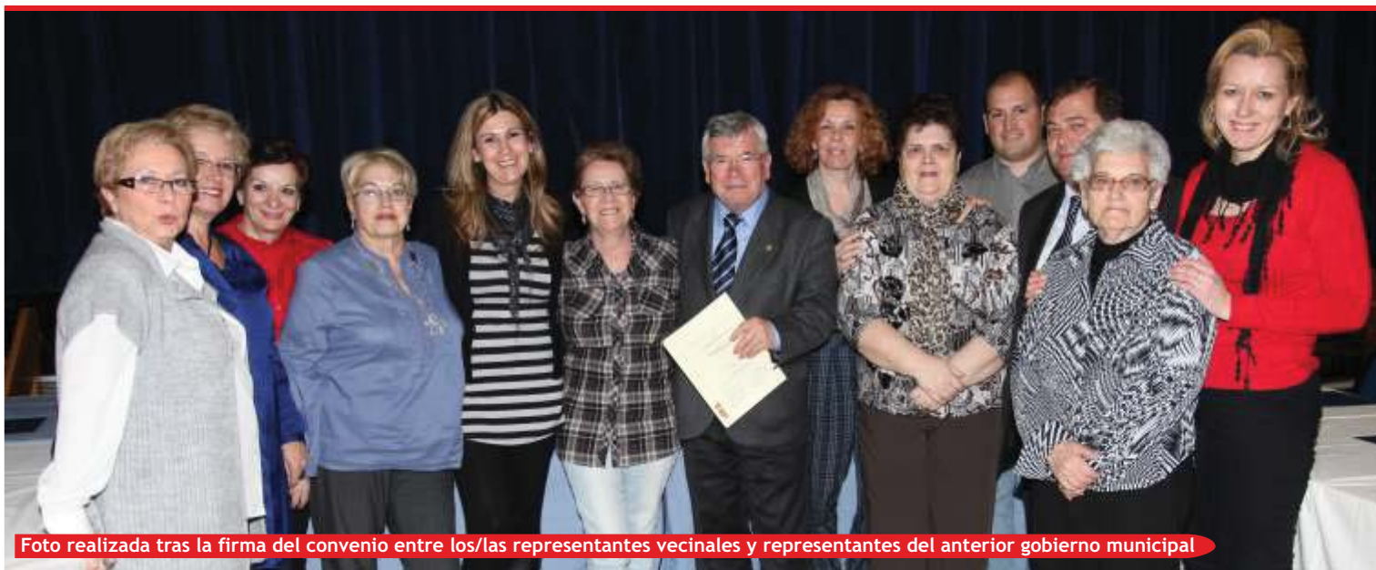
Foto realizada tras la firma del convenio entre los/las representantes vecinales y representantes del anterior gobierno municipal

Este convenio recoge peticiones vecinales realizadas por entida