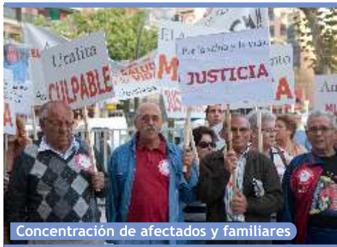
Concentración de afectados y familiares

La multinacional ha sido condenada a pagar 1,7 millones de euros a 23 empleados