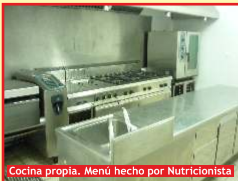
Cocina propia. Menú hecho por Nutricionista