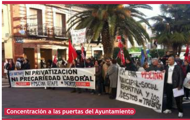
Concentración a las puertas del Ayuntamiento

●●● Texto enviado por los Trabajadores y trabajadoras del Complejo Acuático de Getafe Norte