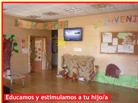
Educamos y estimulamos a tu hijo/a