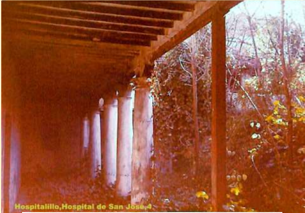
Hospitalillo, Hospital de San José, 4