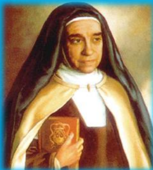
SANTA MARAVILLAS DE JESUS