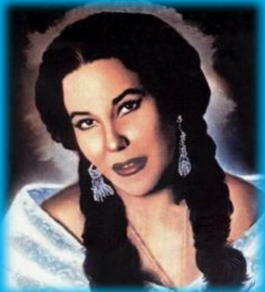
CARMEN DE VERACRUZ