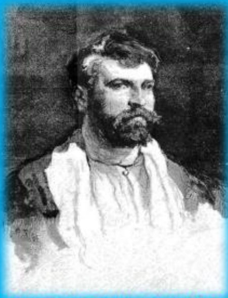
DANIEL URRABIETA VIERGE