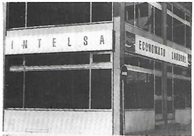
« Vista parcial de nuestro Economato.