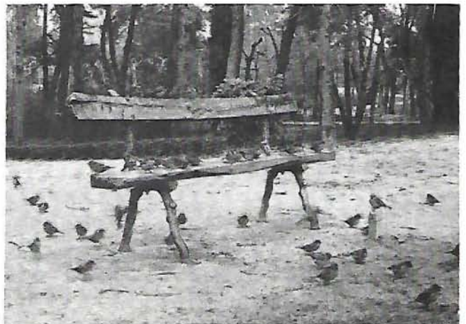
Tema Libre: PRIMER PREMIO